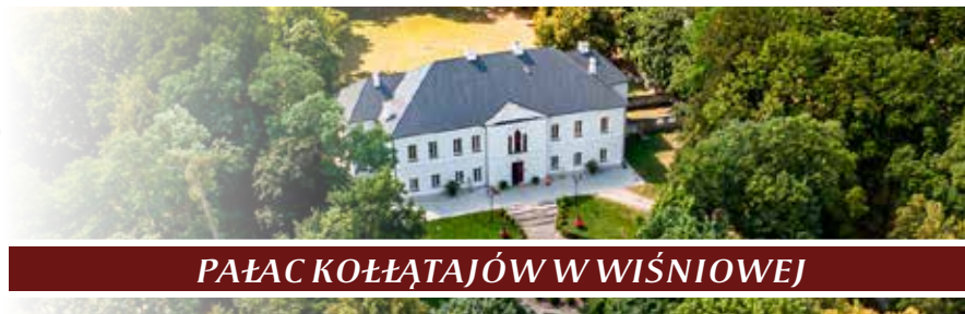
PAŁAC KOŁŁATAJÓW W WIŚNIOWEJ