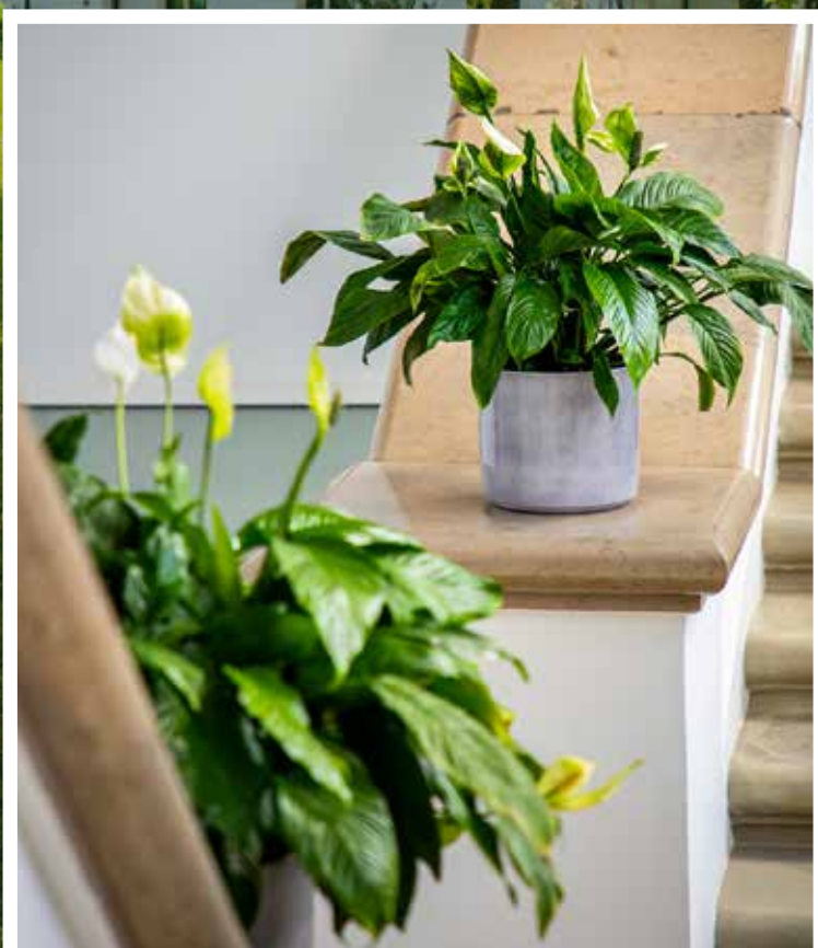
Pałac Kollatajów w Wiśniowej zakwitł!