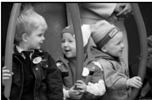
O fajnej zabawie świadczą zadowolone buzie przedszkolaków.