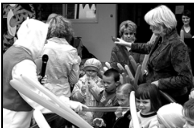
Kubuś Puchatek pasuje przedszkolaków.