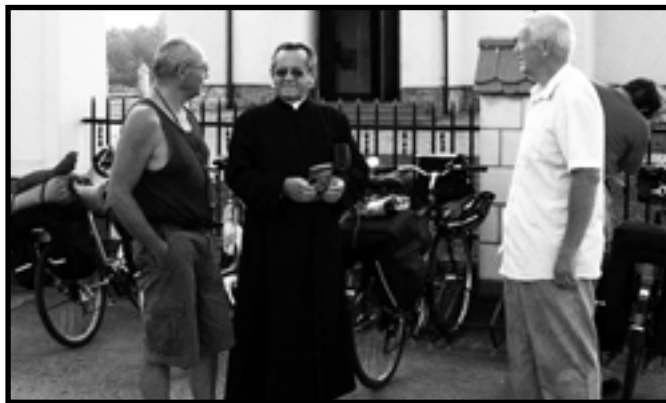
Spotkanie z księdzem w Monasterzu