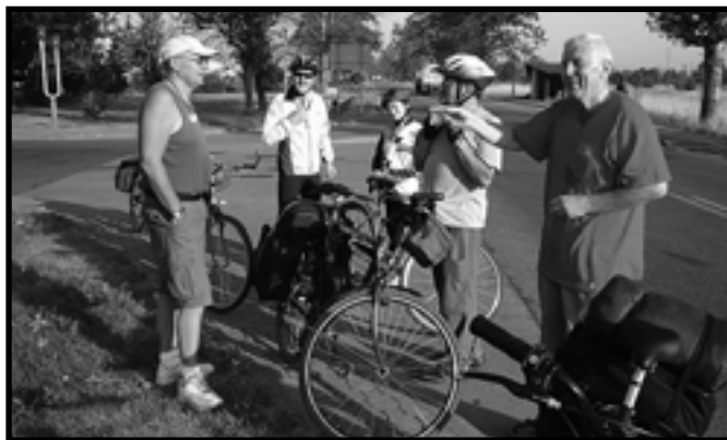
Na skrzyżowaniu w Połańcu