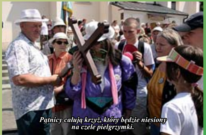
Pątnicy całują krzyż, który będzie niesiony na czele pielgrzymki.