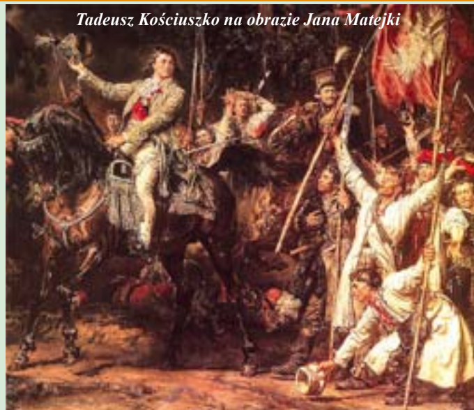
Tadeusz Kościuszko na obrazie Jana Matejki

po złożeniu przysięgi wierności carowi, w 1797 wyjechał do Stanów Zjednoczonych. W lipcu 1798 przybył do Paryża, gdzie współdziałał przy tworzeniu Legionów Polskich. Zmarł w Szwajcarii (w Solurze), gdzie spędził ostatnie lata swego życia. Pochowany na Wawelu.