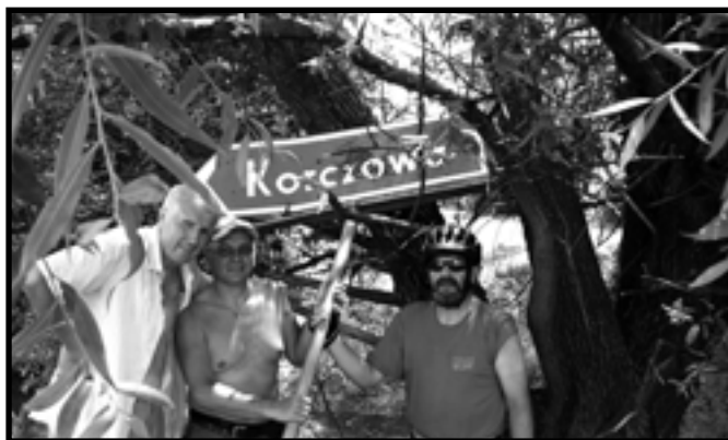
Korczowa już niedaleko