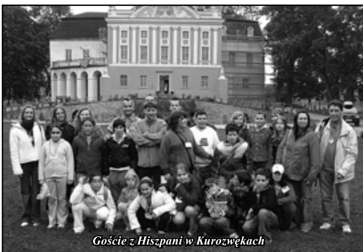
Goście z Hiszpani w Kurozwękach