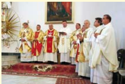
Księża celebrujący mszę świętą.