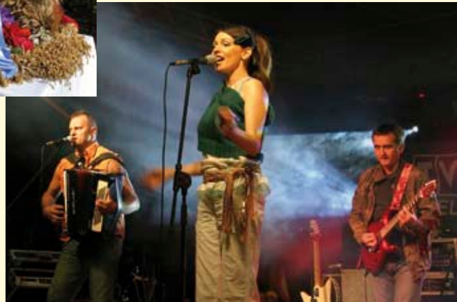
Koncert zespołu BRATHANKI.