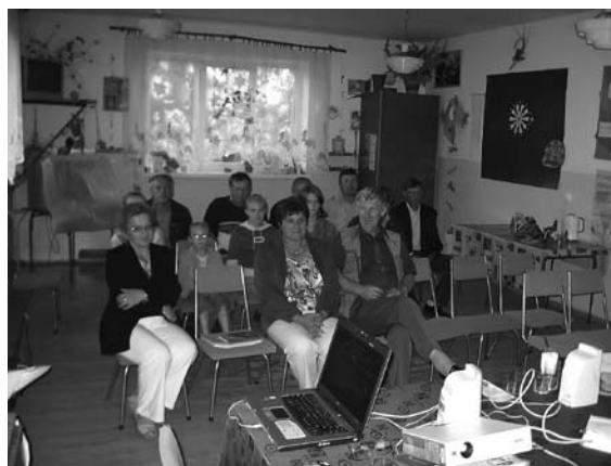
Uczestnicy spotkania w Niemścicach.