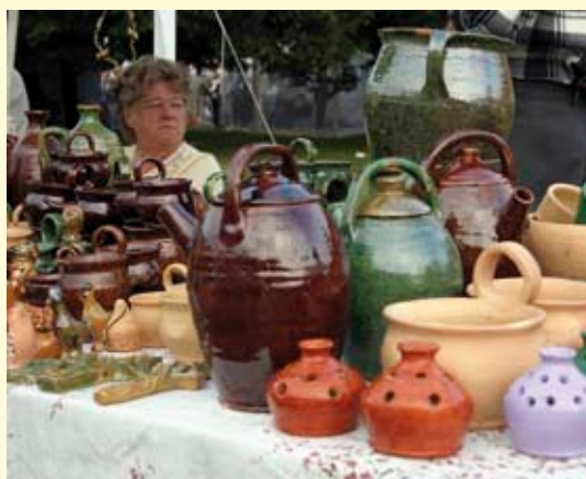
Jedno z wielu stoisk z rzemiosłem.