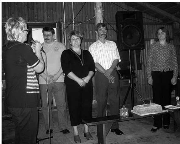
Oficjalne rozpoczęcie pikniku Klubu Abstynenta „Strumyk”.

którzy podejmują całkowitą wstrze-mięźliwość w tym względzie. Razem podejmując trud pielgrzymowania na Jasną Górę w duchu wynagrodzenia