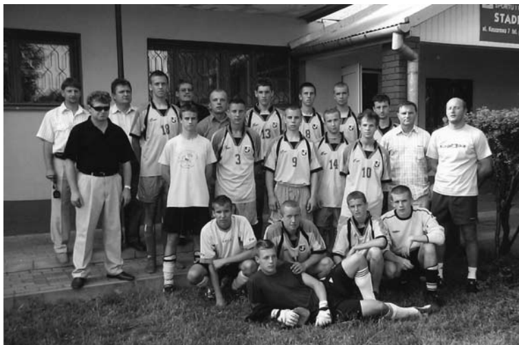
Drużyna juniorów starszych z trenerem i zarządem Klubu.