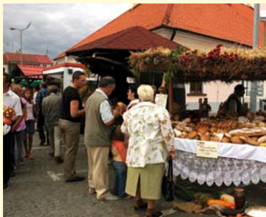
Stylizowane stoisko z chlebem.