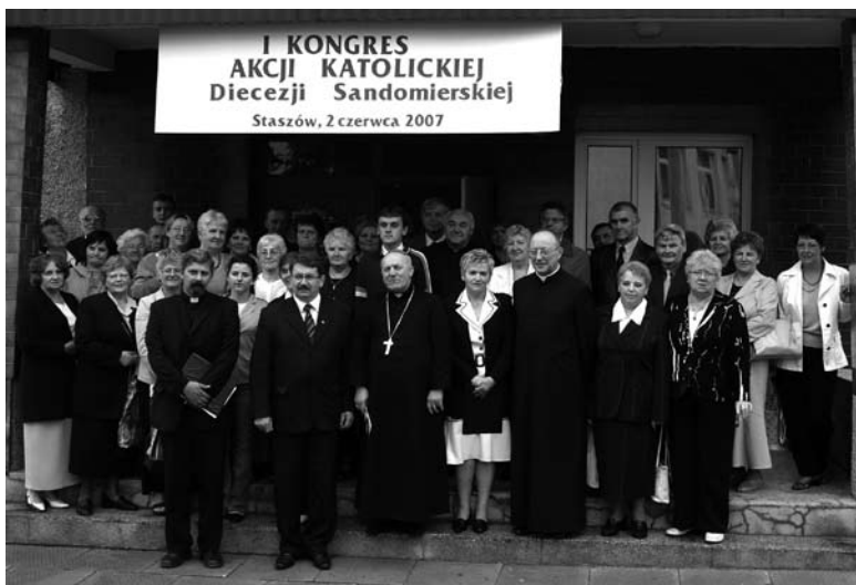
Uczestnicy I Kongresu Akcji Katolickiej Diecezji Sandomierskiej w Staszowie.

który zakończył 2. dzień I Kongresu Akcji Katolickiej Rejonu Świętokrzyskiego w Staszowie.