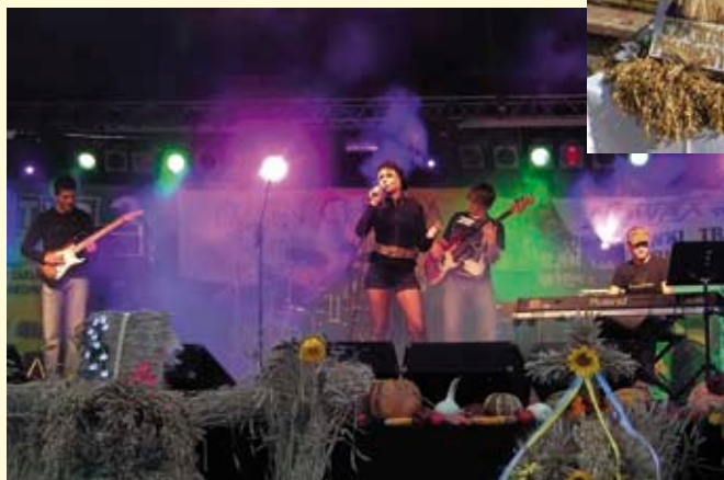
Koncert zespołu KAKADU.