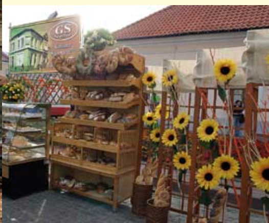
Stoisko GS Staszów z pieczywem.