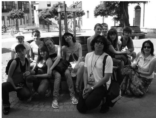
Z rewizytą we Frankenbergu przebywali uczniowie i nauczyciele staszowskiej dwójki.

Niedziela, 10 czerwca minęła w nastroju regionalnym. Zwiedziliśmy pałac w Augustusburgu i śliczny zamek w Kriebstein. To nie wszystko: promem z Kriebsteinu popłynęliśmy promem do Lauenhain, gdzie czekały na nas kajaki. Po dwóch godzinach wiosłowania- wspólny, pożegnalny grill. Po uroczy-