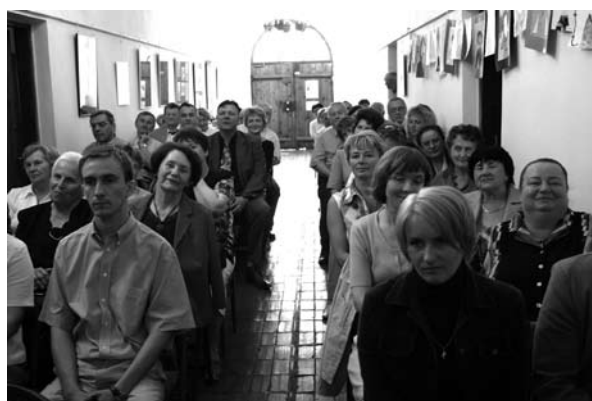
Uroczystości odbywały się w Galerii Punkt w staszowskim ratuszu. Na zdjęciu goście.

Pod pewnymi względami przełomowy dla działalności Biblioteki okazał się rok 2005. Wówczas zainicjowana została działalność Czytelni Internetowej, która zapewnia bezpłatny dostęp do Internetu. Tylko w roku ubiegłym z Czytelni tej skorzystało 3700 osób. To również w połowie 2005 roku rozpoczęły się prace nad tworzeniem katalogu komputerowego. Program, w którym tworzony jest katalog komputerowy to