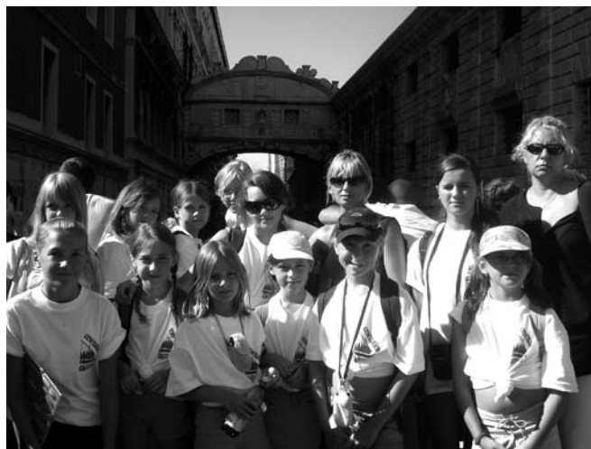
Uczestniczki turnusu.

We Włoszech przebywało 15 dziewcząt, uczennice staszowskich szkół: PSP 3 i PSP 2 oraz Gimnazjum nr1 i Gimnazjum nr 2. Wśród nich znajdowały się wicemistrzynie Polski sprzed dwóch lat. Najmłodsze