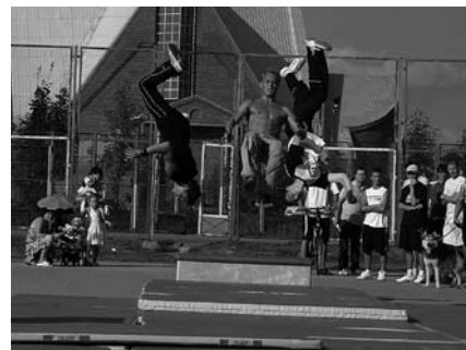
Grupa Free Running - le parkour.

Ponad to przez cały dzień trwały projekcje video filmów amatorskich, można