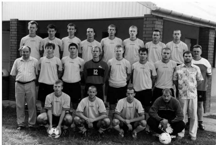
Oni wywalczyli awans do IV Ligi.