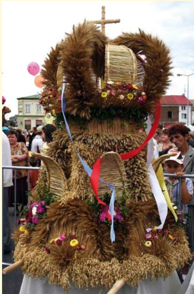
Wieniec z Niemścic zajął pierwsze miejsce w konkursie na najładniejszy wieniec dożynkowy.