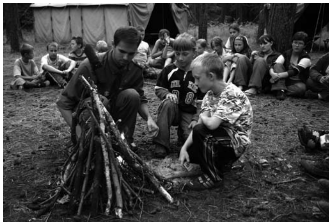
Przywilej zapalenia ogniska przypada najmłodszym w grupie. Zgodnie z harcerskim obyczajem nie wolno używać zapalniczki.