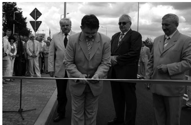
Na zdjęciu burmistrz Andrzej Iskra przecina wstęgę w trakcie uroczystości otwarcia ronda w Staszowie.

Rondo poświęcił ks. prałat Henryk Kozakiewicz.