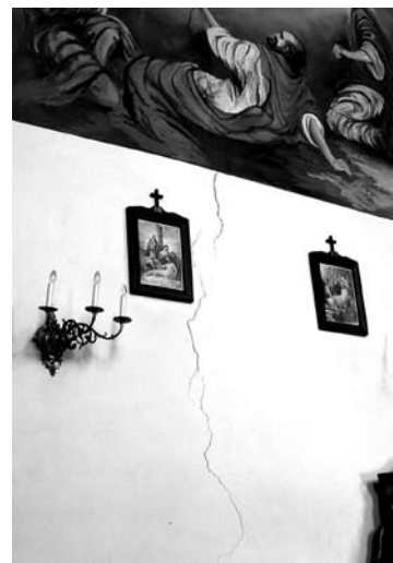
Północna ściana kościoła - widok od wewnątrz 2005 r.

Parafia przystąpiła do realizacji drugiego etapu prac renowacyjnych, który