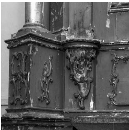
Główny ołtarz w Kaplicy Tęczyńskich - przed remontem.