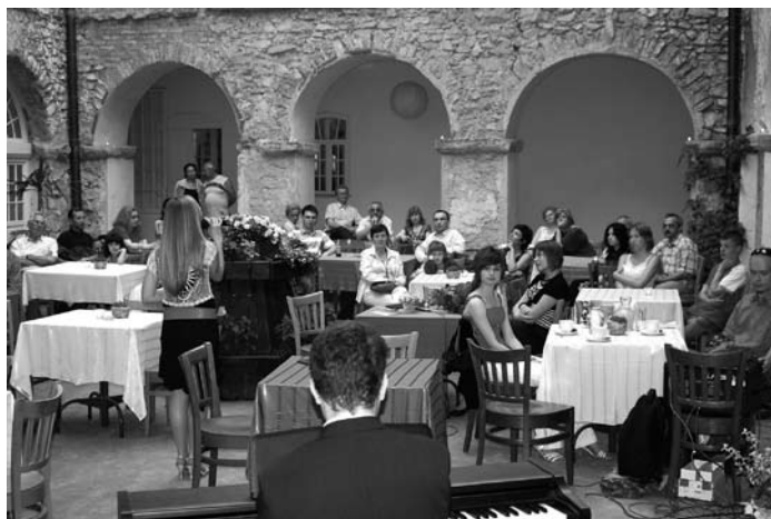
Recital odbył się na dziedzińcu Pałacu w Kurozwałkach.