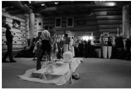
Wystawa szkła gospodarczego. tędy przechodził.

Dużą ekspozycję ze sztuką ludową prezentował Staszowski Ośrodek Kultury. Tu można było również zobaczyć garncarza przy pracy, czy wikliniarza wyplatającego kosze. Firma GMC pokazywała w jaki sposób powstają bąbki choinkowe oraz kilkadziesiąt przeróżnych wzorów tego pięknego staszowskiego wyrobu. W centrum budynku umiejscowiono wystawę szkła gospodarczego. Przeróżne wzory, kształty i kolory zachwyciły każdego kto