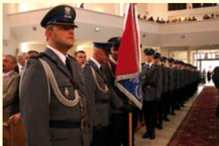
Kompania Reprezentacyjna Policji z Kielc.