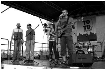
Koncert zespołu TERAZ JUŻ.