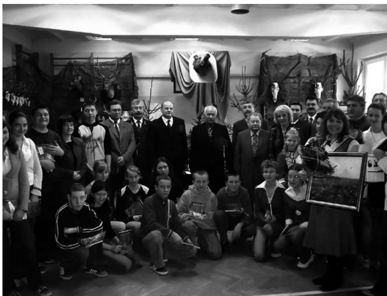
Uczestnicy programu „Szumią knieje”.