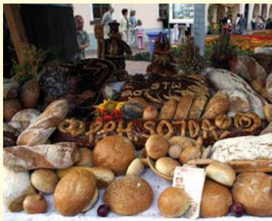
Wypieki staszowskiej piekarni.