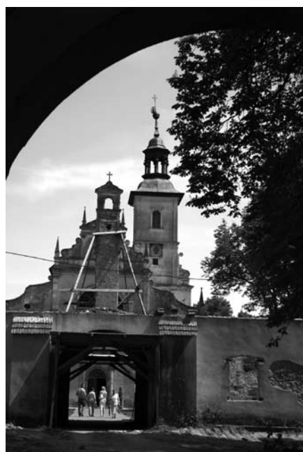
Klasztor w Rytwianach.

Stowarzyszenie Miłośników Pustelni Złotego Lasu w Rytwianach przed 5 laty rozpoczęło działalność wspierając Diecezjalny Ośrodek Kultury i Edukacji „Źródło” w odbudowie Pustelni Rytwiańskiej.