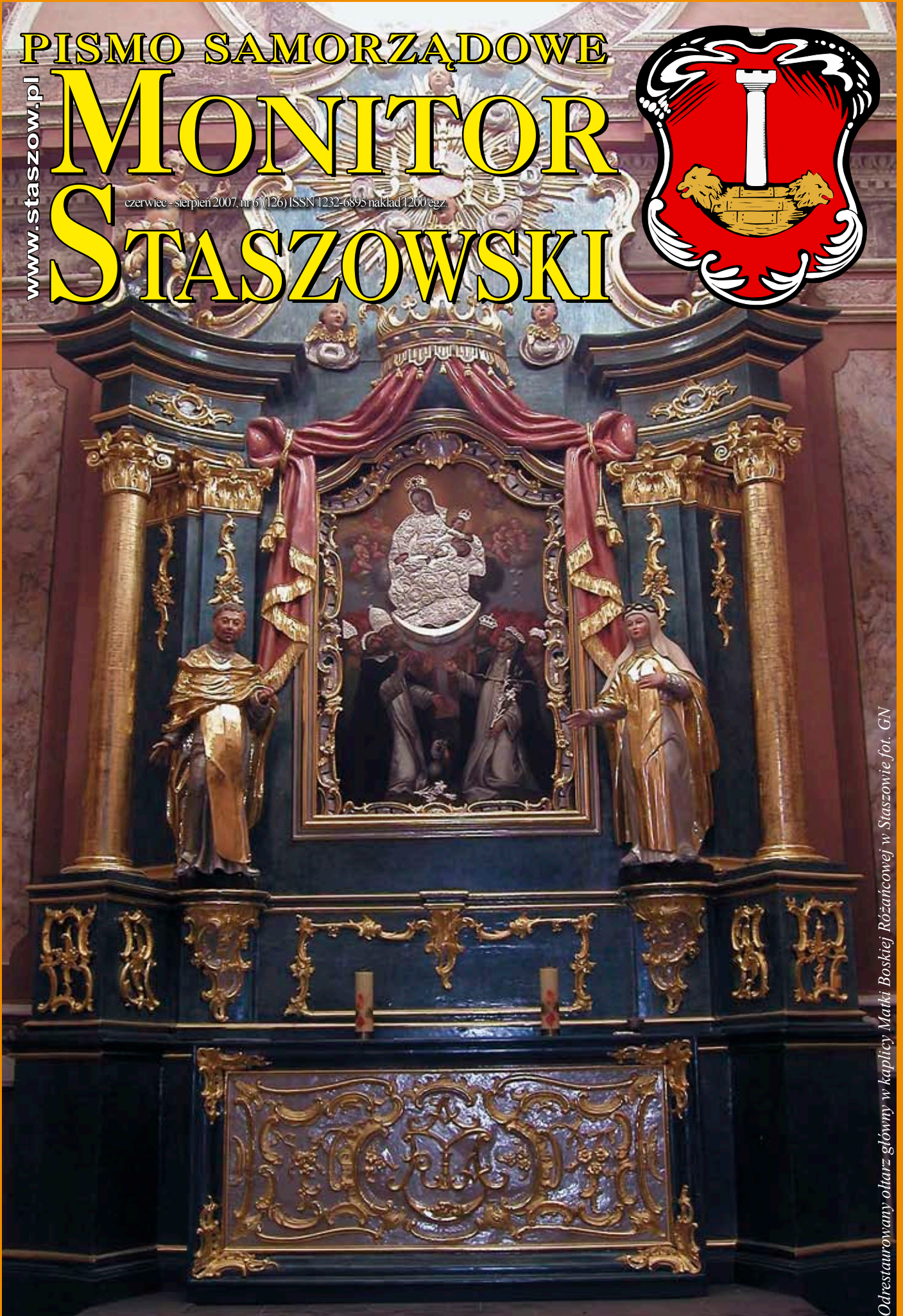
Odrestaurowany ołtarz główny w kaplicy Matki Boskiej Różańcowej w Staszowie