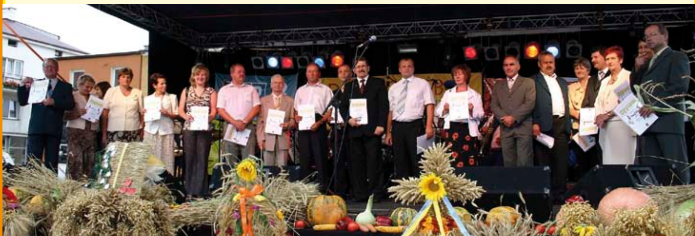
Przedstawiciele poszczególnych sołectw, które wzięły udział w konkursie na najładniejszy wieniec dożynkowy oraz laureaci konkursu „Piękna i bezpieczna zagroda”.