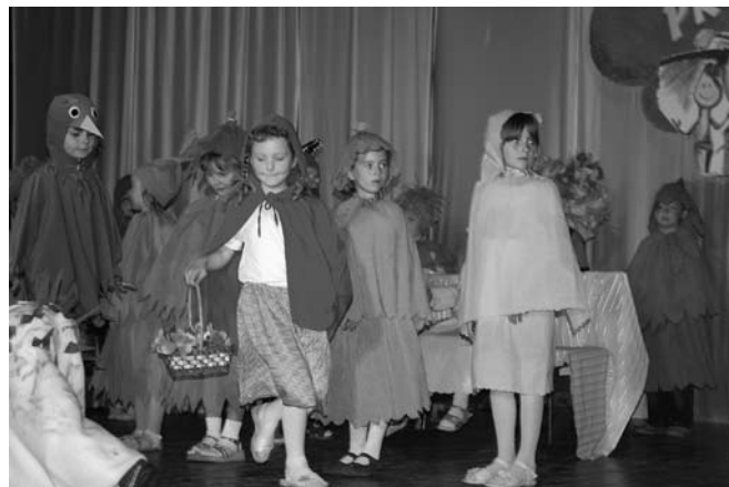
Występy dzieci podczas Przedszkoliady.