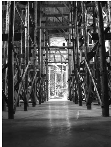
Wnętrze kościoła - stan obecny.

Ze sklepienia prezbiterium zostaną usunięte przemalowania dekoracji stiukowej. Wyeksponowany zostanie jego pierwotny, szaro - błękitny, kolor.