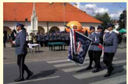
Poczet sztandarowy KPP w Staszowie.