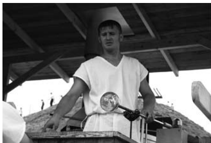
Mistrz szklarski przy pracy.

też całodniowy pokaz wytopu szkła. Jak mówili pracujący przy piecu hutnicy, wiele osób (zwłaszcza pań) chciało na pamiątkę zabrać efekty ich kunsztu.