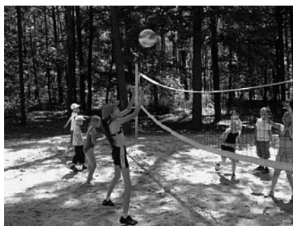
W trakcie meczu.