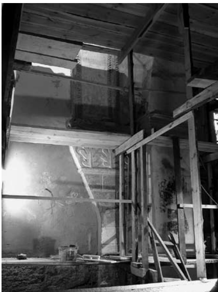
Wnętrze kościoła - widok z nad wejścia do zakrystii - stan obecny.

Prace nadal trwają. W Uroczystość Odpustową Świętego Bartłomieja - 24 sierpnia 2005r. w obecności wiernych uroczystie przeniesiono Przenajświętszy Sakrament do kościoła Ducha Św. Fara w całości została przygotowana do remontu. Wyniesiono sprzęt i ustawiono rusztowania.