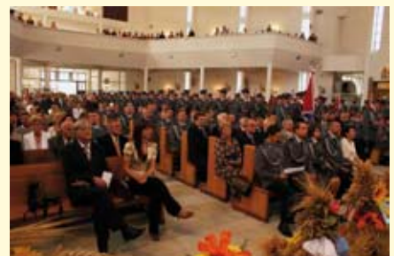
Wierni podczas mszy świętej.