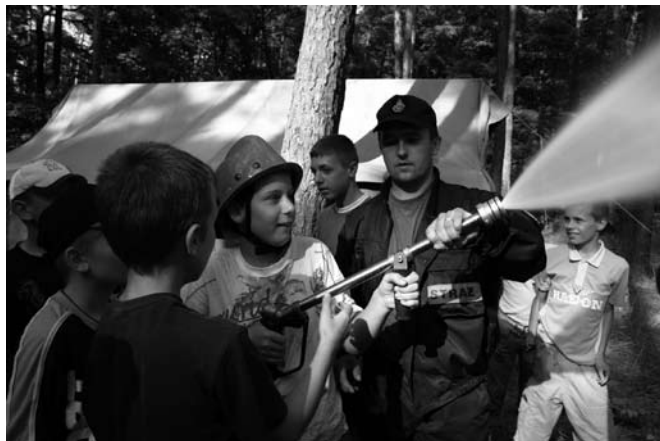
Jedną z wielu atrakcji dla dzieci była możliwość sprawdzenia się w roli strażaka.