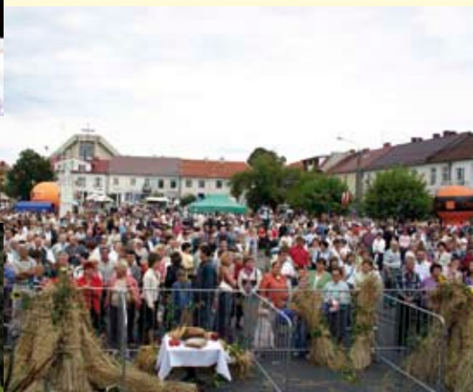
Staszowski rynek odwiedziło mnóstwo osób.