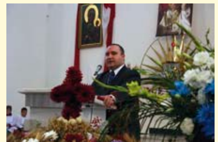
Przemawia wicepremier Rządu RP Przemysław Gosiewski.