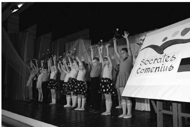
Dzieci ze staszowskiej dwójki przygotowały widowisko na zakończenie pobytu przyjaciół z Niemiec w Staszowie.