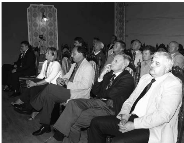
Uczestnicy narady z zainteresowaniem słuchają wykładu.