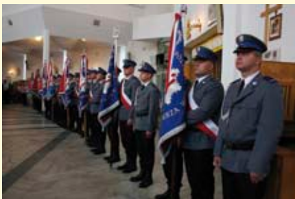
Poczty sztandarowe policji z terenu woje- wództwa świętokrzyskiego.