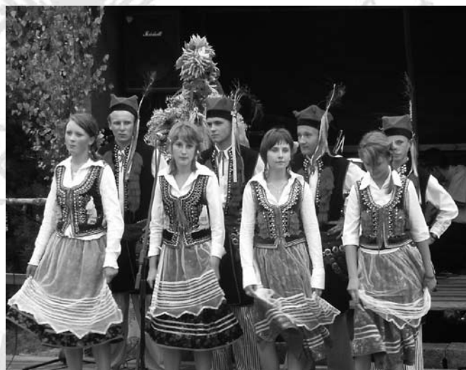
Młodzież w tradycyjnych strojach ludowych