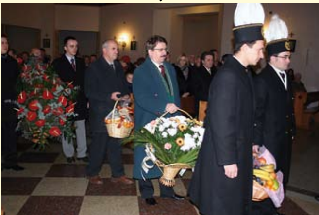
Uroczyste składanie darów