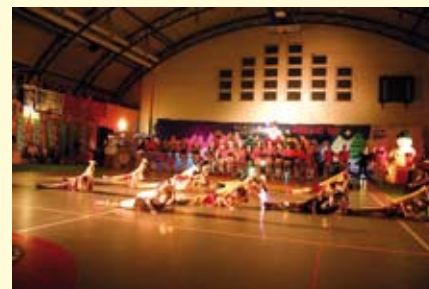
Występy dziewcząt z Zespołów Artystycznych „Kleks” oraz „Integro” Staszów