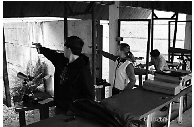
W trakcie zawodów

W dniu 18 grudnia 2007 roku odbył Oplątkowy Turniej Halowy Piłki Nożnej o puchar Burmistrza Miasta i Gminy Staszów. Miejscem rozgrywek była hala sportowa w Zespole Szkół w Czajkowie. W turnieju wzięły udział drużyny: reprezentacja kraju „Old Boy Futsal”, „Old Boy Pogoń Staszów” i „Old Boy Czajków”. Początkująca drużyna z Czajkowa zaprezentowała się bardzo dobrze w tego typu rozgrywkach.