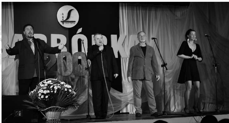
Wystąpił „Niekiepski Kabaret”