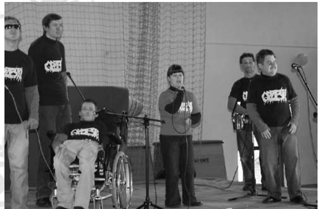
W trakcie koncertu

Właśnie dzięki takim imprezom można prezentować dorobek artystyczny osób niepełnosprawnych, podwyższać świadomość ludzi o ich dużym wkładzie w życie