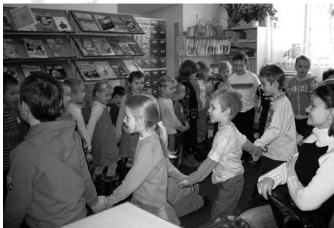
Dzieci w trakcie zabawy

W dniach 22 i 29 listopada br. w Bibliotece Publicznej w Staszowie, wzorem roku ubiegłego, obchodzono „Światowy Dzień Pluszowego Misia”. Tegoroczne spotkanie przebiegało