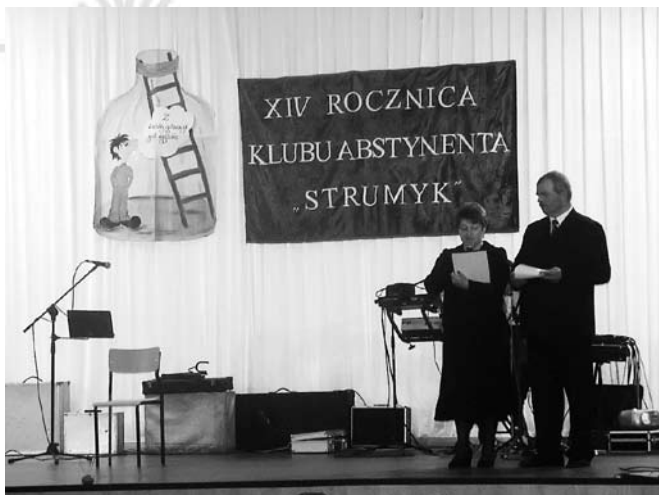
Uroczyste powitanie zaproszonych gości

Po oficjalnych powitaniach i przemowach, głos zabierali przybyli na jubileusz klubu ci wszyscy, którzy pragnęli się otworzyć,