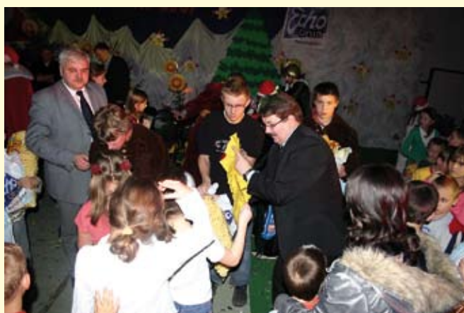
Burmistrz Staszowa i Starosta Staszowski pomagali Świętemu Mikołajowi we wręczaniu prezentów dzieciom