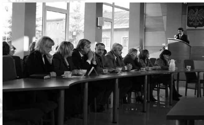
Burmistrz Miasta i Gminy Staszów Andrzej Iskra powitał uczestników spotkania