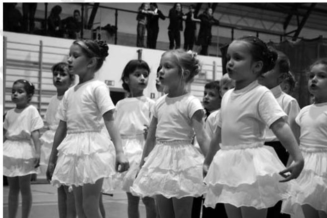
Przedшкоlaki w trakcie jednego z występów