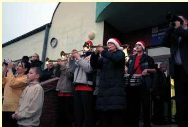
Fanfary na cześć Świętego Mikołaja