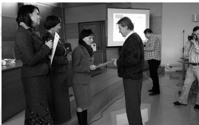
Uroczyste wręczenie dyplomów