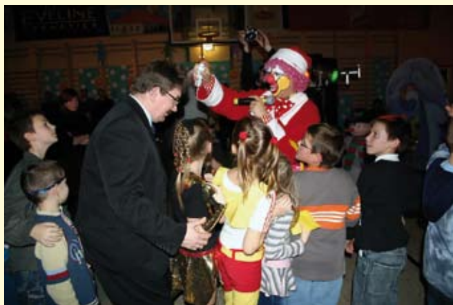
Malowanie włosów to jedna z atrakcji, w której chętnie brały udział nie tylko dzieci