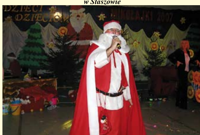
Ostatnim prezentem Świętego Mikołaja była piosenka