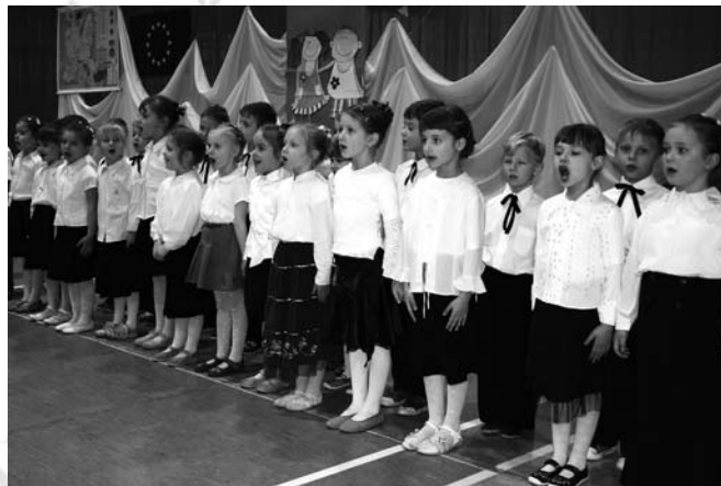
Hymn Narodowy śpiewają przedszkolaki

Część artystyczna wieczoru przygotowana przez nauczycieli Przedszkola Nr 8 rozpoczęła się Hymnem Przedszkola, a następnie Polonezem. Dzieci zaprezentowały również kilka innych tańców oraz wierszy związanych z Polską. Swój udział w imprezie mieli także byli wychowankowie placówki przedstawiając talenty wokalne i