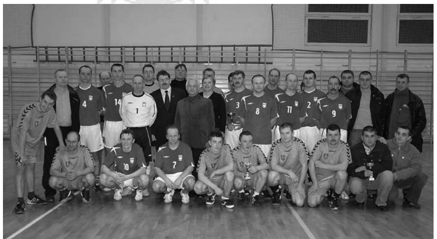
Uczetnicy turnieju.