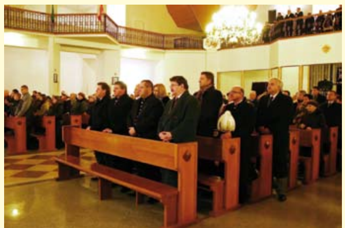
Wierni w trakcie nabożeństwa