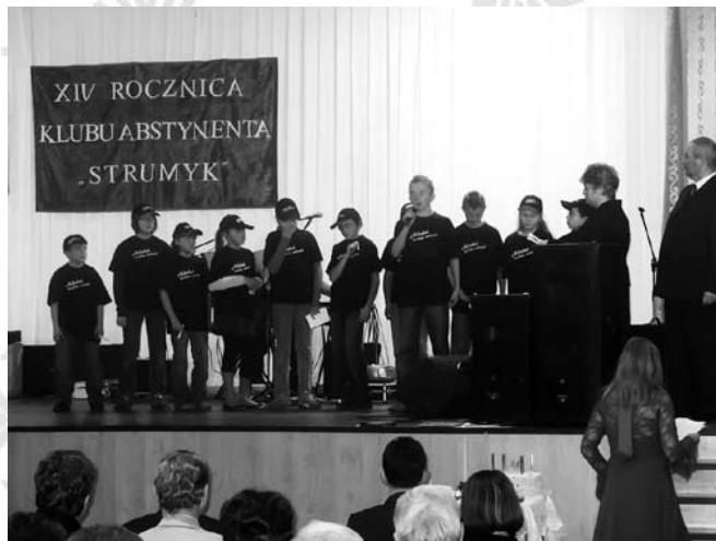
W trakcie spektaklu

Jak co roku w klimat spotkania wprowadził nas program profilaktyczny, tym razem przygotowany w ramach realizacji zadania publicznego dotyczącego kampanii edukacyjnej na temat zapobiegania i rozwiązywania problemów alkoholowych. Na samym początku wysłuchaliśmy wykładu pt. „Alkohol kradnie wolność” - gdzie głównie mowa była o profilaktyce pierwszo