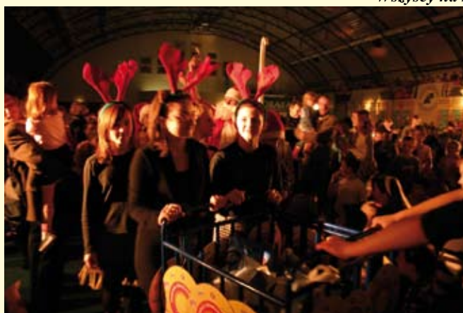
Zaprzęg Świętego Mikołaja