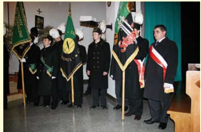
Górnice poczty sztandarowe