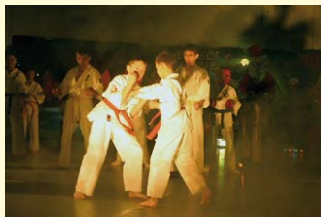
Pokaz karate w wykonaniu najmłodszych zawodników