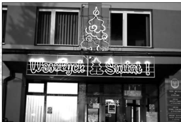
Współczesnym obyczajem jest przystrajanie elewacji budynków świątecznymi motywami. Na zdjęciu budynek Urzędu Miasta i Gminy w Staszowie.