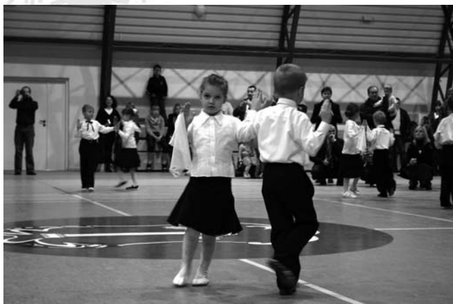
Tradycyjnego Poloneza wykonały dzieci z Przedszkola Nr 8

Dyrekcja, pracownicy i wychowankowie Przedszkola Nr 8 w Staszowie im.