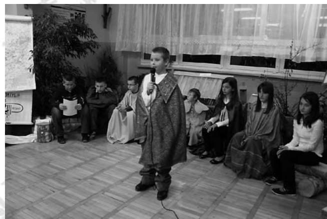
Występ dzieci z Zespołu Szkół Nr 1