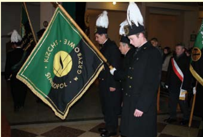
Poczet sztandarowy górników KiZChS „Siarkopol” S.A. w Grzybowie