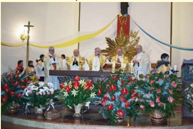
Księża celebrujący mszę świętą