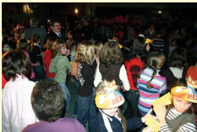
Wszyscy na sali ruszyli w tany