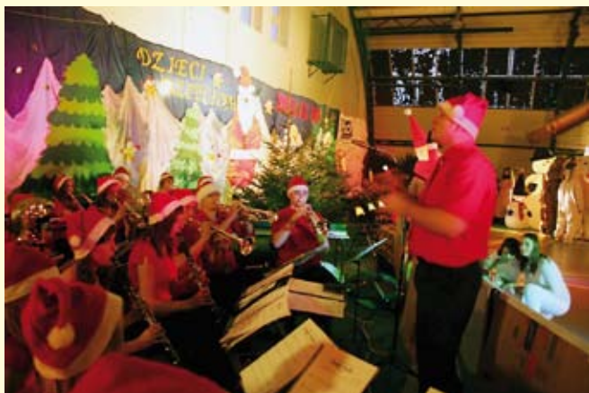
Młodzieżowa Orkiestra Hutnicza Tadeusza Wrześniaka