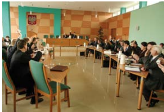
Radni Rady Miejskiej podczas głosowania nad budżetem gminy na 2008 rok

f) dokonania zmian w Uchwale nr III/6/06 Rady Miejskiej w Staszowie z dnia 07 grudnia 2006 roku w sprawie wyboru przewodniczących Komisji Rady Miejskiej – projekt nr 185/07.