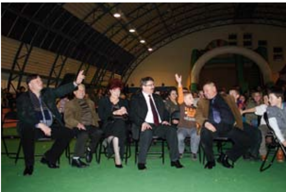
W trakcie licytacji

O godz. 14.00 wspólnie z wielką orkiestrą w duecie zagrała orkiestra dęta