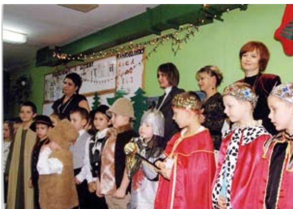
Dzieci biorące udział w Jasełkach