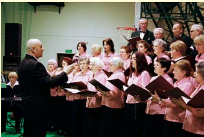
Kolędy śpiewa Chór Nauczycielski