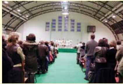
Wierni podczas mszy świętej