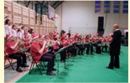
Młodzieżowa Hutnicza Orkiestra Dęta w trakcie występu

„Kolędy nie tylko należą do naszej historii kolędy, lecz poniekąd tworzą naszą historię narodową i chrześcijańską”