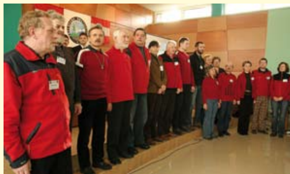
Uroczyste ślubowanie nowych przewodników świętokrzyskich