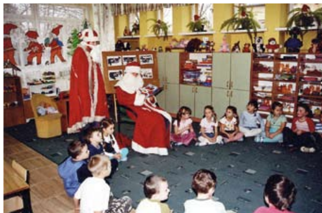
Święty Mikołaj czyta dzieciom bajki