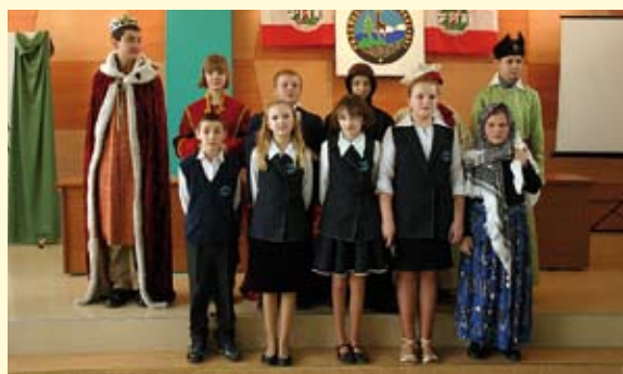
Młodzi aktorzy z Zespołu Placówek Oświatowych PSP Nr 1 im. T. Kościuszki w Staszowie