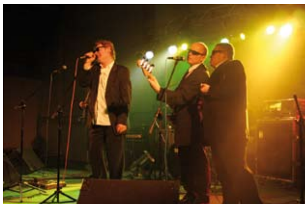
Gwiazda wieczoru - koncert zespołu OBSTAWA PREZYDENTA

ZOZ, Dział Pomocy Doraźnej – 1997r. (deska ortopedyczna - 2szt, unieruchomienie głowy - 2 szt., nosze - 1 szt., unieruchomienie pediatriczne - 2 szt., laryngoskop z kompletem łyżek typ. McIntosh wraz z uchwytem typ AN