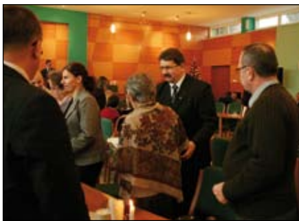
Tradycyjnie składano sobie życzenia przy łamaniu się opłatkiem