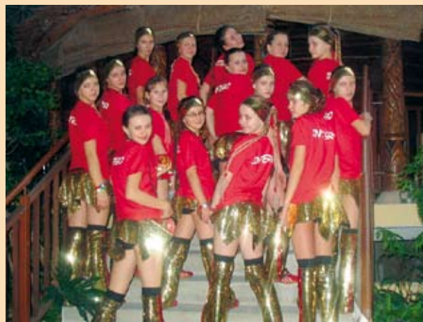
Zawodniczki „Integro” Staszów

Mamy nadzieję, że w przyszłości również, będziemy mogli liczyć na Państwa pomoc, bo czyż tego typu działalność nie jest najlepszą wizytówką i reklamą naszego miasta w kraju i za granicą?