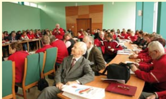
Uczestnicy XI Zjazdu Przewodników Świętokrzyskich