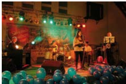
Koncert zespołu CARAVANA

dla niemowląt Soehnle, typ 7726-2 szt., Inhalator, typ Pari Junior Boy, ssak elektryczny z wyposażeniem, typ Mevacs 20); 2004r. (glukometr z wyposażeniem, typ SmartScan).