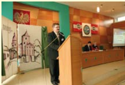
Burmistrz Miasta i Gminy powitał uczestników zjazdu