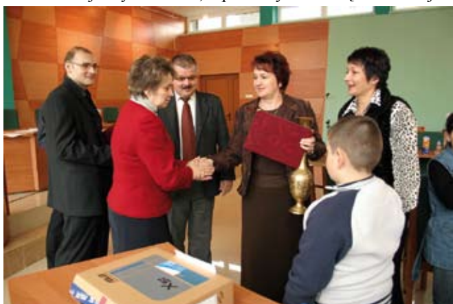
Uroczyste wręczenie nagród

W kategorii szkół, które zebrały największe ilości: I miejsce zajął ZPO - PSP i Przedszkole w Kurozwałkach – Szkoła Filialna w Woli Osowej z imponującym wynikiem 126,73 pkt. Dwa równorzędne II miejsca w konkursie zajęły: PSP im. Papieża Jana Pawła II w Czajkowie, która zdobyła 88,60 pkt, ZPO - PSP i Przedszkole w Wiśniowej z wynikiem 50,76 pkt. Trzy równorzędne III miejsca