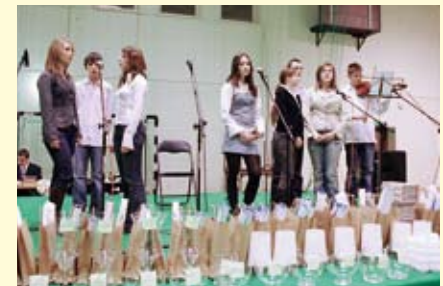
Młodzi artyści zachwycali talentem, śpiewając kolędy i pastorałki