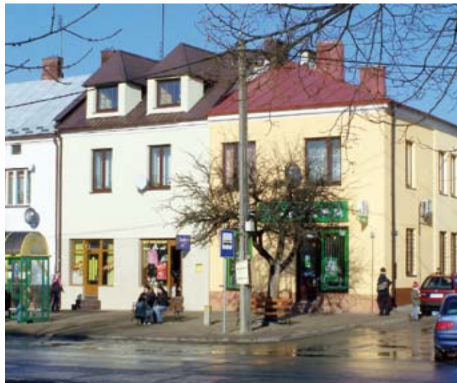
Dom, w którym zatrzymał się Marian Langiewicz

15 lutego na Rynku odbył się przegląd wojsk. Przed Langiewiczem i członkami Rządu Narodowego przeddefilował