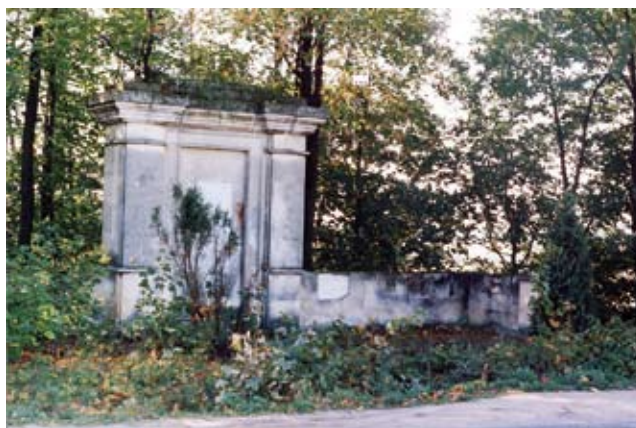
Pomnik upamiętniający działania wojenne w okolicach Mokrego

W Afryce na terenie Libii w Tobruku znajduje się Polski cmentarz oraz pomnik poświęcony walczącym i poległym Polakom armii II-go Korpusu Polskiego generała Władysława Andersa. Walczyli oni z niemieckim „Afrikakorps” dowodzonym przez Feldmarszałka Erwina Rommla zwanego „Lisem Pustyni”. Kilka razy odwiedzałem cmentarz Polaków w Tobruku, był zawsze zadbane i czyste, a dbają o to