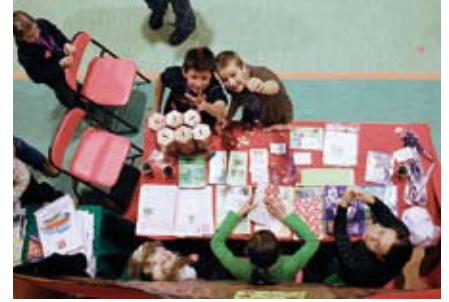
Stoisko „Młodych odkrywców”

Podczas koncertu prowadzący akcentował, że zebrane pieniądze, które są wysyłane na konto fundacji wracają do Staszowa i regionu w postaci sprzętu, który ratuje zdrowie i życie wielu maluszków. Sprzęt trafia nie tylko do staszowskiego szpitala, lecz również do placówek zdrowotnych w województwie i całym kraju. Nie wiadomo, gdzie nasz maluch może potrzebować pomocy. Należy pamiętać, że nawet wiedza