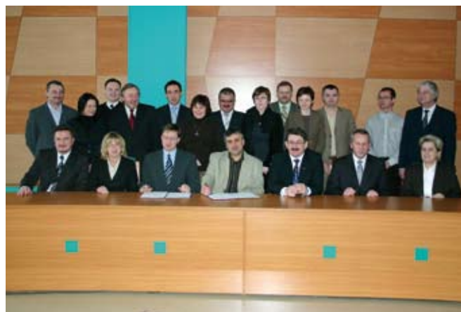
Pamiątkowe zdjęcie z uroczystego podpisania kontraktu