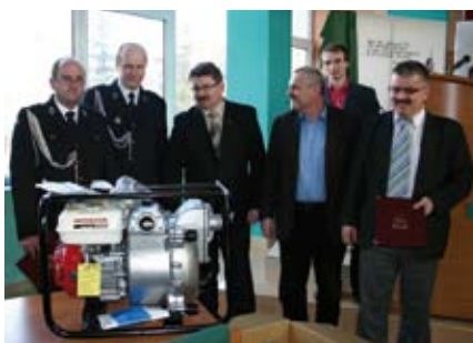
I miejsce zajęła OSP w Krzczonowicach

Na pozostałych miejscach uplasowały się jednostki.: OSP Czajków z 3 070 pkt, OSP Niemścice 3 915 pkt, OSP Czernica 2 820 pkt, OSP Kurozweki 2 820 pkt, OSP