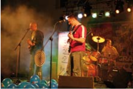
Koncert PERPETUM HOMO

13 stycznia w całej Polsce już po raz 16. rozbrzmiały dźwięki największej orkiestry na świecie – Wielkiej Orkiestry Świątecznej Pomocy. Od wczesnych godzin porannych dźwięki te słyszalne były, a nawet widzialne przez cały dzień w Staszowie. W całej Polska akcja odbywała się pod hasłem: „Gramy z głową”.