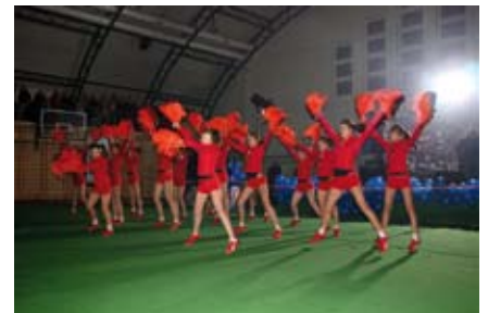
Występ dziewcząt z INTEGRO Staszów

– 2004r. (tympanometr, typ AT235); 2006r. (audiometr z audiometrią mowy, typ AD229e).