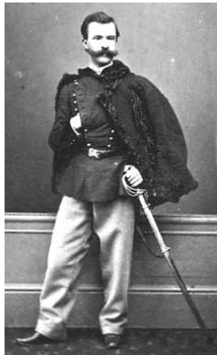
Marian Langiewicz fotografia z 1863 ze zbiorów Biblioteki Narodowej

źródło: http://pl.wikipedia.org/wiki/Marian_Langiewicz