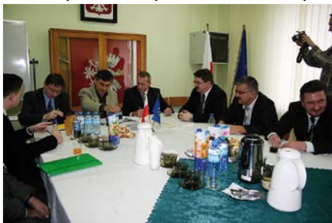
Podczas podpisywania umowy