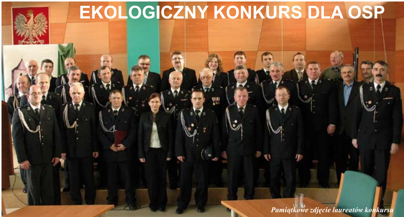
Pamiątkowe zdjęcie laureatów konkursu

W dniu 25 stycznia 2008 roku na sali konferencyjnej Urzędu Miasta i Gminy odbyło się uroczyste wręczenie nagród strażakom OSP z terenu Gminy Staszów za udział w Konkursie Zbiórki Surowców Wtórnych w minionym roku.