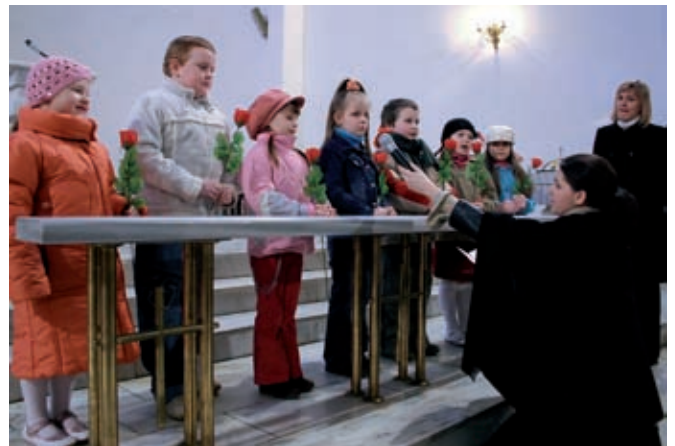
Maluchy z Przedszkola nr 3 im. Papieża Jana Pawła II w Staszowie w trakcie występu