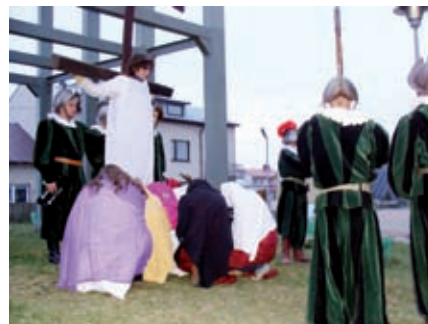
Fotorelacja z X Misterium Drogi Krzyżowej