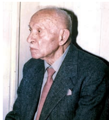
Adam Bień (14 grudnia 1899 r. - 4 marca 1998 r.)