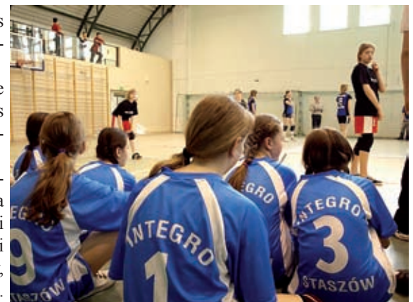
Drużyna Integro Staszów

Integracyjny Uczniowski Klub Sportowy „Integro” Staszów, Ośrodek Sportu i Rekreacji w Staszowie.