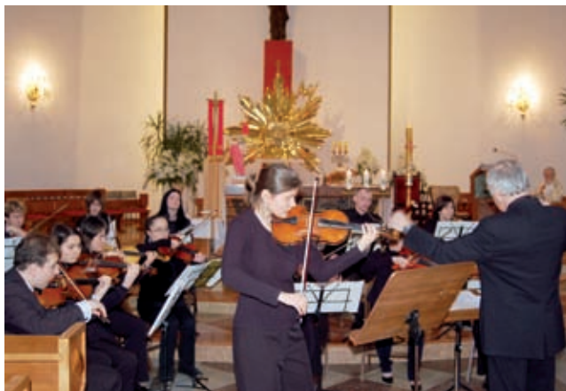
Koncert w kościele św. Barbary

W przedostatnią niedzielę kwietnia w inicjatywy Staszowskiego Ośrodka Kultury przy współorganizacji parafii pw. św. Barbary w Staszowie w kościele na os. Wschód odbył się koncert smyczkowej grupy kameralnej Camerata Scholarum.