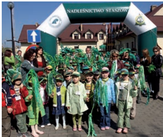
Przedszkolaki przed budynkiem Nadleśnictwa w Staszowie

Następnym etapem zajęć o lesie były „malowanki”. Tutaj przedszkolaki mogły popisać się swoimi zdolnościami plastycz-