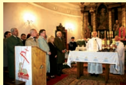
Msza św. za Ojczyznę w kościele w Wiśniowej