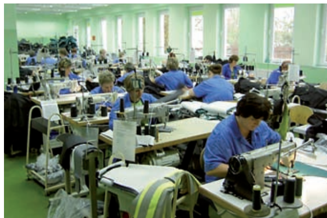
Hala produkcyjna PPHU „Subor”