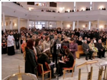
Młodzież z Zespołu Szkół Ekonomicznych im. Jana Pawła II w Staszowie