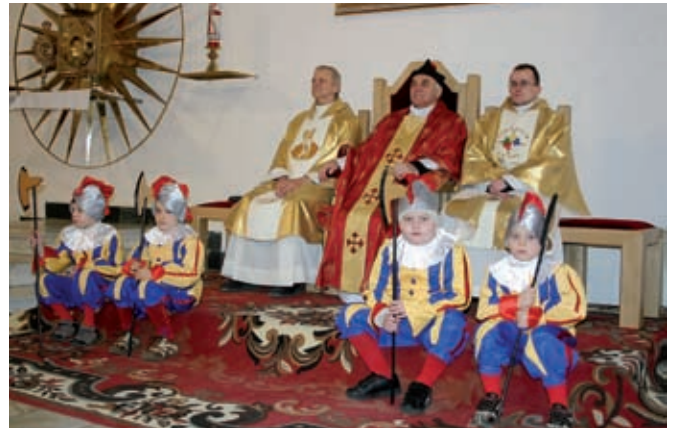
Księża celebransi w asyście „gwardii szwajcarskiej” z Przedszkola nr 3 im. Papieża Jana Pawła II w Staszowie