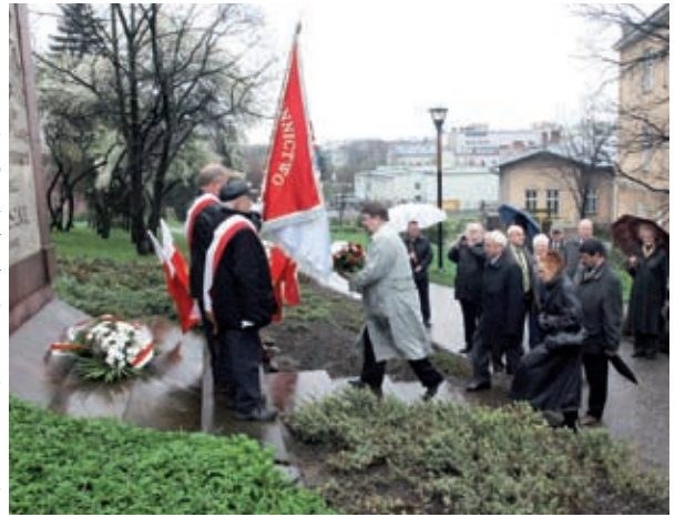
Burmistrz Miasta i Gminy składa kwiaty pod płytą Tadeusza Kościuszki w Kielcach

z najstarszych ugrupowań istniejących w polskich formacjach politycznych, ponieważ sięga jeszcze czasów II Rzeczypospolitej. W czasie Polski Rzeczypospolitej Ludowej z Polską Zjednoczoną Partią Robotniczą i Zjednoczonym Stronnictwem Ludowym brała udział w rządzeniu krajem. Po 1989 roku partia utraciła swą aktywność polityczną. Obecnie podjęto działania mające na celu budowę nowego wizerunku i oblicza partii m.in. poprzez rozbudowę jej szeregów.