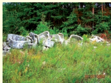
Staszów ul. Wrzosowa