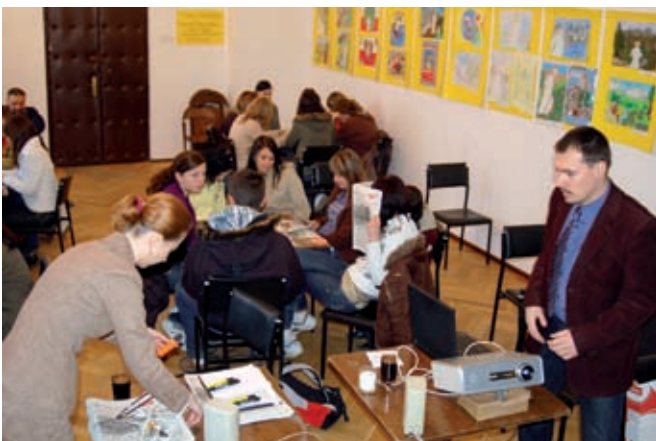
W trakcie zajęć

W dniu 4 kwietnia 2008 roku w Sali Kameralnej Staszowskiego Ośrodka Kultury odbyły się warsztaty poświęcone wydarzeniom marca 1968 roku.