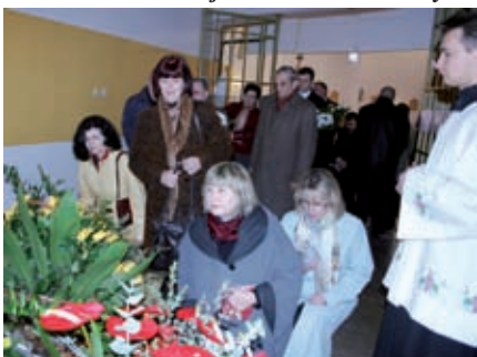
Delegacje zakładów pracy składają kwiaty w kaplicy Jana Pawła II