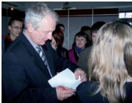
Posel na Sejm RP Konstanty Miodowicz daje autografy staszowskiej młodzieży

9 kwietnia bieżącego roku grupa młodzieży z Publicznego Gimnazjum nr 2 w Staszowie zwiedzała budynek Sejmu RP mieszczący się przy ulicy Wiejskiej w Warszawie.