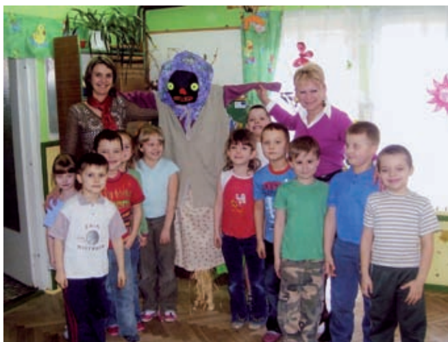
Przedszkolaki z opiekunkami

Gdy Marzanna była gotowa, dzieci rozpoczęły przygotowania do stroików wiosennych. Następnie wspólnie z nauczycielkami wyruszyli nad rzekę