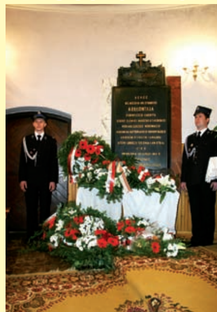
Tablica w kościele w Wiśniowej, za którą spoczywa serce ks. Hugo Kołłątaja jednego z twórców Konstytucji 3 Maja