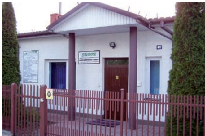
Główne wejście do firmy PPHU „Subor”