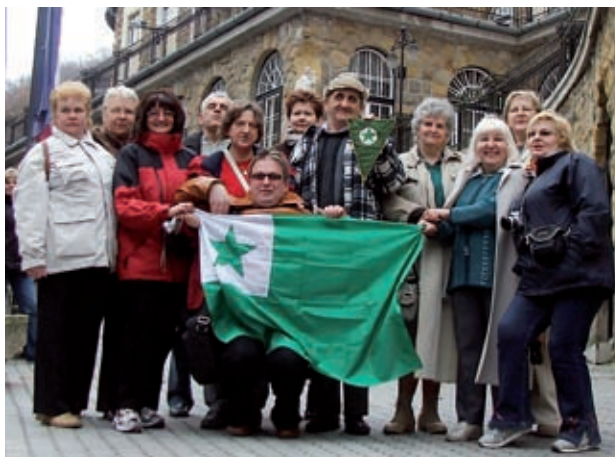
Grupa w Lillafured

Zwiedziliśmy też prawosławny kościół Świętej Trójcy, posiadający największy ikonostas Europy Środkowej – wysoki na 16 m. i skupiający 88 scen z życia Jezusa. Późnoba-