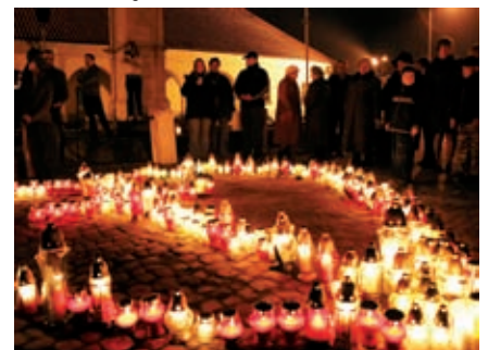
Jak co roku staszowianie ustawili serce ze zniczy na rynku