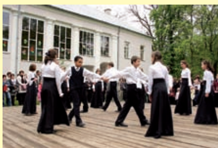
Polonez w wykonaniu młodzieży ze szkoły w Wiśniowej

Radni Rady Miejskiej w Staszowie i Burmistrz Miasta i Gminy Staszów składają serdeczne podziękowania dyrekcji, gronu pedagogicznemu oraz uczniom szkoły w Wiśniowej za przygotowanie występów artystycznych, które uświetniły obchody 217. rocznicy uchwalenia Konstytucji 3 Maja