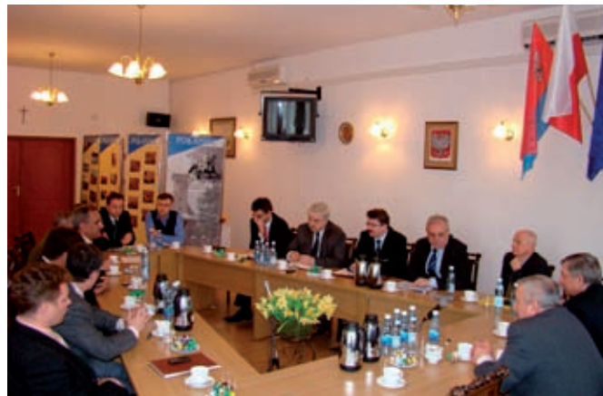
W trakcie spotkania dotyczącego budowy mostu na Wiśle

„Pomimo obciążenia środków z programu Polska Wschodnia, województwo świętokrzyskie jest gotowe ponieść na koszt własny realizację inwestycji. Jesteśmy gotowi do ogłoszenia przetargu z chwilą sygnału ze strony województwa podkarpackiego. Im szybciej rozpoczniemy inwestycje tym lepiej, ze względu na rosnące koszty i spadający kurs euro” -