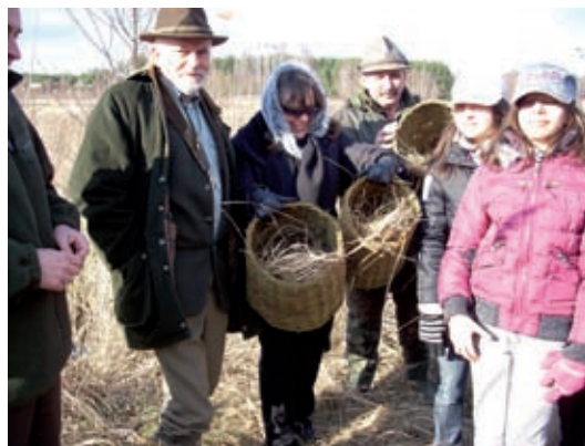
Przygotowanie koszy lęgowych

wikliny, według określonych zasad. Otwór wlotowy był nieco mniejszy od wnętrza, co ma zapewnić kaczkom poczucie bezpieczeństwa, a także uczynić ptaka siedzącego w gnieździe mniej widocznym z powietrza.