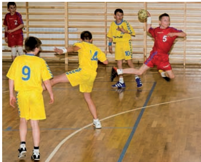
W trakcie gry