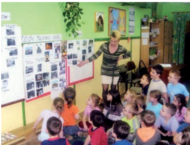
Lekcja z patriotyzmu dla przedszkolaków

Dziecko z domu rodzinnego wnosi pewną wrażliwość, umiejętność zachowania się wśród ludzi. Rodzina wiąże dziecko uczuciowo z całym kręgiem