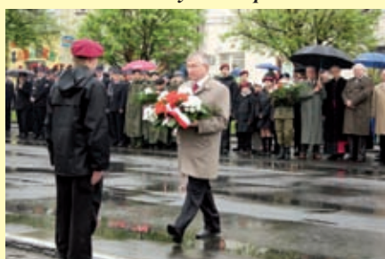
Posel na Sejm RP Krzysztof Lipiec (PiS)