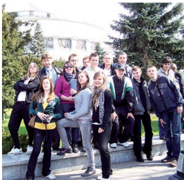
Przed gmachem Sejmu RP