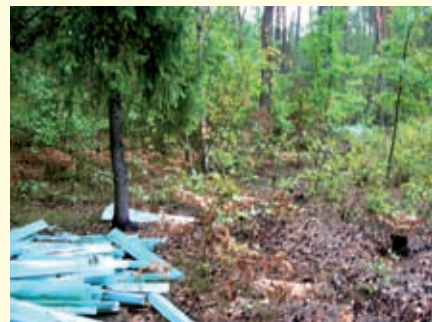
Staszów ul. Kościuszki