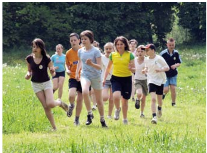
Na trasie biegu