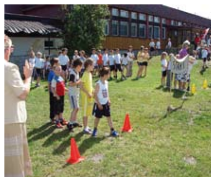
Dzieci w trakcie jednej z konkurencji sportowej