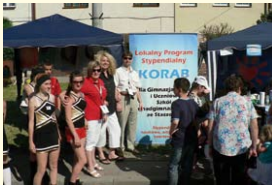
Stoisko, przy którym zbierano pieniądze na stypendia

- Informacja o programie będziemy zamieszczać w placówkach szkolnych bezpośrednio nim zainteresowanych, na stronie internetowej Urzędu Miasta i Gminy, w formie anonsu w prasie lokalnej oraz na stronie internetowej Fundacji. Wnioski przyjmowane będą w sekretariatach szkół do 15 września. Wówczas zbierze się komisja, w skład której wejdą przedstawiciele samorządów lokalnych, najhojniejsi darczyńcy, przedstawiciel rodziców, mediów lokalnych i Fundacji Vive Serce Dzieciom. O wynikach obrad każdy uczeń dowie się listownie niezwłocznie po zakończeniu obrad komisji. Osoby zaakceptowane przez komisję podpiszą umowy