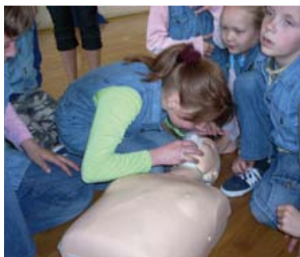
Uczniowie nabywali praktyczne umiejętności w ratowaniu zdrowia i życia ludzkiego

Dzień czwarty – „W zdrowym ciele zdrowy duch”.