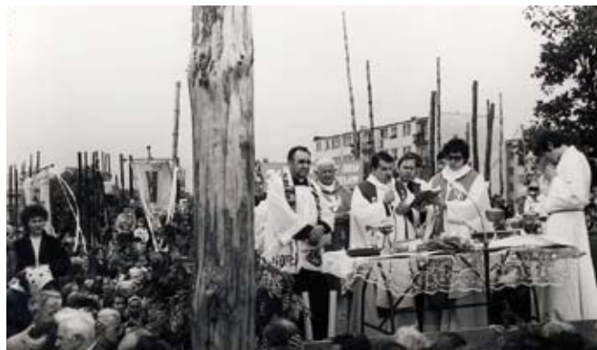
Plac budowy kościoła p.w. Ducha Świętego w Staszowie rok 1986.

Msza św. koncelebrowana podczas misji w parafii od lewej: