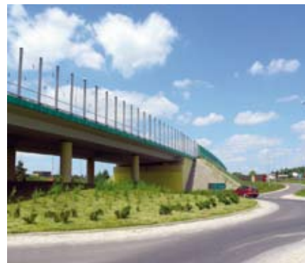
Na przedstawionej fotografii widać przykład nowoczesnego zastosowania ponad 200 tys. ton mieszanki popiołowo-żużlowej z elektrowni Polaniec wbudowanej w obwodnicy Głogowa Małopolskiego

- kruszywo ulega zagęszczeniu już po wysypaniu z samochodu, mogą po nim wjeżdżać kolejne dostawy, nie jest wymagany transport wewnętrzny lub przesuwanie wcześniej dowiezionego kruszywa, co znacznie