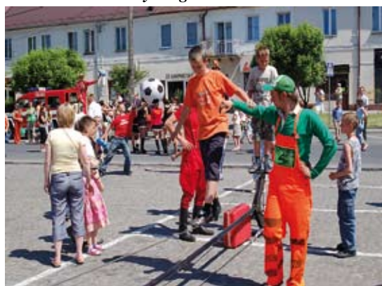
Odważni mogli spróbować swoich sił w balansowaniu na linie