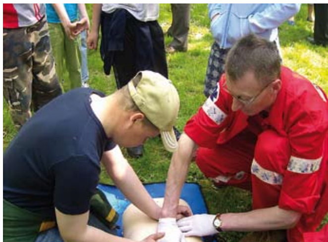
Pierwsza pomoc - jedna z akcji pokazowych