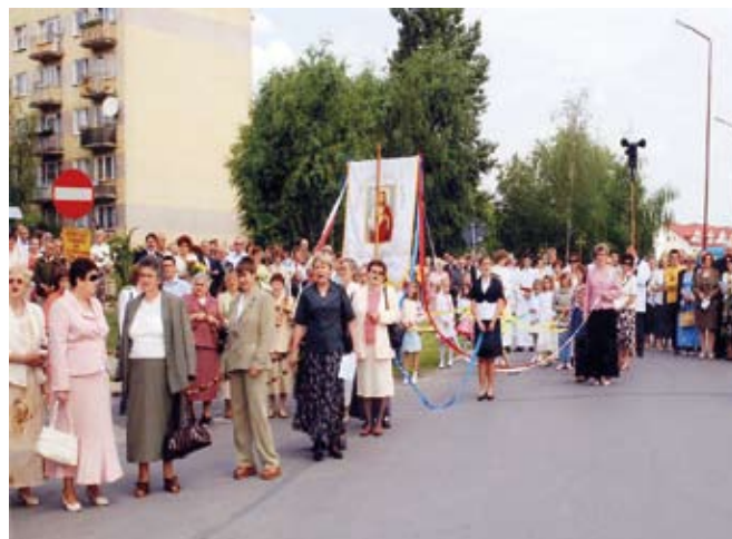
W procesji udział wzięli mieszkańcy miasta

Jan Paweł II ukazał św. Joannę współczesnemu światu jako „nowoczesną świętą”.