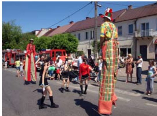
Wspólna zabawa ze szczudlarzami