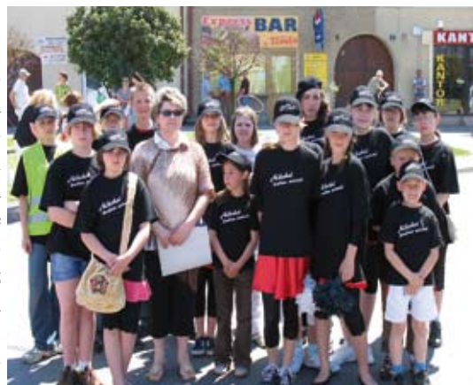
Dzieci ze świetlicy środowiskowej w Kurozwałkach w Dniu Dziecka na staszowskim rynku

P.S. Jak powiedziała do opiekunki dzieci jedna z młodych uczestniczek na początku festynu - „Proszę pani, ja to się dzisiaj bawię na całego”. Zapytana na koniec potwierdziła że tak właśnie się bawiła wraz z innymi dziećmi - i oto chodziło organizatorom.