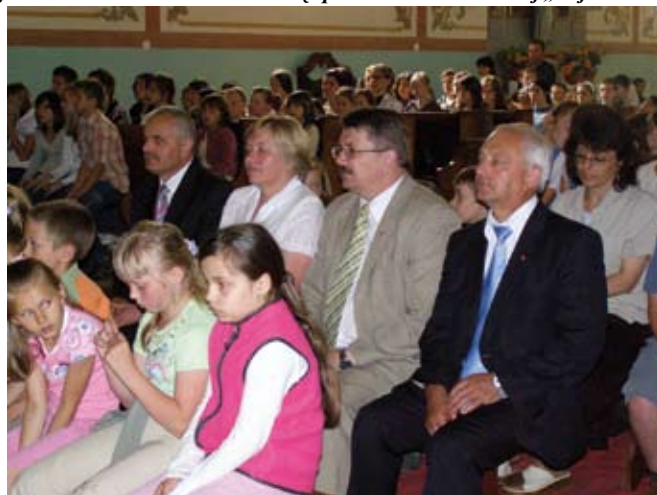
Uroczysta Msza św. na zakończenie roku szkolnego w Czajkowie