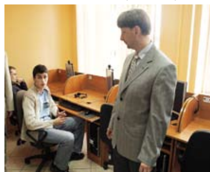
Młodzi mieszkańcy Dobrej dzielą się uwagami na temat wyposażenia komputerowego Centrum Kształcenia