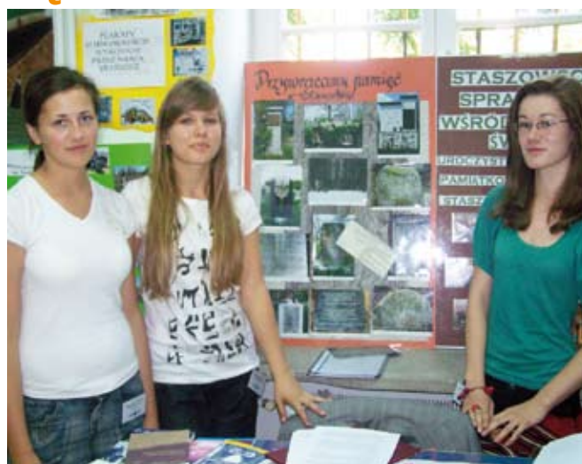
Wystawa staszowskich gimnazjalistów