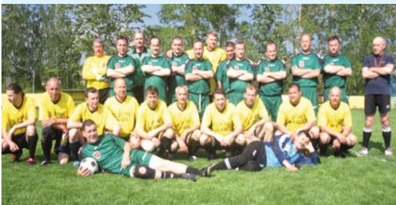
Wspólne zdjęcie OLD BOY Pogon Staszów i OLD BOY Star Starachowice

20 maja o godzinie 16.00 na stadionie miejskim w Staszowie rozegrany został mecz dwóch zaprzyjaźnionych ze sobą drużyn OLD BOY Pogon Staszów i OLD BOY Star Starachowice.