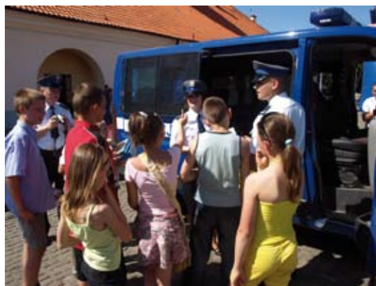
Staszowscy policjanci prowadzili liczne konkursy, gry i zabawy z nagrodami dla dzieci