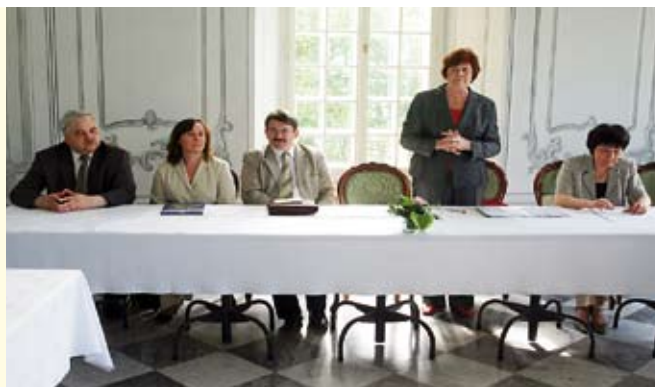
W trakcie narady zaproszeni goście

5 czerwca poruszono tematykę związaną z: Europejskim Kodeksem Walki z Rakiem – współpracą Świętokrzyskiego Centrum Onkologii i Wojewódzkiej Stacji Sanitarno – Epidemiologicznych w Kielcach, Festiwalem Zdrowia w Busku Zdroju, konkursem na prezentację multimedialną „Gimnazjali-