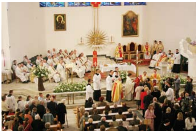
Kościół Ducha Św. podczas nabożeństwa