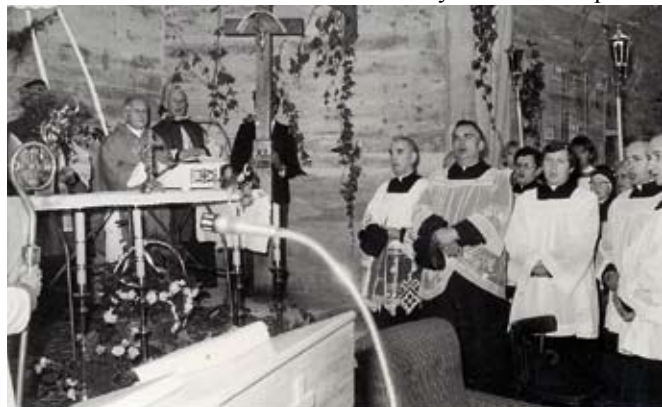
Uroczystości poświęcenia małego krzyża w kościele dolnym rok 1983