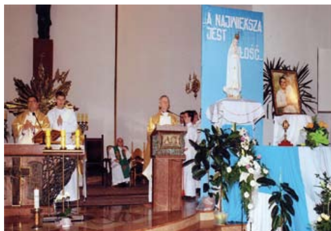
Uroczysta Msza święta

Na zakończenie Mszy świętej, uroczystym aktem zostały zawierzone opiece św. Joanny rodziny miasta, gminy i powiatu.