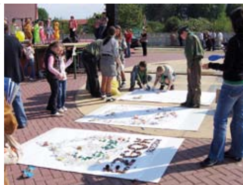
Powiatowy Piknik Ekologiczny w Połańcu

Opracowano na podstawie materiałów z EZGOK www.ezgok.staszow.com Ewa Mazanka