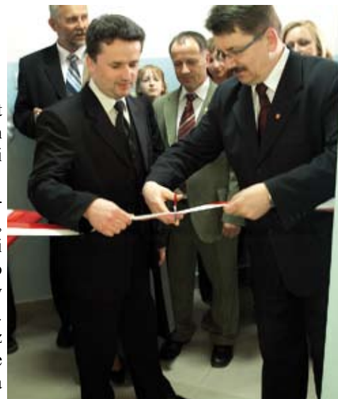
Uroczyste otwarcie świetlicy „wioski internetowej” w Dobrej

H. Rogozińska, E. Mazanka, fot. Ł. Milewicz