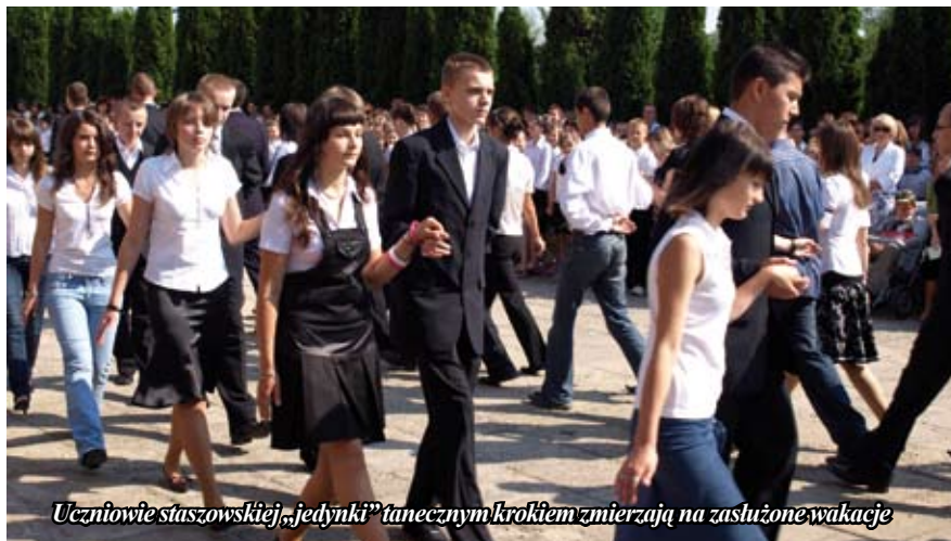
Uczniowie staszowskiej „jedyńki” tanecznym krokiem zmierzają na zasłużone wakacje