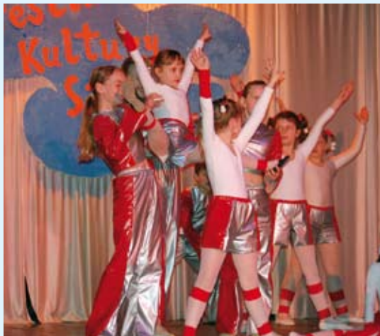
Dzieci prezentowały swoje umiejętności