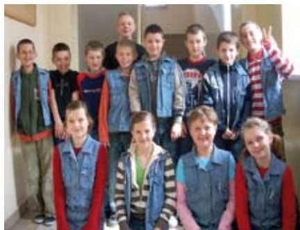
Uczestnicy „Szkolnego Tygodnia Profilaktycznego”

Dzień trzeci – „Uzależnienia utopia młodych”