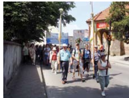
Uczestnicy 188. Pieszej Pielgrzymki do Sulisławic