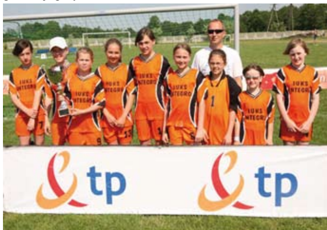
Zwycięska drużyna z trenerem