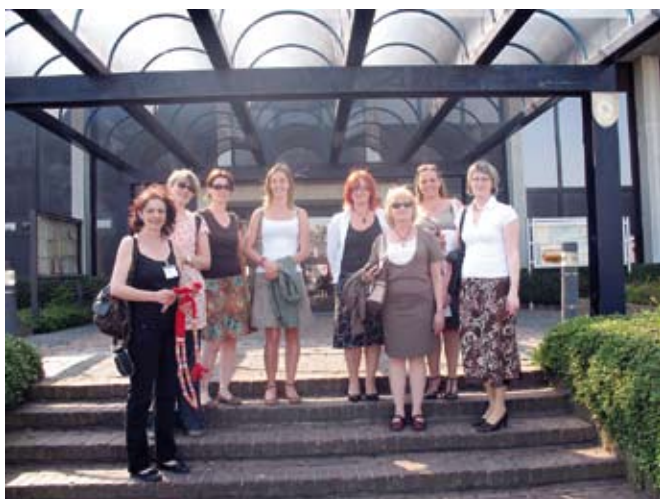
Nasi partnerzy z placówek zagranicznych