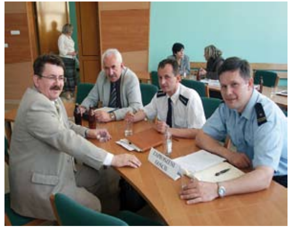
Przerwa w obradach to chwila kiedy burmistrz może porozmawiać z zaproszonymi gośćmi

h) zatwierdzono roczne sprawozdanie finansowe za 2007 r. Biblioteki Publicznej Miasta i Gminy Staszów.