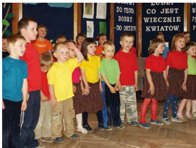
Dzieci podczas występu artystycznego