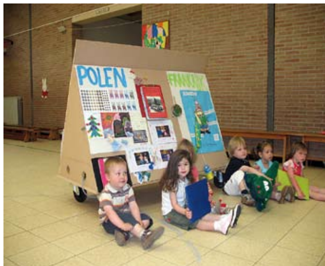
Dzieci w przedszkolu belgijskim słuchają o naszym kraju

W dniach od 6 do 10 maja 2008 roku uczestniczyłam w spotkaniu w ramach projektu w Belgii. Na spotkanie przybyły również nauczycielki z Francji. Wizyta w Belgii to ciężka, codzienna praca nad projektem, ale też zwiedzanie szkół, przedszkoli, obserwacja codziennej pracy w goszczących nas placówkach. W pierwszym dniu pobytu w Geel odwiedziliśmy naszą partnerską szkołę- Vrije basisschool Sint- Dimpna. Jest to szkoła prywatna, katolicka. Mieści się w piętrowym, obszernym budynku. Na parterze