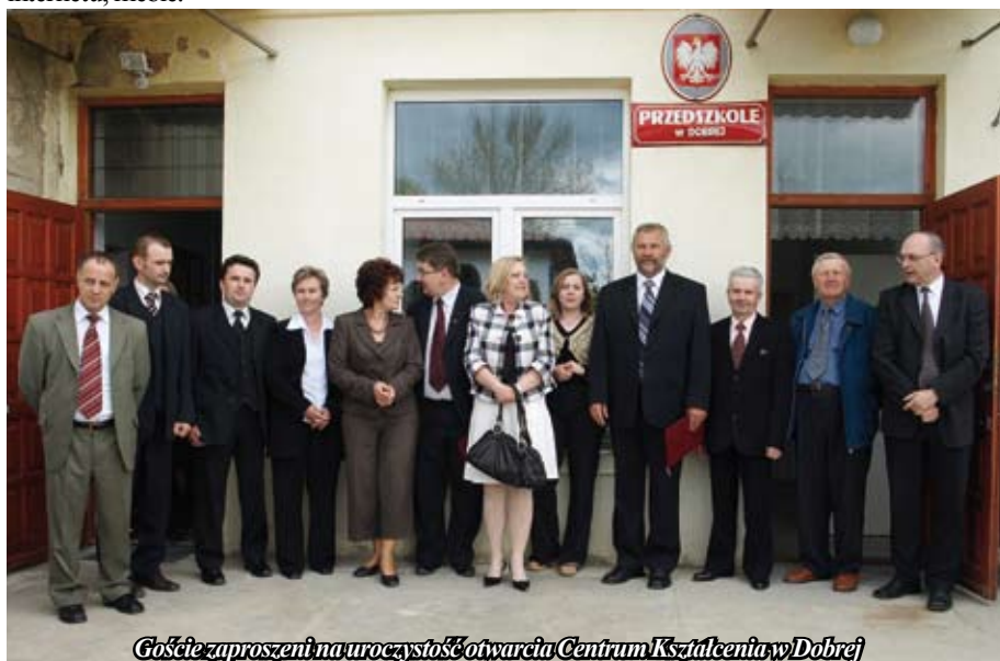
Goście zaproszeni na uroczystość otwarcia Centrum Kształcenia w Dobrej