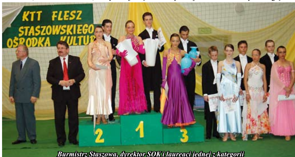
Burmistrz Staszowa, dyrektor SOK i laureaci jednej z kategorii