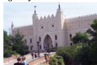
Na trasie wycieczki znalazł się lubelski zamek

perci którzy oglądali nasze prace wysoko je oceniali. Ponadto zainteresowali się nami przedstawiciele lokalnych mediów, dla których udzieliliśmy kilku wywiadów. Staram się angażować moich uczniów do wszystkich akcji i konkursów, które pozwalają im poszukiwać wiedzy poza szkolnymi podręcznikami. Dzięki temu często uczą się historii poprzez wyjazdy do miejsc związanych z przeszłością naszego