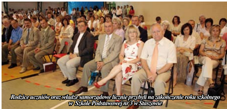
Rodzice uczniów oraz władze samorządowe licznie przybyli na zakończenie roku szkolnego w Szkole Podstawowej nr 3 w Staszowie