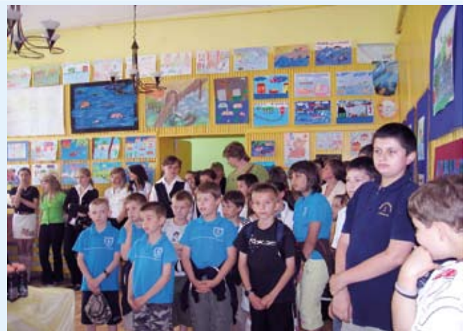
Uczestnicy konkursu plastycznego

Po wręczeniu dyplomów i nagród wszystkim uczestnikom konkursu odbył się wernisaż zgłoszonych prac, a te szcze-