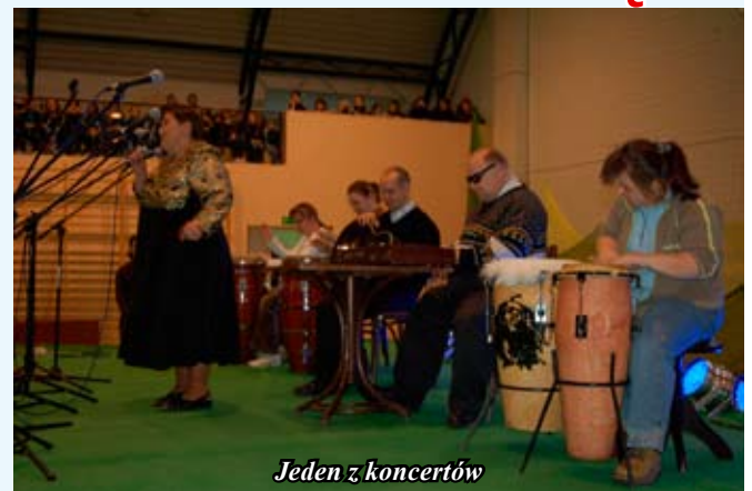
Jeden z koncertów

Patronat nad festiwalem objęli: Burmistrz Miasta i Gminy Staszów oraz Starosta Staszowski. Patronat medialny objęli: Echo Dnia, Pismo Samorządowe Monitor Staszowski, opiekę medialną sprawowała