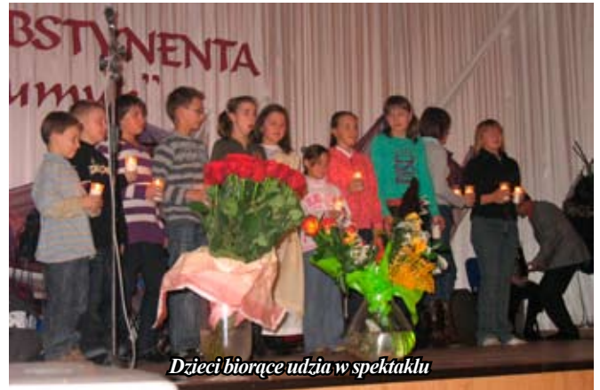
Dzieci biorące udział w spektaklu