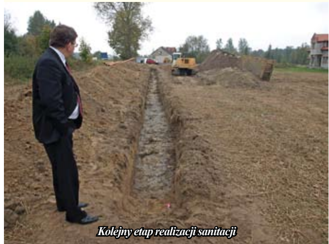
Kolejny etap realizacji sanitacji

Informacja o realizacji Projektu „Sanitacja Rzeki Czarnej Staszowskiej” – wykonanie kanalizacji sanitarnej dla gmin: Połaniec, Staszów i Rytwiany CC12005/PL/16/C/PE/014.