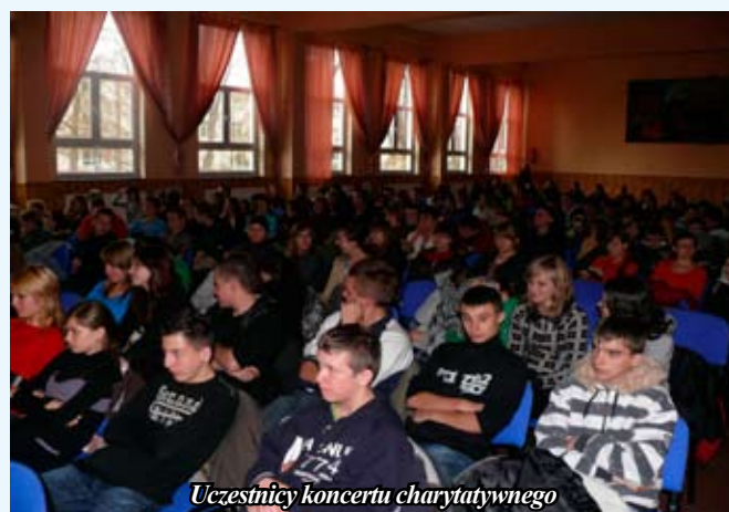
Uczestnicy koncertu charytatywnego

Koncerty w Staszowie współorganizowane były przez Urząd