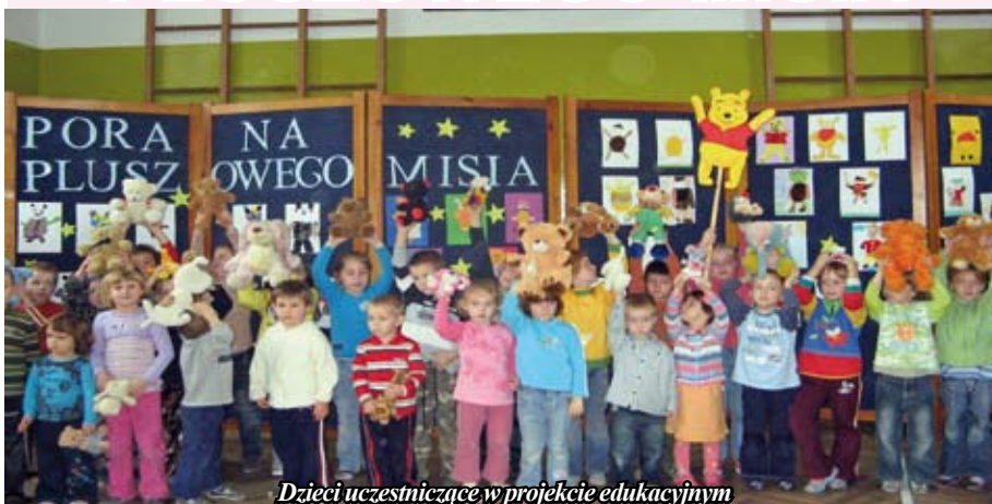
Dzieci uczestniczące w projekcie edukacyjnym