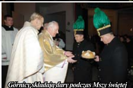
Górnicy składają ofiarę podczas Mszy świętej.