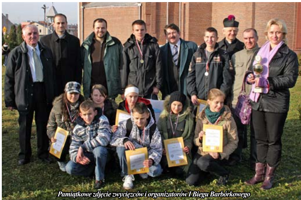
Pamiątkowe zdjęcie zwycięzców i organizatorów I Biegu Barbórkowego