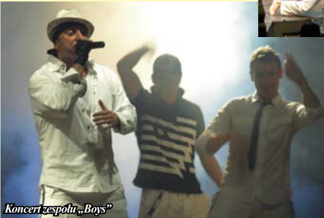
Koncert zespołu „Boys”