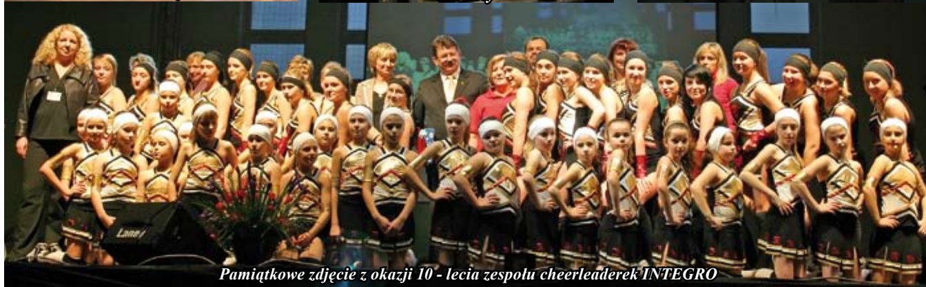
Pamiątkowe zdjęcie z okazji 10 - lecia zespołu cheerleaderek INTEGRO