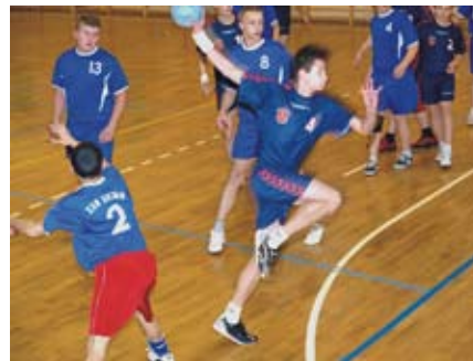
ZS Połaniec - UKS ZORZA Bogoria 16-16 ZSR Sichów - LO Staszów 21-15 OSiR Staszów - UKS ZORZA Bogoria 23-11

ZSR Sichów - ZS Połaniec 14-21 OSiR Staszów - LO Staszów 19-16