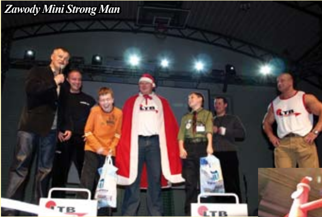
Zawody Mini Strong Man