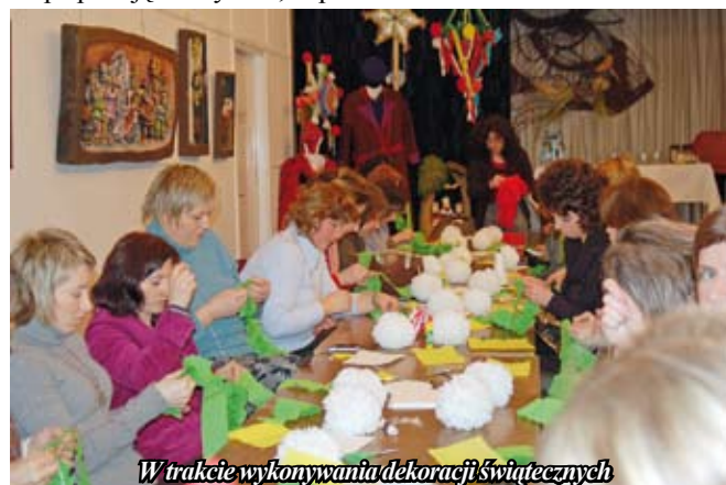
W trakcie wykonywania dekoracji świątecznych