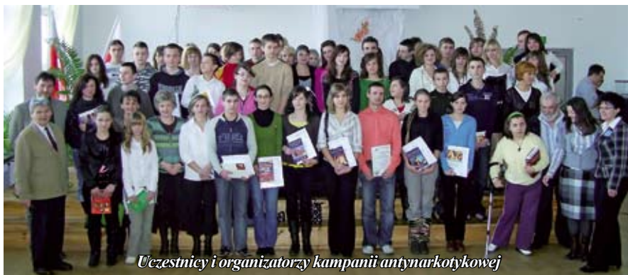
Uczestnicy i organizatorzy kampanii antynarkotykowej