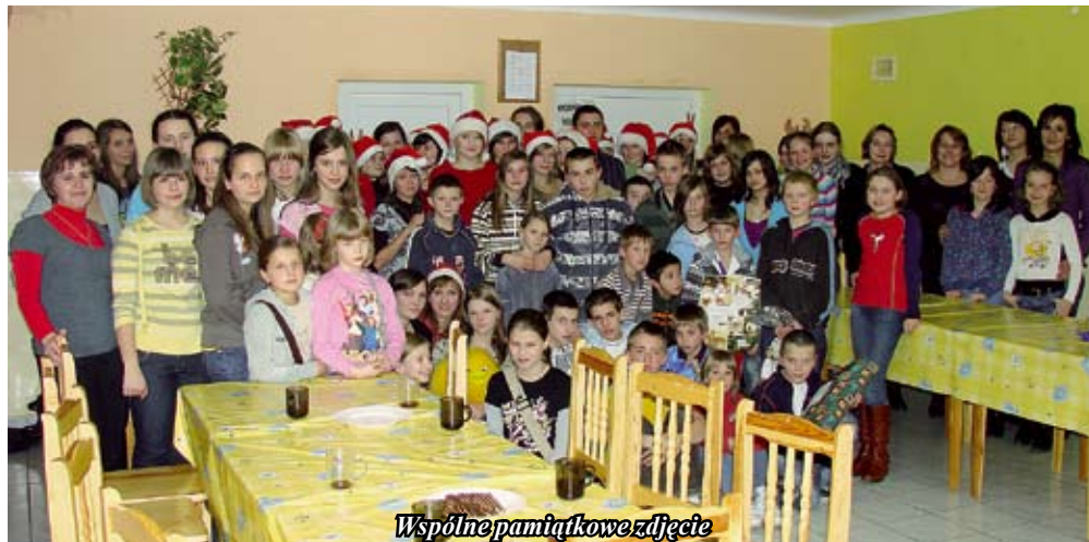
Wspólne pamiątkowe zdjęcie