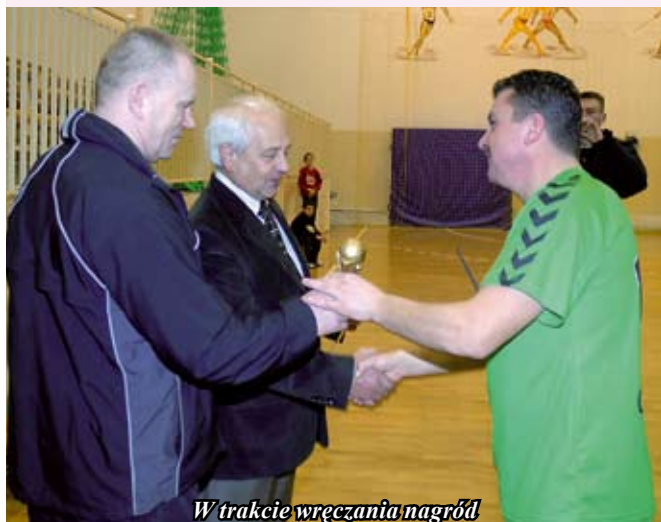
W trakcie wręczania nagród