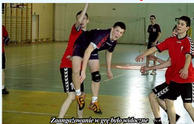
Zaangażowanie w grę było widoczne

W trzecim meczu OSiR zmierzył się ze swoim niedawnym ligowym rywalem drużyną PMOS Busko-Zdrój, której również nie dał szans wygrywając 23-11. W ostatnim meczu rywalami zespołu