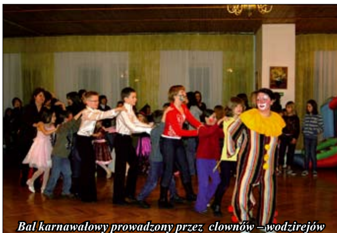
Bal karnawałowy prowadzony przez clownów – wodzirejów