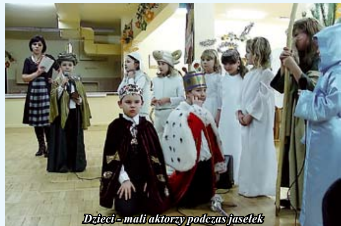
Dzieci - mali aktorzy podczas jasełek