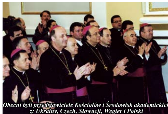
Obecni byli przedstawiciele Kościołów i Środowisk akademickich z: Ukrainy, Czech, Słowacji, Węgier i Polski

Sesja pod tytułem „Chrześcijańska demokracja wyzwaniem dla współczesnej Europy” rozpoczęła się od wykładu Marka Jurka – byłego Marszałka Sejmu RP na temat „Cywilizacja chrześcijańska w dobie demokracji”. Następny wykład przedstawił