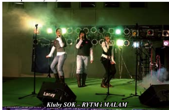
Kluby SOK – RYTM i MALAM