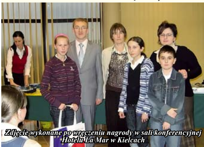
Zdjęcie wykonane po wręczeniu nagrody w sali konferencyjnej Hotelu La Mar w Kielcach