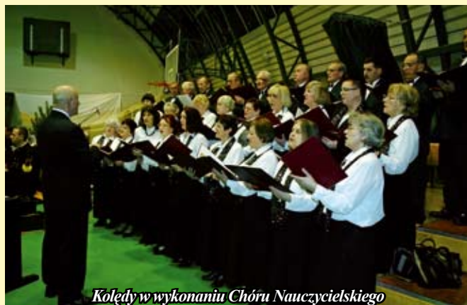
Kolędy w wykonaniu Chóru Nauczycielskiego