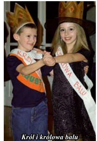
Król i królowa balu

Bal karnawałowy był jedną z wielu atrakcji przygotowanych przez SOK na okres ferii zimowych. Większość z nich odbywało się w klubie osiedlowym „Iskierka” na ul. Jana Pawła II nr 10. We wtorki SOK zapraszał na „Spotkania z kulturą rycerską”, w środy na „Warsztaty muzyczne” – naukę gry na bębnach, w czwartki