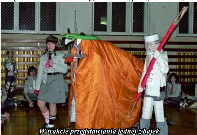
W trakcie przedstawiania jednej z bajek

Zapraszamy na stronę Hufca ZHP Staszów www.zhp.staszow.pl www.zhpstaszow.pl