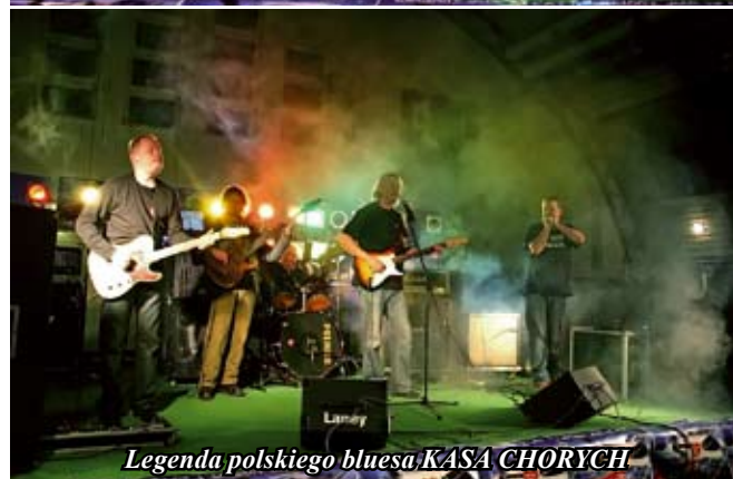
Legenda polskiego bluesa KASA CHORYCH