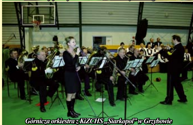
Górnicza orkiestra z KizZCHS „Starkopol” w Grzybowie