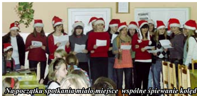
Napoczątku spotkania miało miejsce wspólne śpiewanie koled

Jak co roku wychowankowie placówki z Winiar z nie-