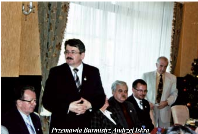
Przemawia Burmistrz Andrzej Iskra