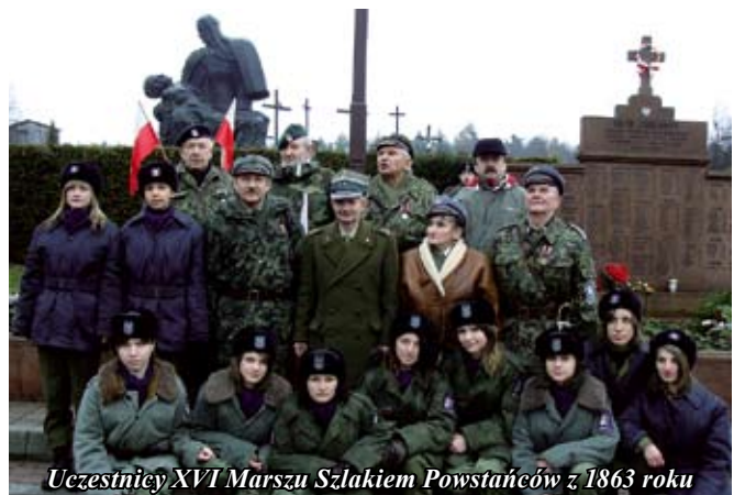
Uczestnicy XVI Marszu Szlakiem Powstańców z 1863 roku