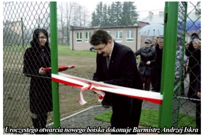
Uroczystego otwarcia nowego boiska dokonuje Burmistrz Andrzej Iskra