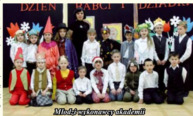
Młodzi wykonawcy akademii