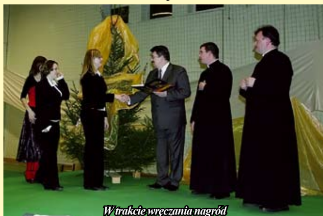
W trakcie wręczenia nagród