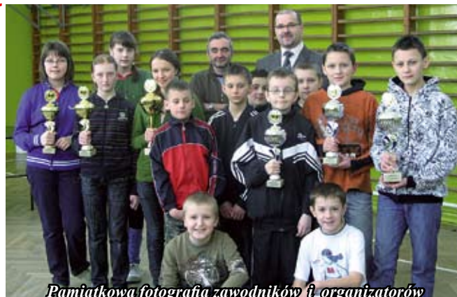
Pamiątkowa fotografia zawodników i organizatorów