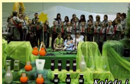
Kolędy i pastorałki w wykonaniu dzieci i młodzieży