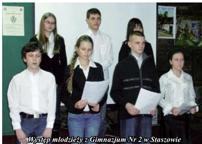
Występ młodzieży z Gimnazjum Nr 2 w Staszowie

Po wystąpieniu kustosa muzeum został zaprezentowany film pt. „Hajda na Moskała”. Film ten przedstawia adaptację bitwy pod Staszowem, jaka miała miejsce w dniu 17 lutego 1863 roku. Zebrani z zaciekawieniem