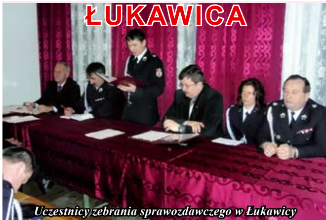
Uczestnicy zebrania sprawozdawczego w Łukawicy

31 stycznia odbyło się walne zebranie sprawozdawcze Ochotniczej Straży Pożarnej w Łukawicy.