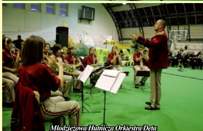
Młodzieżowa Hutnicza Orkiestra Dęta