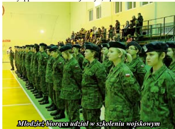
Młodzież biorąca udział w szkoleniu wojskowym