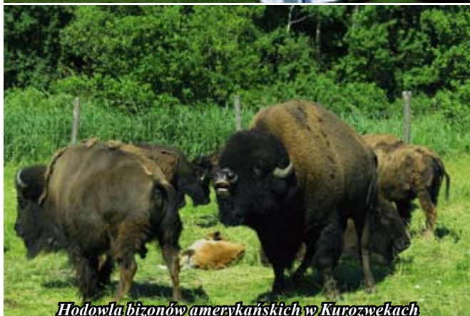
Hodowla bizonów amerykańskich w Kurozwękach