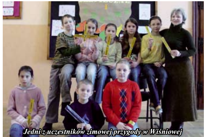
Jedni z uczestników zimowej przygody w Wiśniowej