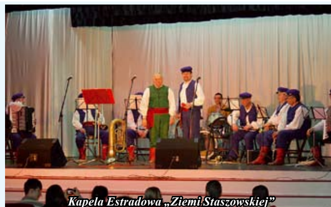
Kapela Estradowa „Ziemia Staszowska”

Staszowski Ośrodek Kultury zaprasza uczniów do