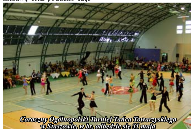
Coroczny Ogólnopolski Turniej Tańca Towarzyskiego w Staszowie, w br. odbędzie się 31 maja

E. Mazanka, fot. I. Kapusta, D. Rożek, GN