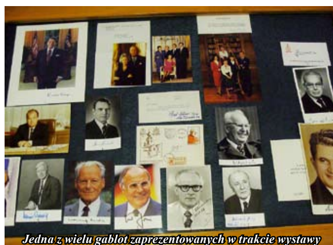
Jedna z wielu gablot zaprezentowanych w trakcie wystawy