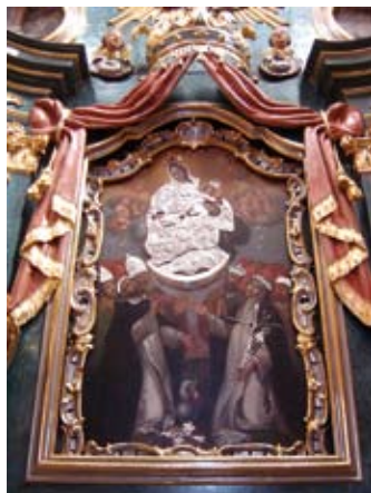
Ołtarz główny w Kaplicy Tęczyńskich

Wewnętrzne obramowania okien są marmurowe, zaś w białym piaskowcu wyrzeźbiono herby Leszczyńskich i Tęczyńskich. Wnętrze kaplicy