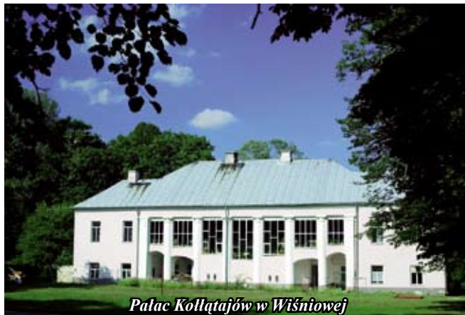
Pałac Kollatajów w Wiśniowej

Główne wejście usytuowano od zachodu. Od południa znajduje się portal barokowy z XVIII w. Główny ołtarz wykonany jest z kamienia, przedstawia on Apostołów Piotra i Pawła pomiędzy czterema kolumnami. Natomiast obraz Przemienienia Pańskiego jest ruchomy. Tabernakulum wykonane