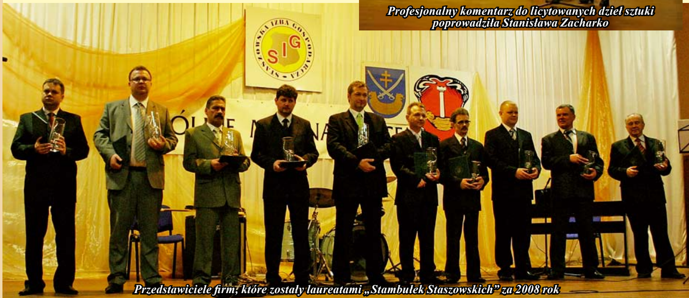
Przedstawiciele firm, które zostały laureatami „Stambułek Staszowskich” za 2008 rok