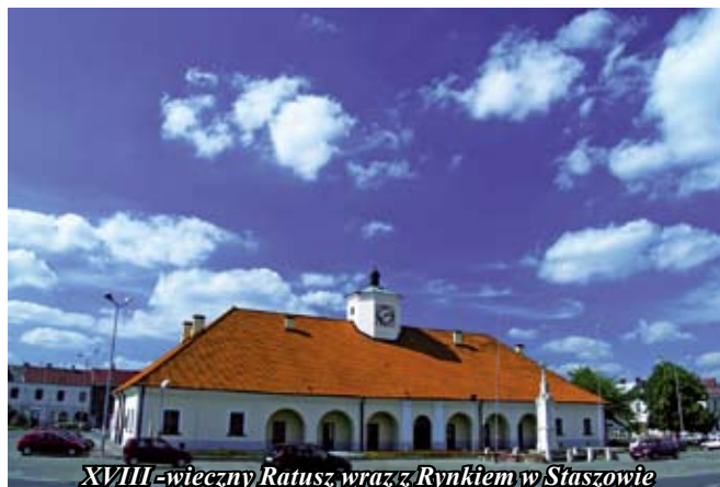
XVIII-wieczny Ratusz, wraz z Rynekem w Staszowie

Przez długie lata obiekt ten był własnością prywatną, dopiero w czasie międzywojennym stał się on własnością miasta. Obecnie w Ratuszu mieści się restauracja „Pod Zegarem”, Biblioteka Pub-