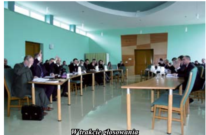
W trakcie głosowania