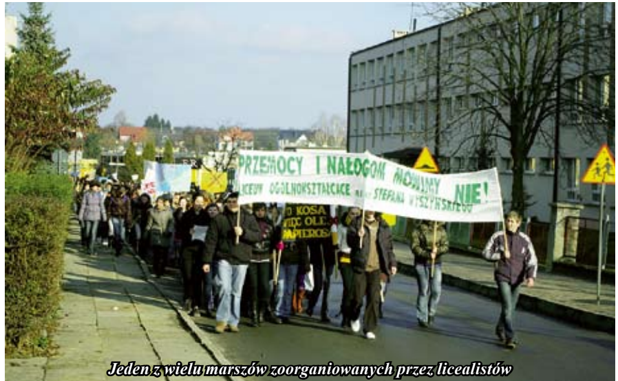
Jeden z wielu marszów zoorganizowanych przez licealistów

W styczniu 2009 r. rozpoczęliśmy czynną realizację tego projektu. Wybrana