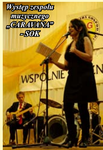
Występ zespołu muzycznego „CARAVANA” -SOK

Opracowano na podstawie materiałów SIG Ewa Mazanka