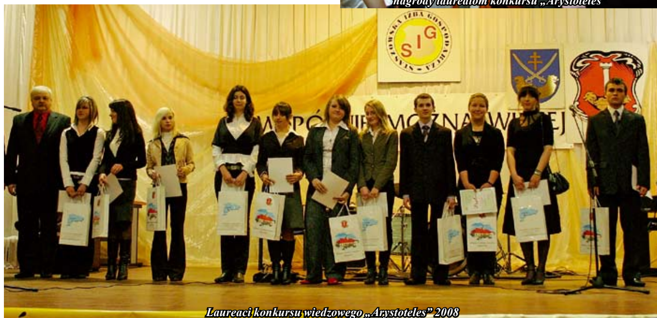
Laureaci konkursu wiedzy „Arystoteles” 2008