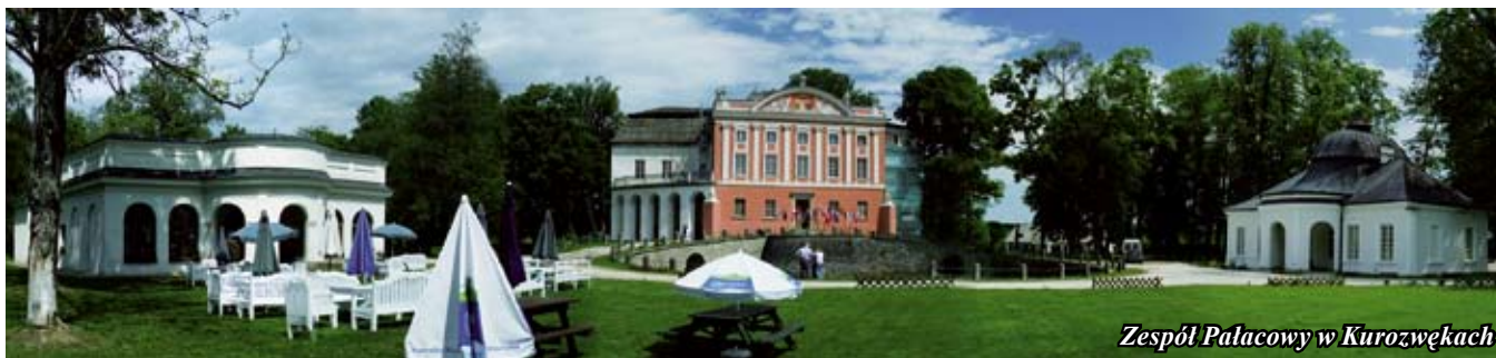
Zespół Pałacowy w Kurozwękach