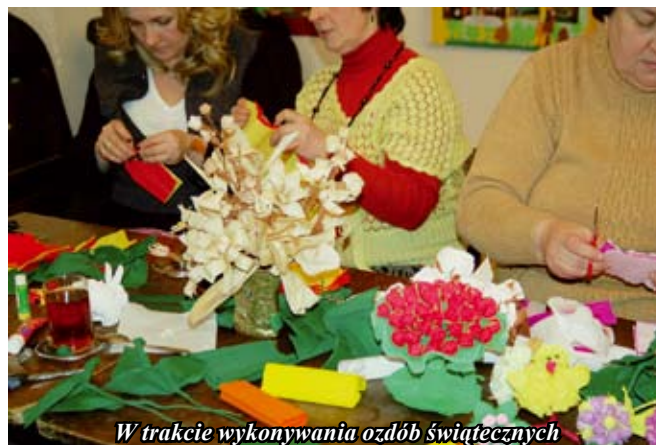
W trakcie wykonywania ozdób świątecznych

zakresie pracownicy SOK przeprowadzili również dla słuchaczy Uniwersytetu III Wieku.