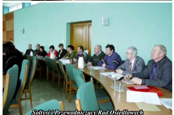
Sołtysi i Przewodniczący Rad Osiedlowych

pod układ komunikacyjny. Radni przegłosowali uchwałę jednomyślnie.