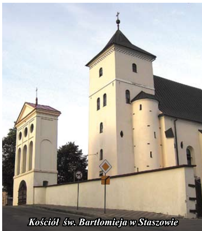
Kościół św. Bartłomieja w Staszowie

Kaplica Matki Boskiej Różańcowej jest późnorennesansową kaplicą, która dobudowana została do kościoła w latach 1613 - 1625.