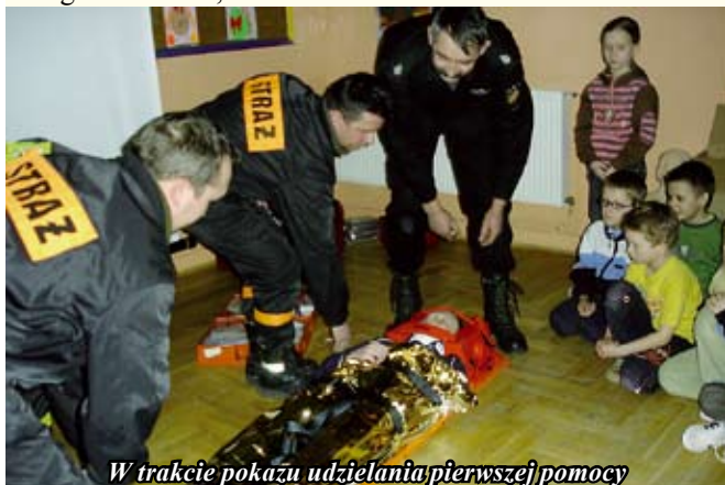
W trakcie pokazu udzielania pierwszej pomocy