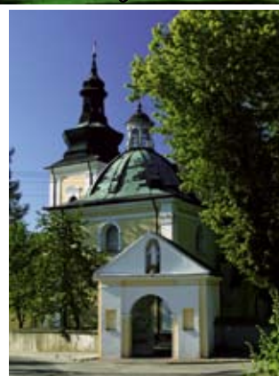
Kościół p.w. Wniebowzięcia Matki Boskiej i św. Augustyna w Kurozwękach

Zespół Pałacowo – Parkowy z XIV w. zaskakuje ciekawą bryłą i dobrym połącze-