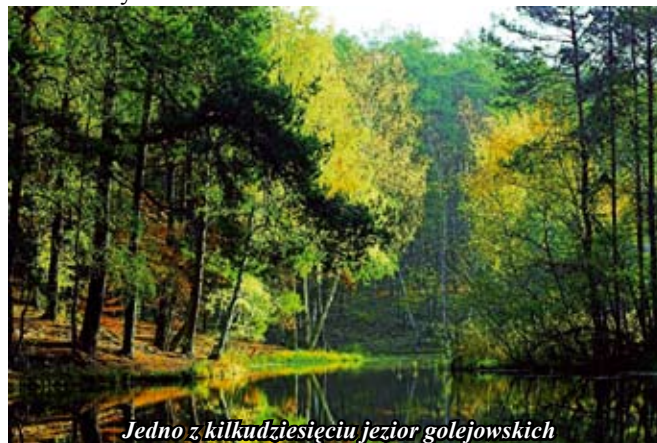
Jedno z kilkudziesięciu jezior golejowskich

Ponadto w lasach golejowskich znajduje się źródło „Pod Dębem”, z którego mieszkańcy Staszowa czerpią wodę. Według mieszkańców naszej okolicy woda ta ma właściwości lecznicze.