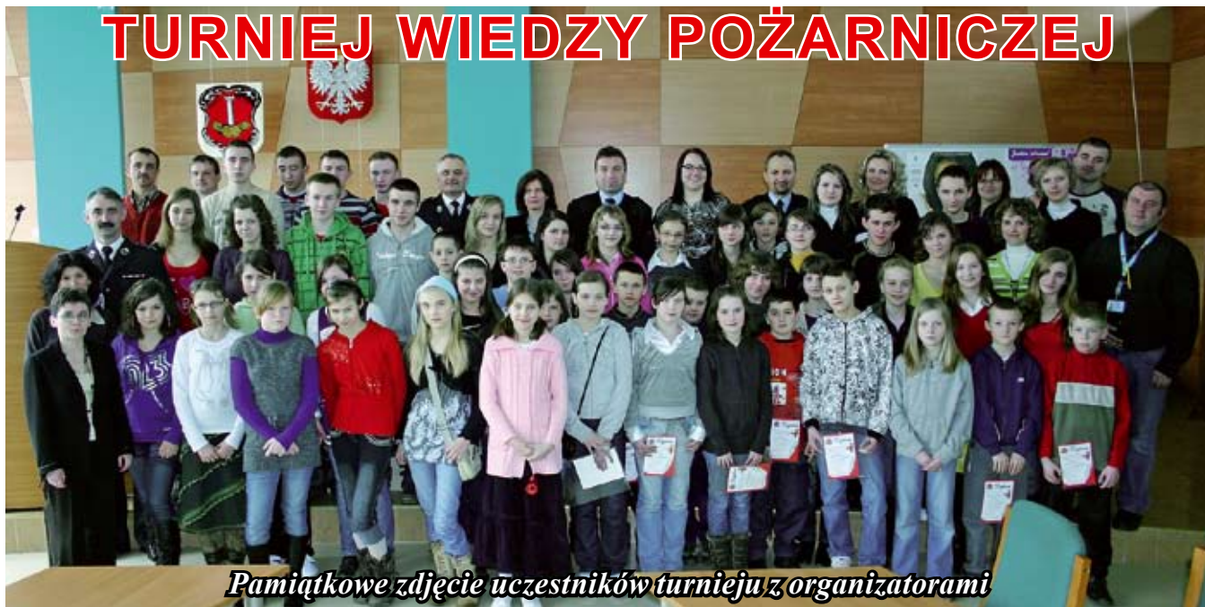
Pamiątkowe zdjęcie uczestników turnieju z organizatorami

13 marca br. w Urzędzie Miasta i Gminy w Staszowie odbyły się eliminacje miejsko – gminne w turnieju wiedzy pożarniczej pn. „Młodzież zapobiega pożarom”.