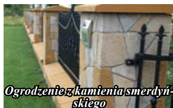
Ogrodzenie z kamienia smerdyńskiego

Początki wsi sięgają I połowy XV wieku, założona ona została przez hrabiego Ossolińskiego, ówczesnego