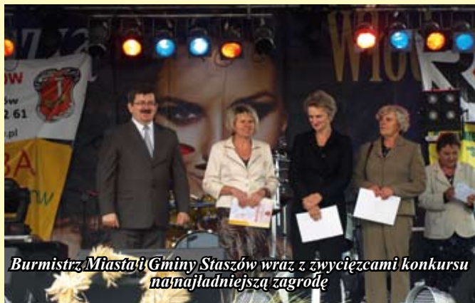
Burmistrz Miasta i Gminy Staszów wraz z zwycięzcami konkursu na najładniejszą zagrodę