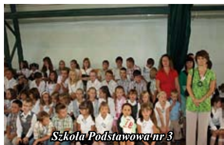
Szkoła Podstawowa nr 3