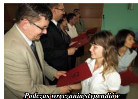
Podczas wręczania stypendiów