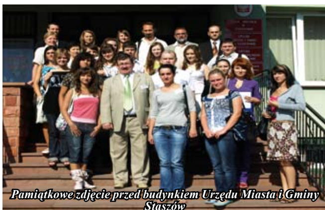
Pamiątkowe zdjęcie przed budynkiem Urzędu Miasta i Gminy Staszów

Oprócz profesorów i innych pracowników naukowych w seminarium uczestniczyło 30 doktorantów i studentów z wyżej wymienionych uczelni. Wygłoszono 25 referatów i wykładów związanych z problematyką badawczą doktorantów i studentów.