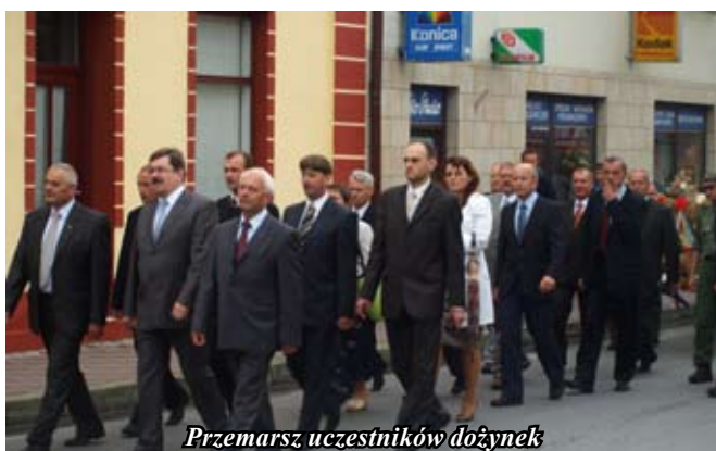
Przemarsz uczestników dożynek