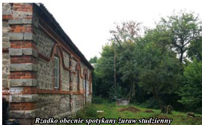
Rzadko obecnie spotykany żuraw studzienny

Smerdyna jak każda wieś posiada swoją historię. Nazwa miejscowości pochodzi od dwóch wyrazów. Są