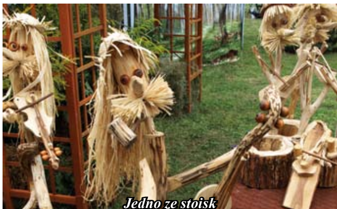
Jedno ze stoisk

która jest solistką sekcji wokalne Teatru Buffo.