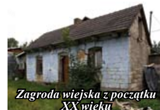
Zagroda wiejska z początku XX wieku

Z kolei w dniu 20 września 2008 roku z okazji 100 – lecia szkoły odbyła się doniosła uroczystość, pod-