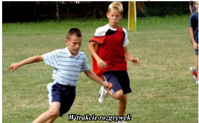
W trakcie rozgrywek