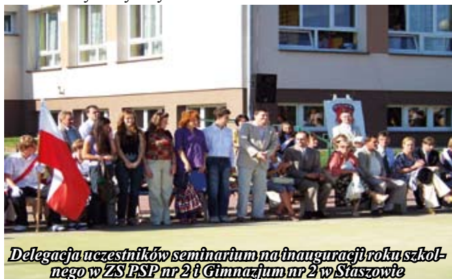
Delegacja uczestników seminarium na inauguracji roku szkolnego w ZSP nr 2 i Gimnazjum nr 2 w Staszowie

Inauguracja Międzynarodowego Seminarium Naukowego miała miejsce w dniu 30 sierpnia 2009 r. w Zamiejscowym Ośrodku Dydaktycznym UJK w Staszowie.