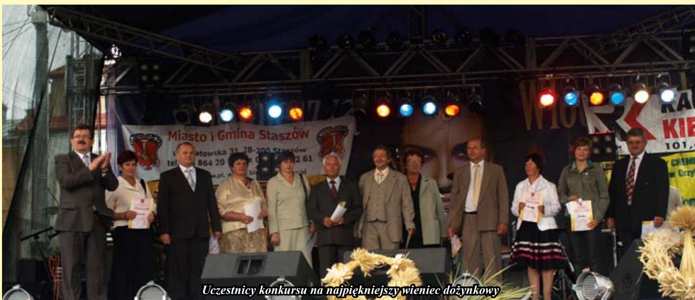
Uczestnicy konkursu na najpiękniejszy wieniec dożynekowy