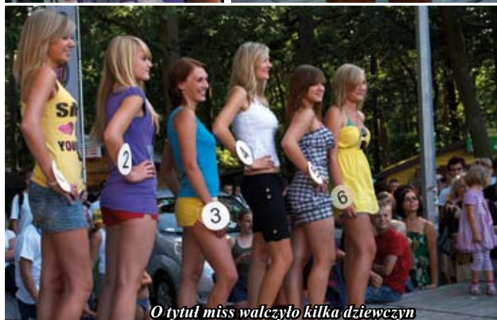
O tytuł miss walczyło kilka dziewczyn