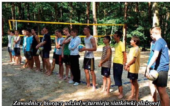
Zawodnicy biorący udział w turnieju siatkówki plażowej

Nagrody dla zwycięzców wręczali m.in. burmistrz Staszowa