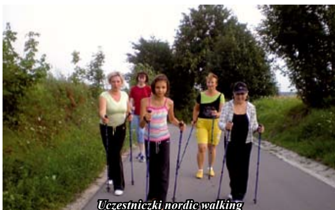
Uczestniczki nordic walking