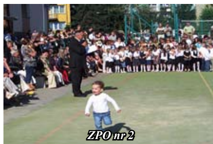
ZPO nr 2