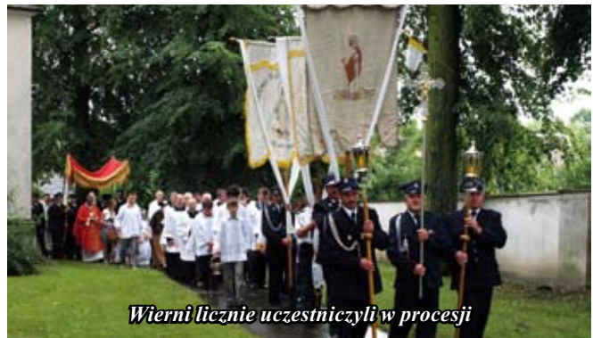
Wierni licznie uczestniczyli w procesji