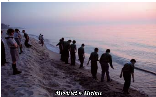
Młodzież w Mielnie

W dniu 13 lutego 2009 roku został założony Komitet Społeczny, którego celem jest zbiórka pieniędzy pozwalająca w okresie wakacyjnym na sfinansowanie wycieczek, obozów, biwaków, dla dzieci z okręgu województwa świętokrzyskiego, zarówno tych najbardziej potrzebujących, jak i wyróżniających się w nauce i zachowaniu. Zbiórka ta ma również na celu zapewnienie bezpieczeństwa dzieciom podczas wakacji poprzez wyposażenie ich w elementy odblaskowe poprawiające widoczność na drodze, a także edukację i profilaktykę w zakresie niepełnoletnich.