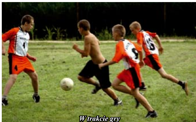
W trakcie gry

tylko jedną bramkę. Drugie miejsce zdobyła FC Złodziejówka, a trzecie wywalczyła Victoria Kurozwałki.