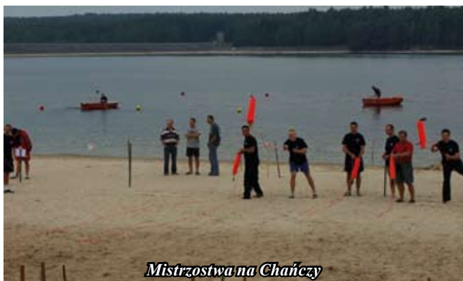
Mistrzostwa na Chańcy

W dniu 29 sierpnia w godzinach od 10 do 17 na terenie kąpieliska Ośrodka Wypoczynkowego w Chańcy odbyły się VIII Mistrzostwa Województwa Świętokrzyskiego Grup Szybkiego Reagowania na Wodzie.