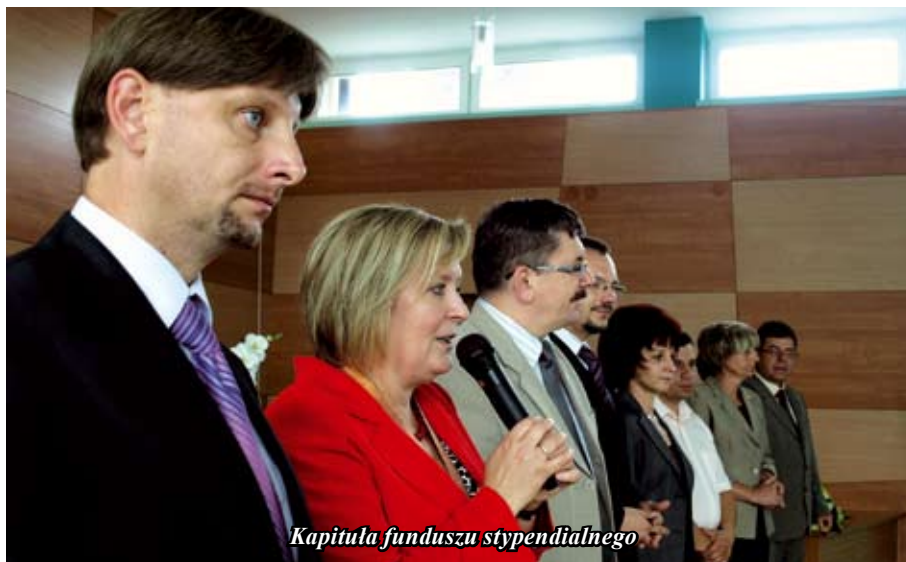
Kapituła funduszu stypendialnego

Redakcja zastrzega sobie prawo do niezamieszczenia lub przesunięcia terminu umieszczenia artykułu na późniejszy oraz edycji i skracania artykułów. Materiały niezamówione nie będą zwracane. Redakcja nie wypłaca honorarium za umieszczone w „Monitorze Staszowskim” materiały.