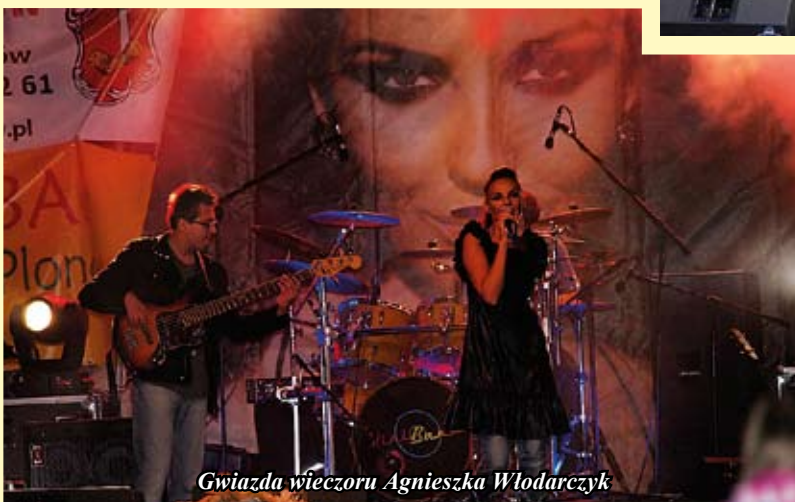
Gwiazda wieczoru Agnieszka Włodarczyk