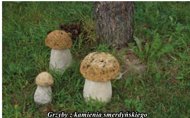
Grzyby z kamienia smerdyńskiego

Na krańcach wsi znajdują się kamieniołomy. Kamień