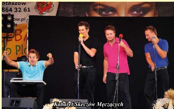
Kabaret Skeczów Mężczyń