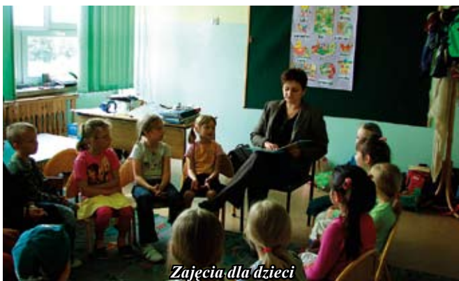
Zajęcia dla dzieci

Kierownik Filii Bibliotecznej w Koniemłotach