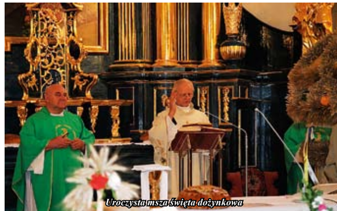
Uroczysta msza święta dożynkowa

Po nabożeństwie udano się na staszowski rynek, gdzie odbywał się dalszy ciąg uroczystości.