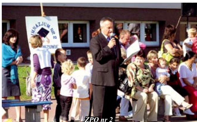
ZPO nr 2