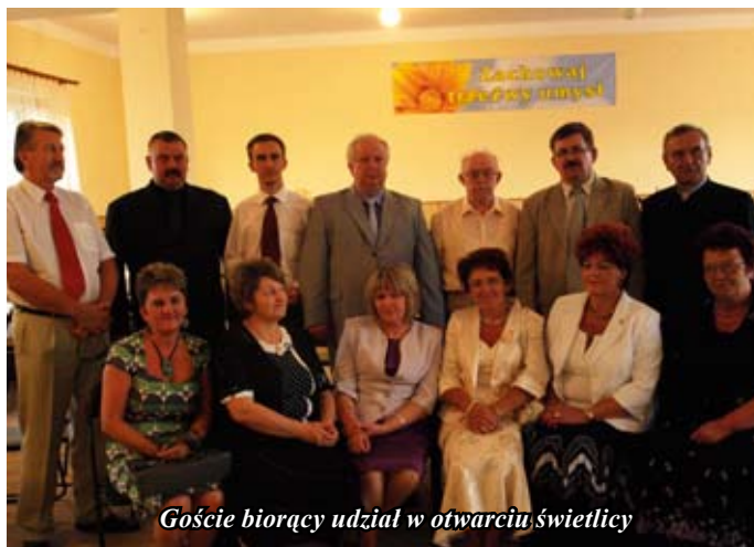
Goście biorący udział w otwarciu świetlicy