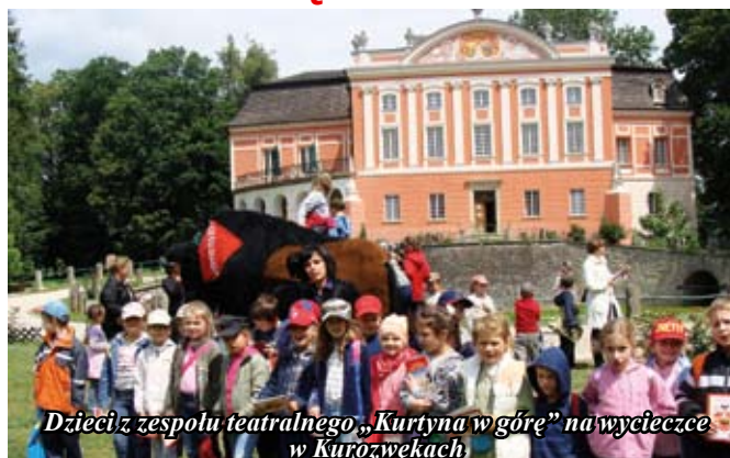
Dzieci z zespołu teatralnego „Kurtyna w górę” na wycieczce w Kurozwękach