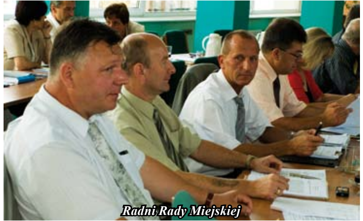
Radni Rady Miejskiej