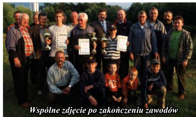
Wspólne zdjęcie po zakończeniu zawodów

Ewa Mazanka