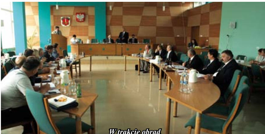
W trakcie obrad