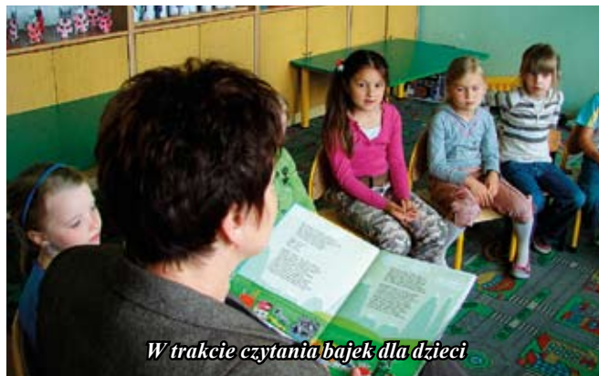
W trakcie czytania bajek dla dzieci

Filia Biblioteczna w Koniemłotach prowadzi bogatą działalność mającą na celu rozwój umiejętności plastycznych, manualnych i rekreacyjnych dzieci i młodzieży. Organizujemy zajęcia z dziećmi, angażując je przez różne formy oddziaływania: czytanie, rysowanie, malowanie, poprzez różnego rodzaju kon-