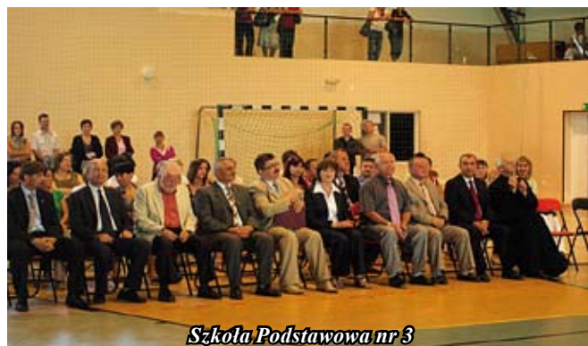
Szkoła Podstawowa nr 3