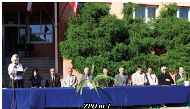
ZPO nr 1