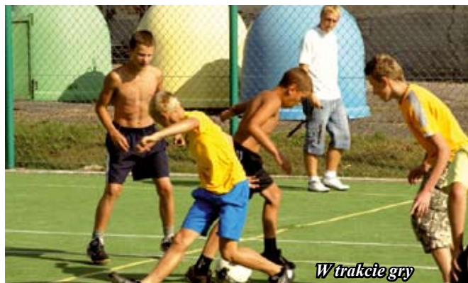
W trakcie gry