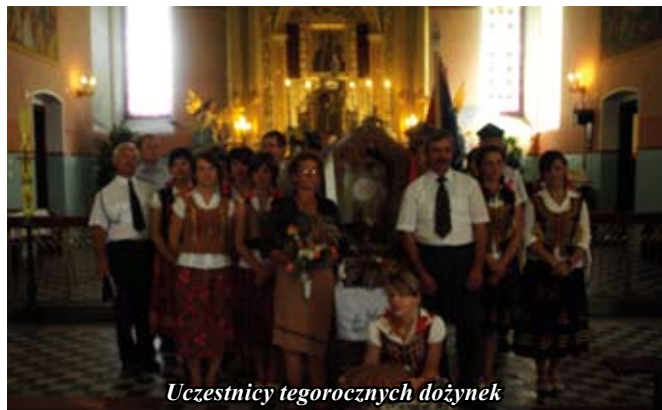
Uczestnicy tegorocznych dożynek

Corocznym zwyczajem dzień 15 sierpnia 2009 roku był kolejnym rokiem obchodów Święta Plonów rejonu obejmującego trzy miejscowości tj. Czajków Południowy, Czajków Północny i Wola Wiśniowska w północno – wschodniej części gminy Staszów.