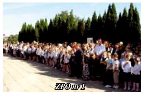
ZPO nr 1