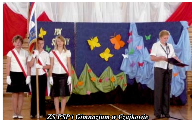
ZS PSP i Gimnazjum w Czajkowie