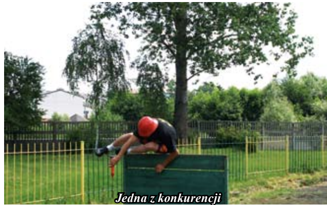
Jedna z konkurencji