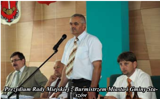
Prezydium Rady Miejskiej z Burmistrzem Miasta i Gminy Staszów

nawierzchni drogi powiatowej nr 0831T Ogledów – przez wieś od km 0+473 do km 1+383”. Uchwałę podjęto jednogłośnie;