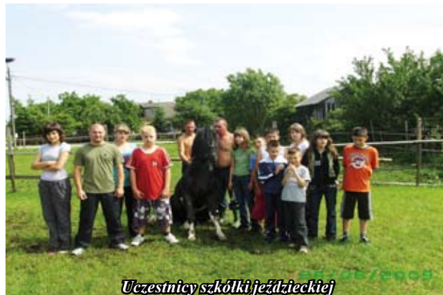
Uczestnicy szkółki jeździeckiej

Zbiórka pieniędzy została przeprowadzona na terenie województwa świętokrzyskiego poprzez postawienie w różnych punktach handlowych na tym obszarze skarbonki. Zebrane pieniądze zostały wydane na letni wypoczynek dla dzieci.