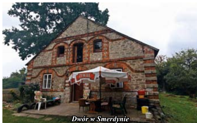
Dwór w Smerdynie

Obok dworu rośnie piękny kilkuset letni dąb.