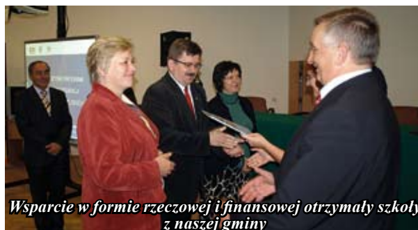
Wsparcie w formie rzeczowej i finansowej otrzymały szkoły z naszej gminy

Później Lidia Pasich przedstawiła strategię wsparcia ŚCDN dla gmin i powiatów w trzech etapach: i etap to: Program Comenius w województwie świętokrzyskim – jak wykorzystywać