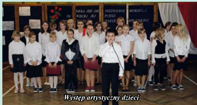
Występ artystyczny dzieci

W Zespole Placówek Oświatowych – Publiczna Szkoła Podstawowa i Przedszkole w Kurozwałkach odbyły się uroczystości związane z otrzymaniem sztandaru, oraz Dniem Edukacji Narodowej.