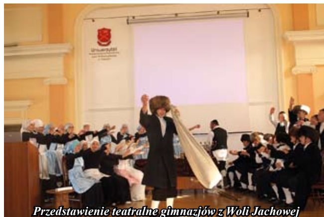
Przedstawienie teatralne gimnazjów z Woli Jachowej