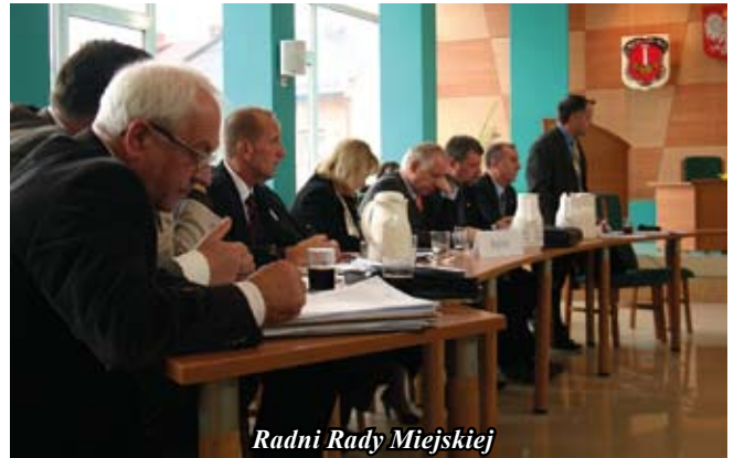
Radni Rady Miejskiej

14+875” w ramach projektu pn.: „Przebudowa Dróg Lokalnych na terenie Powiatu Staszowskiego w 2010 roku – II Etap”