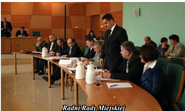
Radni Rady Miejskiej