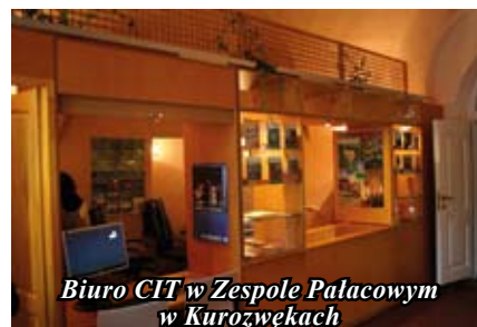
Biuro CIT w Zespole Pałacowym w Kurozwękach