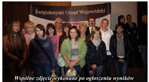
Wspólne zdjęcie wykonane po ogłoszeniu wyników

W poprzednich latach Staszów dwukrotnie zajmował w konkursie wojewody I miejsce. Tegoroczne wyróżnienie świadczy o wciąż dobrej formie organizacyjnej staszowskiego sportu i interesującej ofercie skierowanej dla dzieci i młodzieży. W