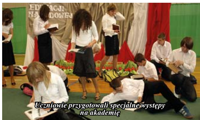
Uczniowie przygotowali specjalne występy na akademię