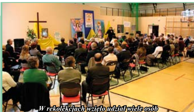
W rekolekcjach wzięło udział wiele osób