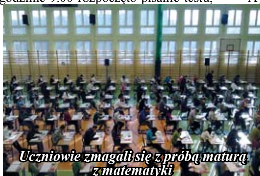
Uczniowie zmagali się z próbą maturą z matematyki