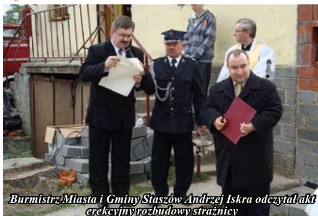
27 lipca 2009 roku, a zakończenie zaplanowano na dzień 31 sierpnia 2010 roku.

Pozwolenie na budowę wydane zostało w dniu 12 września 2007 roku, natomiast umowę na wykonanie inwestycji podpisano w dniu