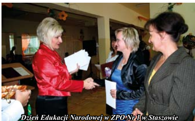
Dzień Edukacji Narodowej w ZPO Nr 1 w Staszowie