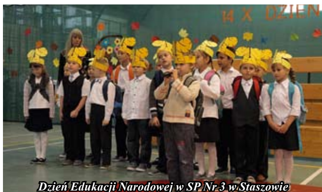
Dzień Edukacji Narodowej w SP Nr 3 w Staszowie