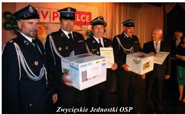
Zwycięskie Jednostki OSP