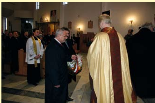
Uroczyste składanie darów