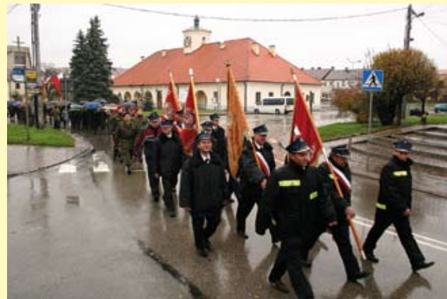
Uroczysty pochód niepodległościowy