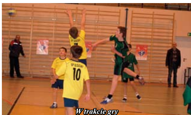
W trakcie gry

Hala OSiR była areną rozgrywek VI edycji Małej Ligi Piłki Ręcznej. To jedna z największych tego typu imprez w Polsce.