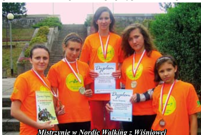
Mistrzyni w Nordic Walking z Wiśniowej

Przed startem obowiązkowo przeprowadziłyśmy rozgrzewkę, w celu odpowiedniego przygotowania organizmu