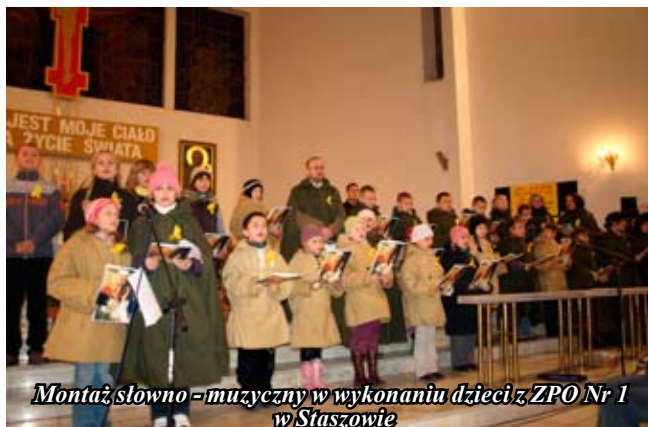
Montaż słowno – muzyczny w wykonaniu dzieci z ZPO Nr 1 w Staszowie