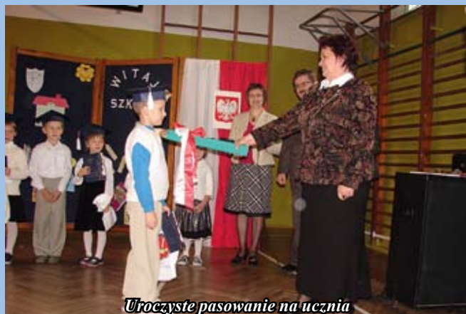
Uroczyste pasowanie na ucznia

Rodzice z wielką uwagą i wzruszeniem przyglądali się i po-