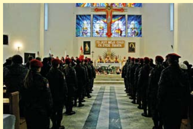
Msza święta za Ojczyznę