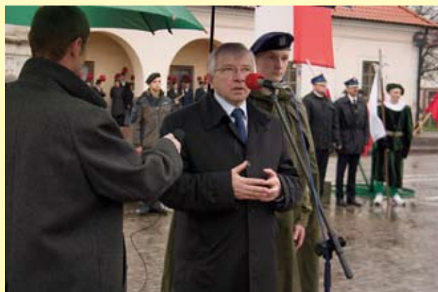
Na staszowskim rynku przemawiał Poseł na Sejm RP Krzysztof Lipiec