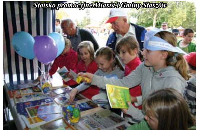
Stoisko promocyjne Miasta i Gminy Staszów