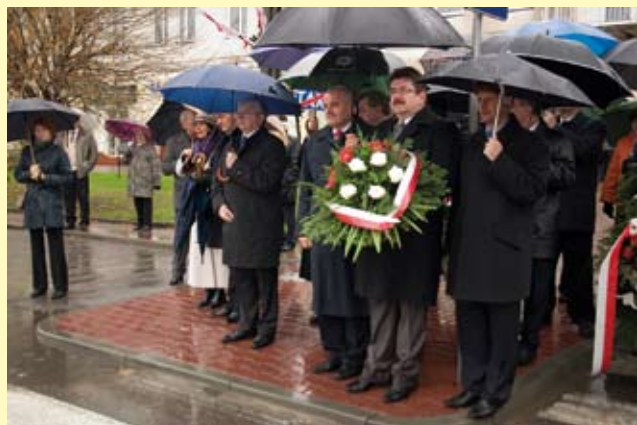
Delegacje władz samorządowych, zakładów pracy, partii politycznych na staszowskim rynku