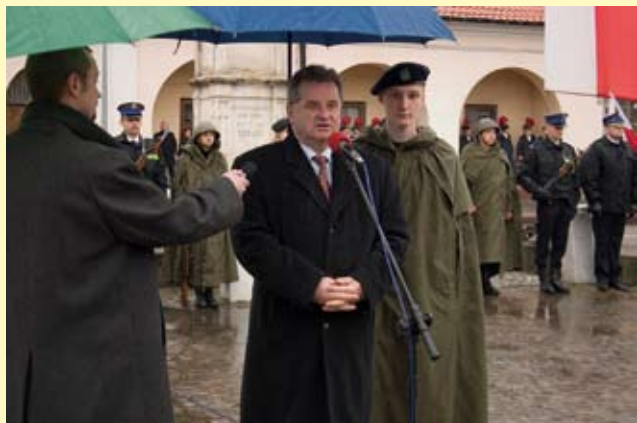
Na staszowskim rynku przemawiał Poseł na Sejm RP Andrzej Pałys