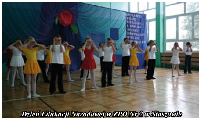
Dzień Edukacji Narodowej w ZPO Nr 2 w Staszowie