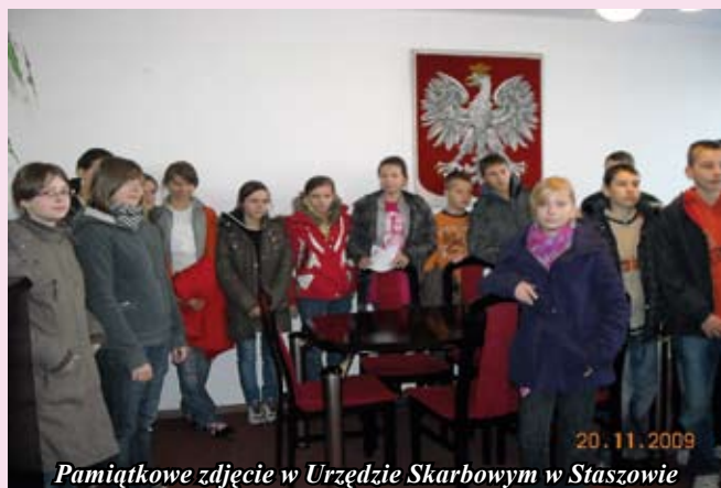
Pamiątkowe zdjęcie w Urzędzie Skarbowym w Staszowie