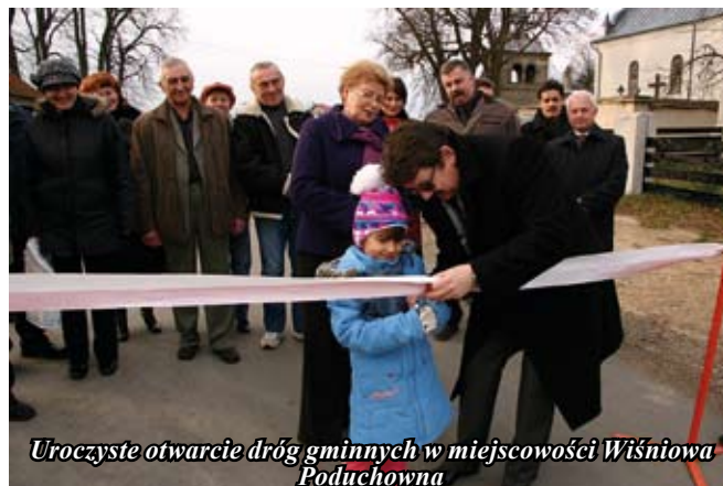
Uroczyste otwarcie dróg gminnych w miejscowości Wiśniowa Poduchowna