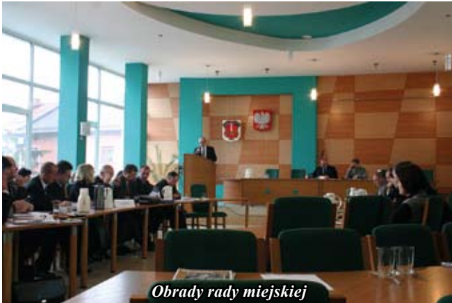
Obrady rady miejskiej