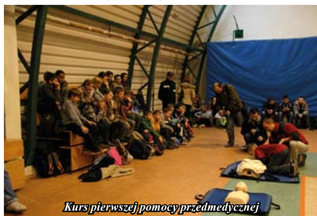
Kurs pierwszej pomocy przedmedycznej

Sponsorami tegorocznych nagród byli: KiZChS „Siarkopol” UMiG Staszów i LZS oraz apteki T. Kasperkiewicza.