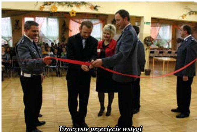
Uroczyste przecięcie wstęgi