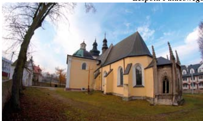
Kościół p.w. Wniebowstąpienia Matki Boskiej i św. Augustyna