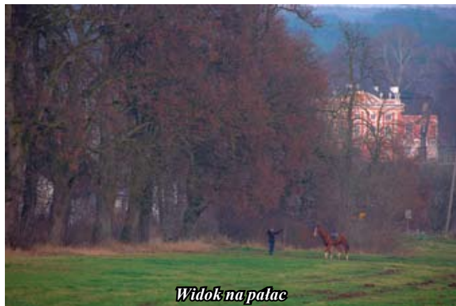
Widok na pałac