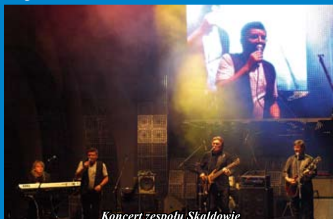
Koncert zespołu Skaldowie

Konkurs „Gmina Fair Play” jest inicjatywą, która skierowana jest do samorządów, które dbając o interesy społeczności lokalnych stwarzają na swoim terenie możliwe najlepsze warunki dla rozwoju działalności