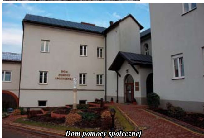
Dom pomocy społecznej