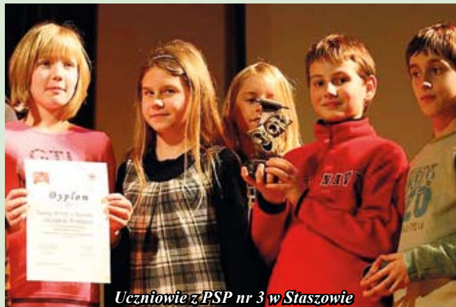
Uczniowie z PSP nr 3 w Staszowie