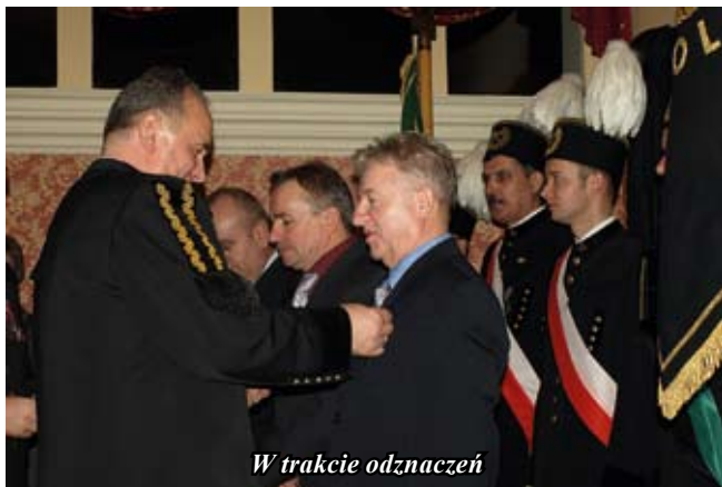
W trakcie odnaczeń

W trakcie uroczystości barbórkowych przyznane zostały odznaczenia i wyróżnienia.