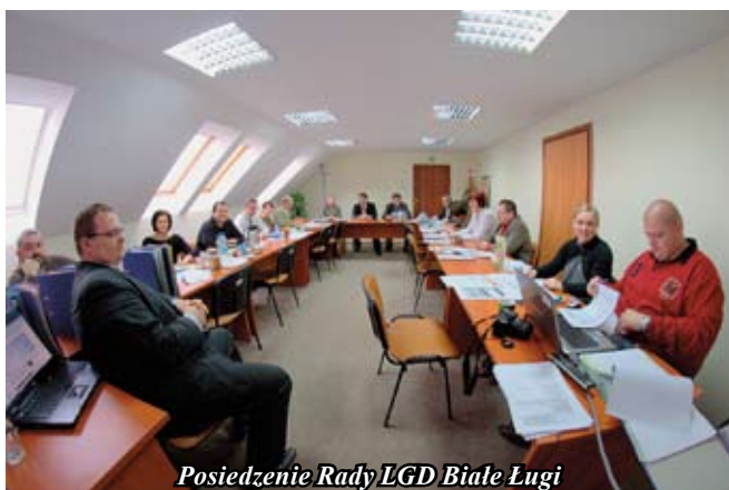
Posiedzenie Rady LGD Białe Ługi

Spośród złożonych przez Urząd Miasta i Gminy w Staszowie wniosków zakwalifikowały się trzy na łączną kwotę dofinansowania 59974 zł. W ramach realizowanych zadań wydany zostanie album promocyjny oraz rozpoczęta będzie kampania promująca produkt turystyczny „Wiśniowa – wieś z Sercem”; wykonany zostanie turystyczny portal regionalny oraz utworzone „Cybermuzeum Ziemi Staszowskiej”. Ponadto zakwalifikowały się również wnioski złożone przez Staszowski Ośrodek Kultury, Lokalną Organizację Turystyczną „Czym Chata Bogata” i inne podmioty z gminy Staszów. Dofinansowanie projektów stanowi 70% kosztów kwalifikowanych, przy czym do 10% kosztów może stanowić wkład pracy własnej i usług świadczonych nieodpłatnie.