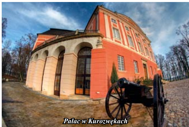
Pałac w Kurozwękach