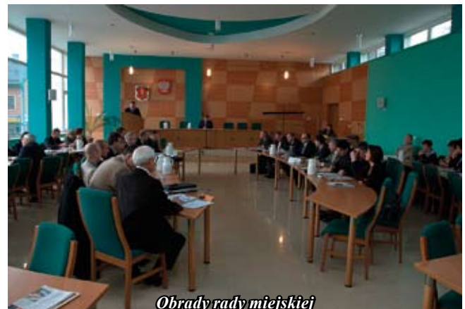
Obrady rady miejskiej

i zbiorowe odprowadzanie ścieków przez Przedsiębiorstwo Gospodarki Komunalnej i Mieszkaniowej Spółka Gminy z o.o. w Staszowie oraz w sprawie dopłaty do opłat za odprowadzanie ścieków; za głosowało 10, 3 przeciw, 5 wstrzymało się.