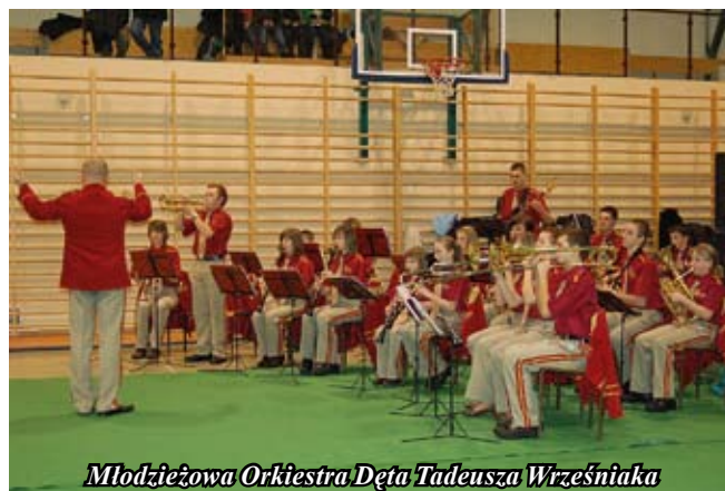
Młodzieżowa Orkiestra Dęta Tadeusza Wrześniaka