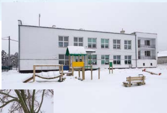
Szkola i nowy plac zabaw.