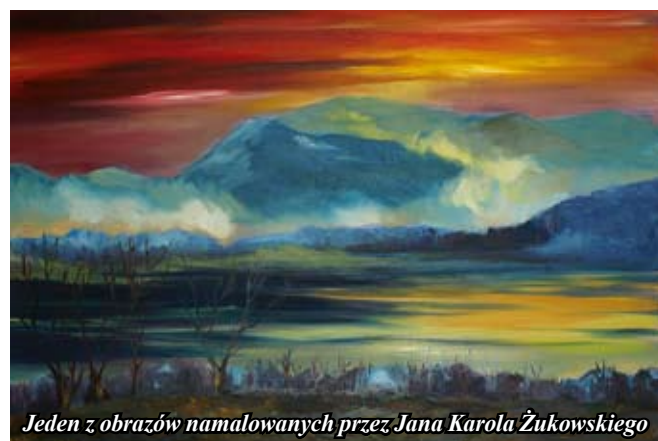
Jeden z obrazów namalowanych przez Jana Karola Żukowskiego