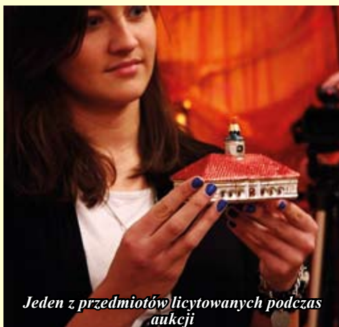
Jeden z przedmiotów licytowanych podczas aukcji