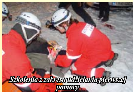
Szkolenia z zakresu udzielania pierwszej pomocy