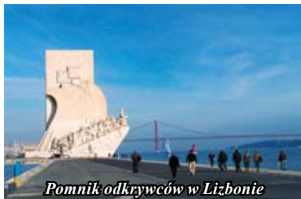
Pomnik odkrywców w Lizbonie