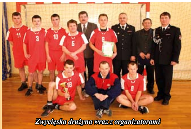
Zwycięska drużyna wraz z organizatorami