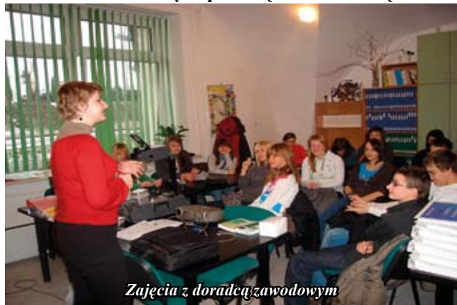
Zajęcia z doradcą zawodowym

Gimnazjum nr 1 w Staszowie aktywnie wspiera uczniów w planowaniu kariery edukacyjnej i zawodowej. Szkoła współpracuje z partnerami działającymi na rzecz przygotowania uczniów do wejścia na rynek pracy, zaprasza konsultantów i lokalnych przedsiębiorców. Jedną z takich