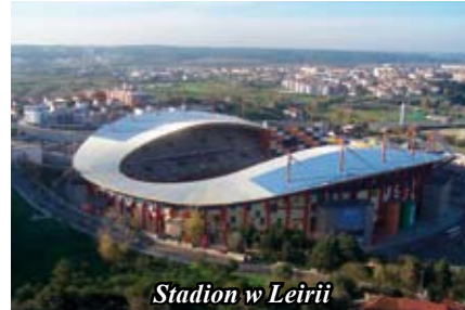
Stadion w Leirii

czek mogliśmy oglądać niespotykaną u nas roślinność i charakterystyczne dla Portugalii budowle.