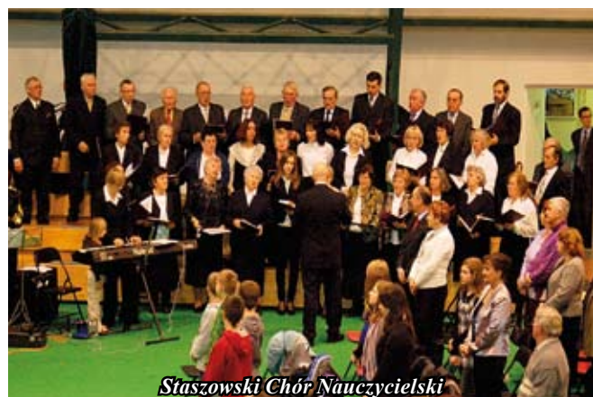
Staszowski Chór Nauczycielski