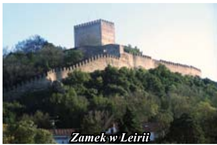
Zamek w Leirii