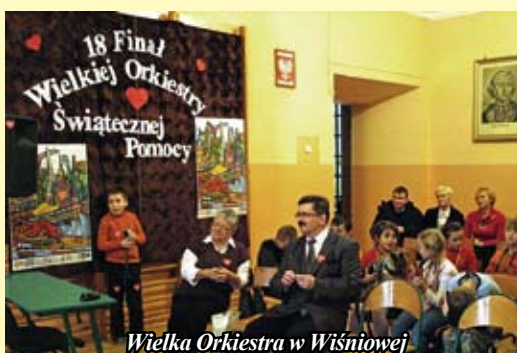
Wielka Orkiestra w Wiśniowie

tów wystawionych na licytację. Przebieg licytacji słuchacze radia mogli usłyszeć na żywo na naszej antenie. Był jednak miły akcent