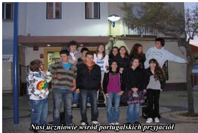
Nasi uczniowie wśród portugalskich przyjaciół

z nich rozumieliśmy, bo prowadzone były po portugalsku. Zajęcia w ich szkole odbywają się trochę inaczej niż u nas. Wszystkie środy mają wolne. Lekcje zaczynają się tam o godzinie 8:30, a kończą o 18:00. W godzinach obiadowych (około 13) mają przerwę na lunch. Lekcja trwa u nich różnie od 60 do 90 min. Szkoła składa się z kilku oddzielnych budynków. W głównym znajduje się sekretariat, pokój nauczycielski, biblioteka i stołówka, a resztę szkoły stanowią sale lekcyjne. Mają oni również dużą salę gimnastyczną i kilka boisk na dworze.