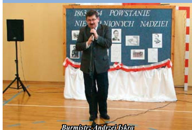
Burmistrz Andrzej Iskra