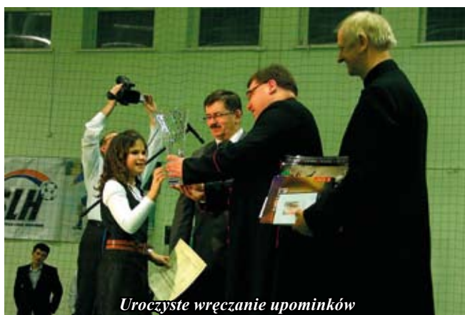
Uroczyste wręczenie upominków