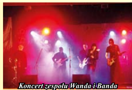
Koncert zespołu Wanda i Banda