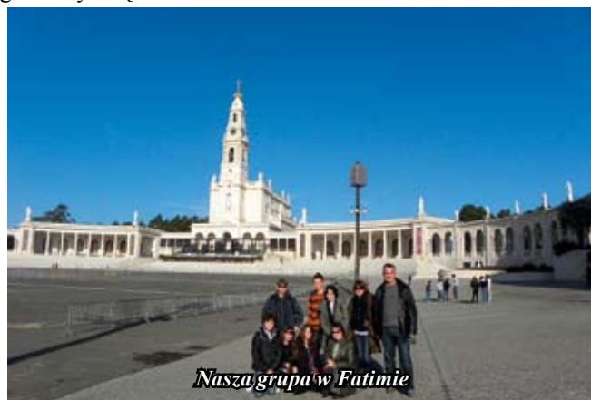
Nasza grupa w Fatimie

z nich rozumieliśmy, bo prowadzone były po portugalsku. Zajęcia w ich szkole odbywają się trochę inaczej niż u nas. Wszystkie środy mają wolne. Lekcje zaczynają się tam o godzinie 8:30, a kończą o 18:00. W godzinach obiadowych (około 13) mają przerwę na lunch. Lekcja trwa u nich różnie od 60 do 90 min. Szkoła składa się z kilku oddzielnych budynków. W głównym znajduje się sekretariat, pokój nauczycielski, biblioteka i stołówka, a resztę szkoły stanowią sale lekcyjne. Mają oni również dużą salę gimnastyczną i kilka boisk na dworze.