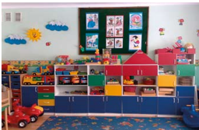
Przedszkole w Wiązownicy Dużej.