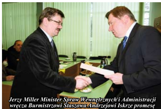
Jerzy Miller Minister Spraw Wewnętrznych i Administracji wręcza Burmistrzowi Staszowa Andrzejowi Iskrze promesę

W poniedziałek 8 lutego minister Spraw Wewnętrznych i Administracji Jerzy Miller wręczył burmistrzowi Miasta i Gminy Staszów Andrzejowi Iskrze promesę na kwotę 300 tys. zł.