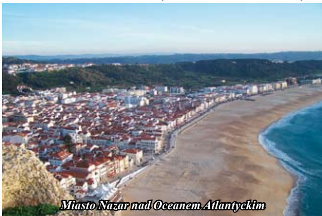
Miasto Nazar nad Oceanem Atlantyckim

Portugalczyki są bardzo tolerancyjni. Do szkoły, w której byliśmy, chodzi wielu uczniów, lecz nie wszyscy są tego samego koloru skóry. Są tam uczniowie rasy białej, czarnej, żółtej, latynosi – co u nas mogłoby wywołać dziwne reakcje wśród niektórych osób – a tak nie powinno być. Ogromne wrażenie wywarł na nas Ocean Atlantycki, który podziwialiśmy przy zachodzie słońca. Zwiedziliśmy również sanktuarium w Fatimie, i samą Leirię – miasto, w którym mieszkaliśmy. Znajduje się tam przepiękny zamek, oraz stadion, zbudowany na Euro 2004. Podczas wycie-