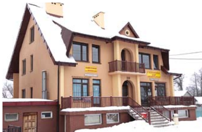
Piekarnia i sklepy.