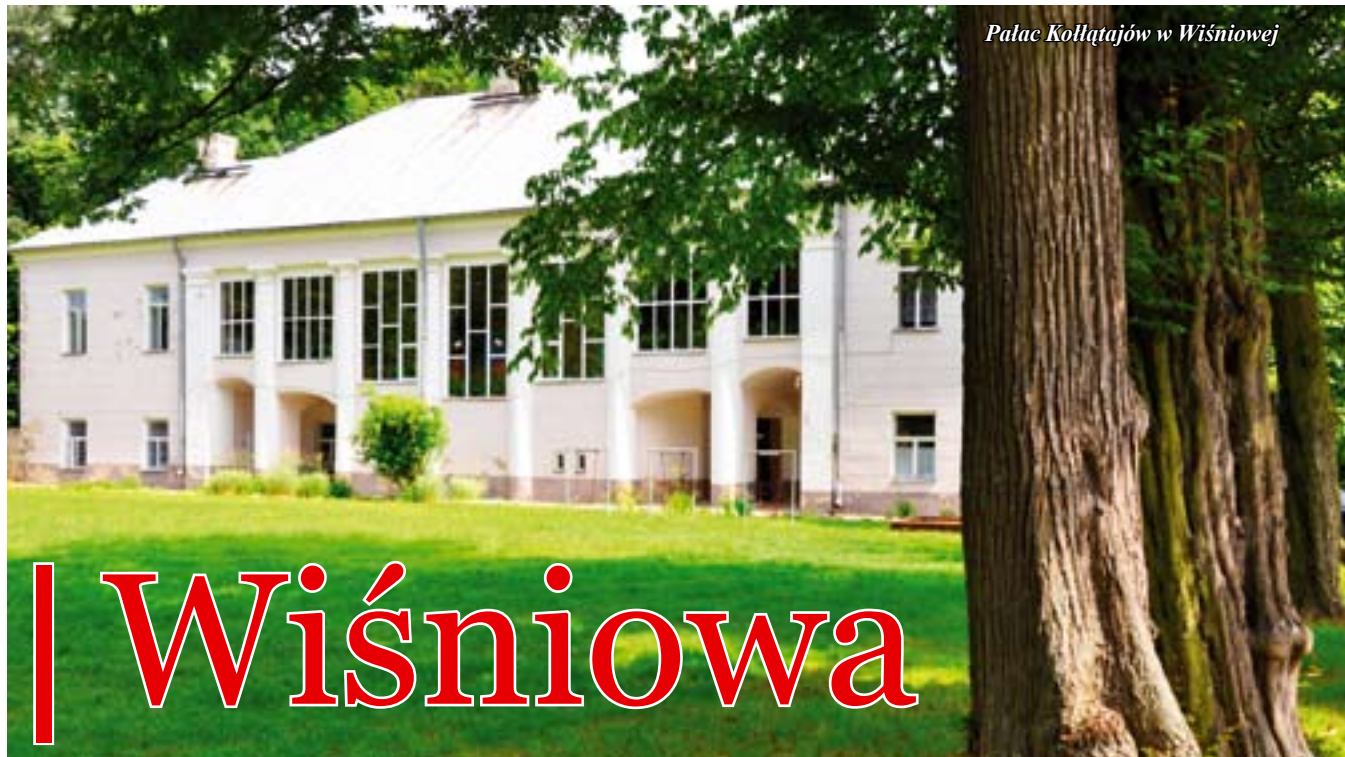
Pałac Kołłątajów w Wiśniowej

Kilka kilometrów od Staszowa, na obydwu brzegach Kacanki leży stara malownicza wieś Wiśniowa. Pierwsze wzmianki o osadnictwie na tym terenie pochodzą z XIII w, kolejne z Kodeksu Dyplomatycznego Katedry Krakowskiej z roku 1390. Jej początki sięgają XV wieku nazywano ją wtedy Starą Wsią. Zapewne obficie tu rosnące na słonecznych wzgórzach doliny wiśnie dały nazwę Wiśniowa.