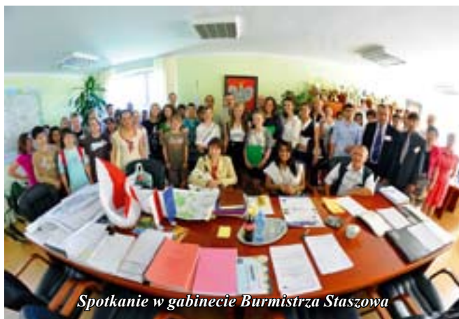
Spotkanie w gabinecie Burmistrza Staszowa