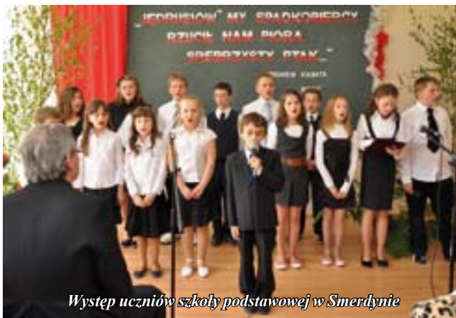
Występ uczniów szkoły podstawowej w Smerdynie

Święto Patrona dopełnił uroczysty poczęstunek.