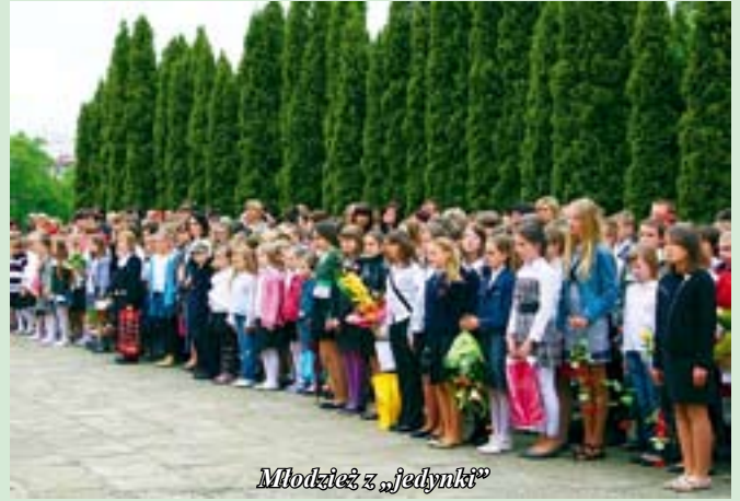
Młodzież z „jedynki”