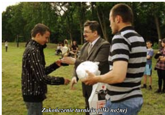
Zakończenie turnieju piłki nożnej