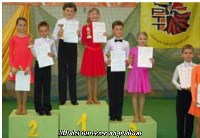
Młodzi tancerze na podium