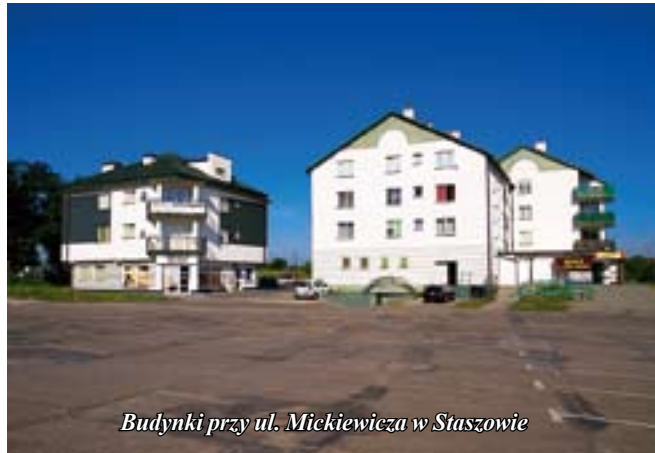
Budynki przy ul. Mickiewicza w Staszowie

Prowadzimy także roboty budowlane związane z infrastrukturą czyli wodociągi i kanalizacje oraz oczyszczalnie ścieków. Realizowaliśmy sieci wodociągowe dla gminy Staszów w Jasieniu, Woli Osowej, Łukawicy i Smerdynie. Sieci kanalizacyjne wraz z oczyszczalnią ścieków dla gminy Kije – gdzie uczestniczyliśmy w realizacji ponad 100 km sieci. Wymienię jeszcze budowę oczyszczalni ścieków dla miejscowości Dąbrowice gm. Baranów Sandomierski