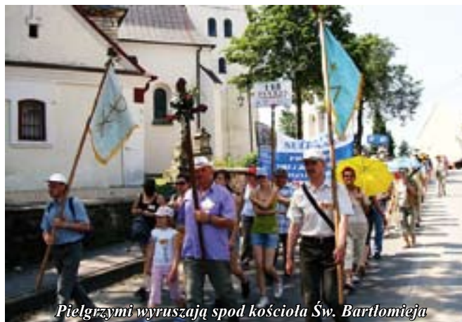
Pielgrzymi wyruszają spod kościoła Św. Bartłomieja

Sanktuarium Maryjne w Sulisławicach, tworzy zabytkowy zespół dwóch kościołów.