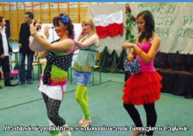
Prezentacja profilaktyczna w wykonaniu uczennic Gimnazjum w Czajkowie