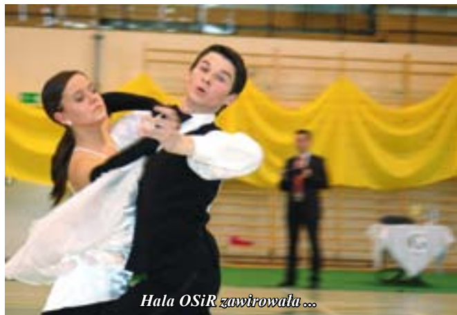
Hala OSiR zawirowała ...

W dniu 22 maja 2010 roku w hali widowiskowo-sportowej odbył się VI Ogólnopolski Turniej Tańca Towarzyskiego o Puchar Tadeusza Wrześniaka.