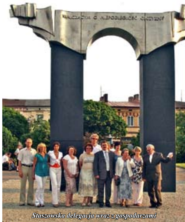
Staszowska delegacja wraz z gospodarzami