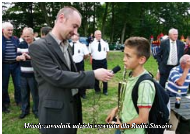
Młody zawodnik udziela wywiadu dla Radia Staszów

Zarówno zawodnicy i trenerzy uczestniczący w turnieju jak i wielu turystów uczestniczących w imprezie mogli skorzystać ze smacznej wojskowej grochówki przygotowanej przez strażaków z OSP Staszów, a ufundowanej przez Miejsko-Gminne Zrzeszenie LZS w Staszowie.