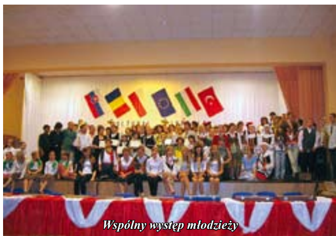
Wspólny występ młodzieży