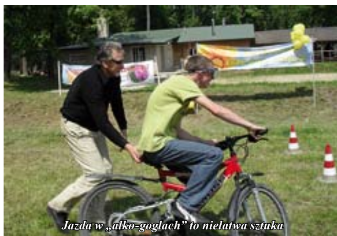
Jazda w „alko-goglach” to niełatwa sztuka