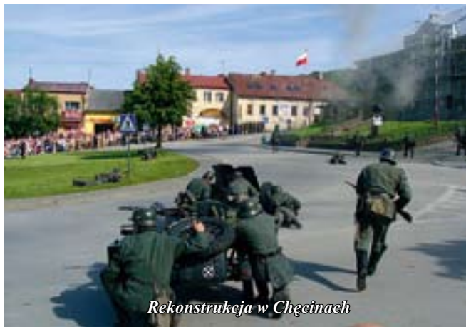
Rekonstrukcja w Chęcinach