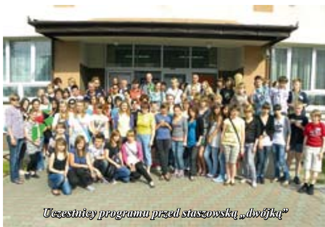
Uczestnicy programu przed staszowską „dwójką”