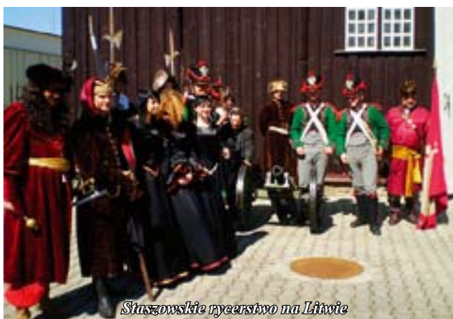
Staszowskie rycerstwo na Litwie

Następnego dnia wszyscy udali się do polskiej miejscowości o dźwięcznej nazwie Wędziagoła -rodowej osadzie