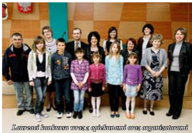
Laureaci konkursu wraz z opiekunami oraz organizatorami