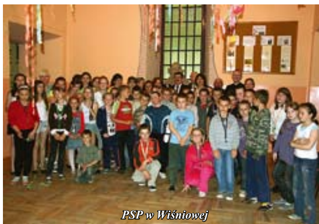
PSP w Wiśniowej