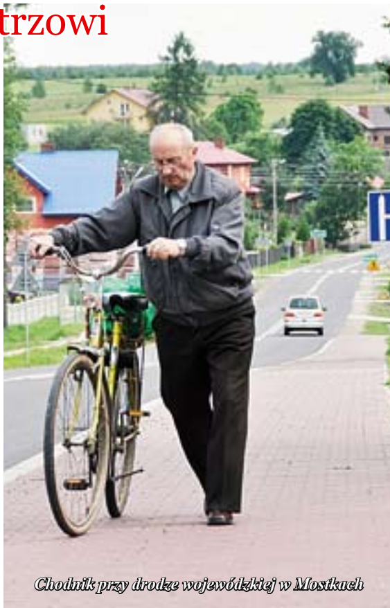
Chodnik przy drodze wojewódzkiej w Mostkach