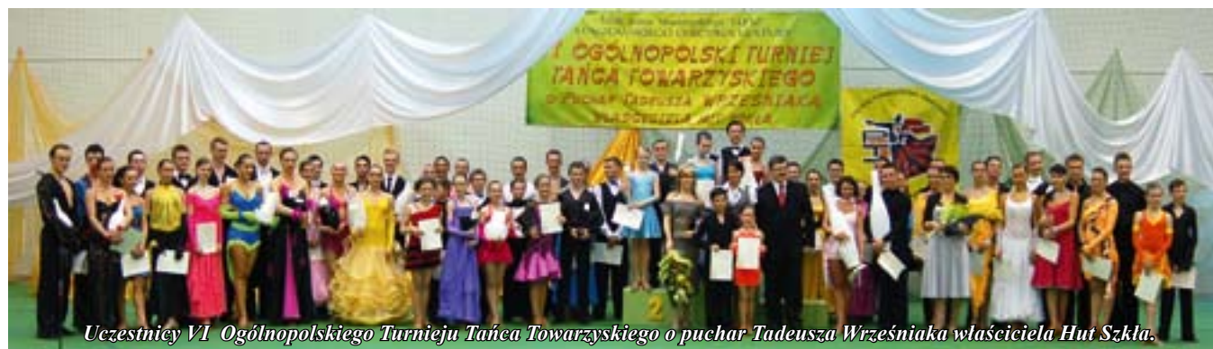
Uczestnicy VI Ogólnopolskiego Turnieju Tańca Towarzyskiego o puchar Tadeusza Wrześniaka właściciela Hut Szkła.