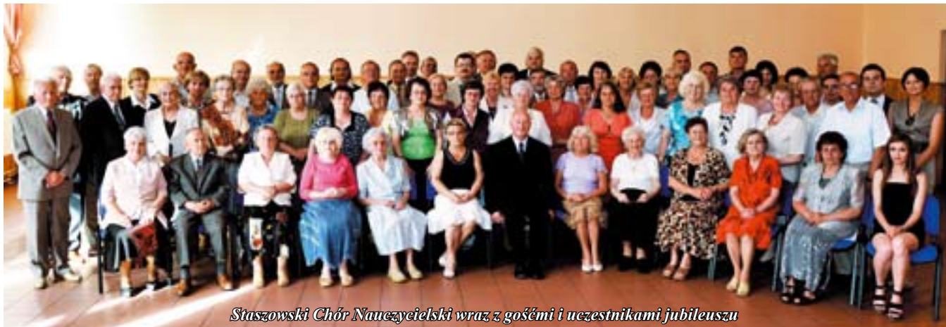
Staszowski Chór Nauczycielski wraz z gośćmi i uczestnikami jubileuszu