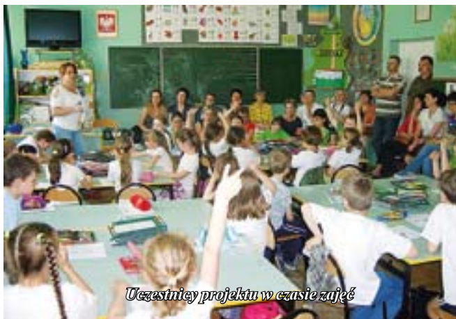
Uczestnicy projektu w czasie zajęć

ność własną. Projekt stworzył warunki do wszechstronnego rozwoju dziecka, jego kreatywności, ciekawości poznawczej i otwartości na wiedzę. Nauczyciel dzięki indywidualizacji pracy mógł poznać dokładniej zainteresowania, upodobania, możliwości intelektualne każdego dziecka. Pogłębił się osobisty i emocjonalny kontakt nauczyciela z uczniem. Praca opierała się na wspólnym działaniu. Nauczyciel mógł poka-