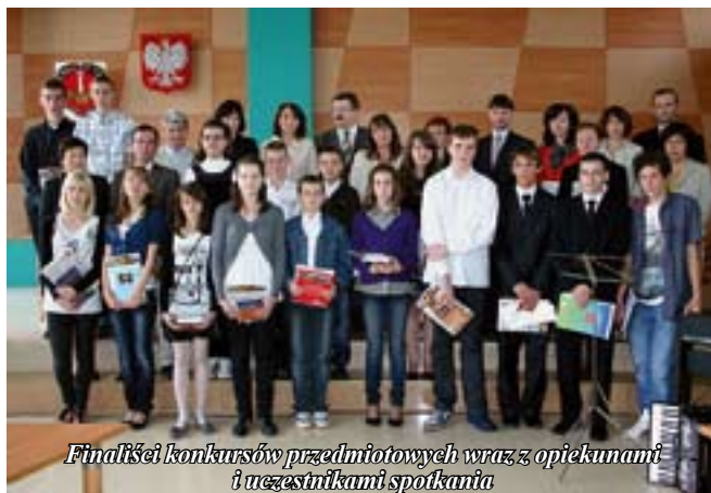
Finaliści konkursów przedmiotowych wraz z opiekunami i uczestnikami spotkania