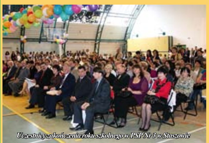
Uczestnicy zakończenia roku szkolnego w PSP Nr 3 w Staszowie