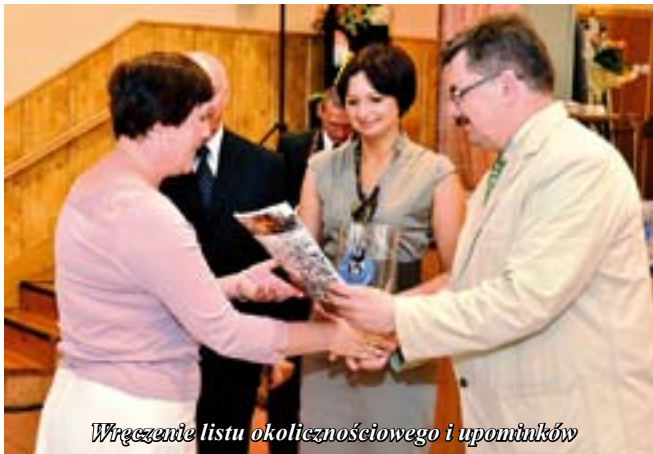
Wgręzenie listu okolicznościowego i upominków

Aktualnie w repertuarze mamy około 100 pieśni, a więc możemy śpiewać na każdą okazję. Do pieśni wymienionych wcześniej kompozytorów doszły pieśni takich klasyków jak: Chopin, Verdi, Lenon, Moniuszko, Koszowski, itp. Do bardzo ważnych wydarzeń zaliczamy nasze koncerty z okazji 15-lecia, 20-lecia, 25-lecia, 30-lecia istnienia i działalności naszego chóru.