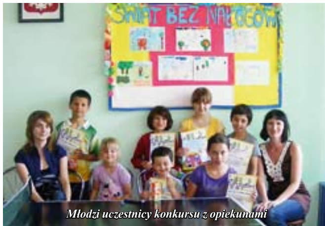
Młodzi uczestnicy konkursu z opiekunkami