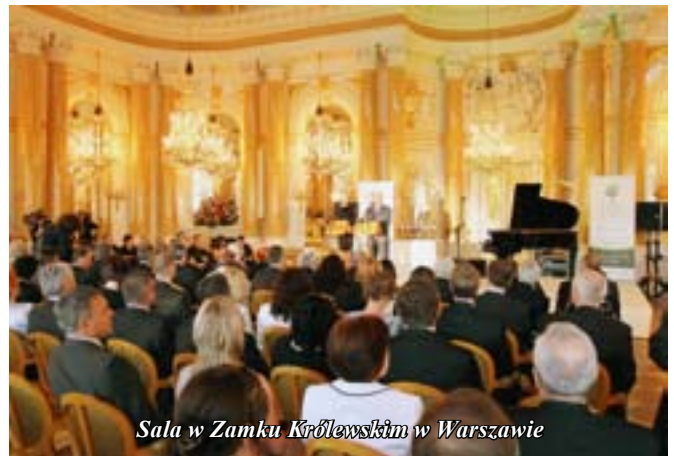
Sala w Zamku Królewskim w Warszawie

odpowiedni klimat dla rozwoju aktywności obywatelskiej. Wśród wyróżnionych w tej kategorii znalazł się Staszów.