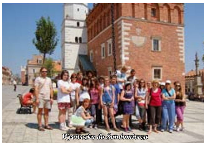
Wycieczka do Sandomierza