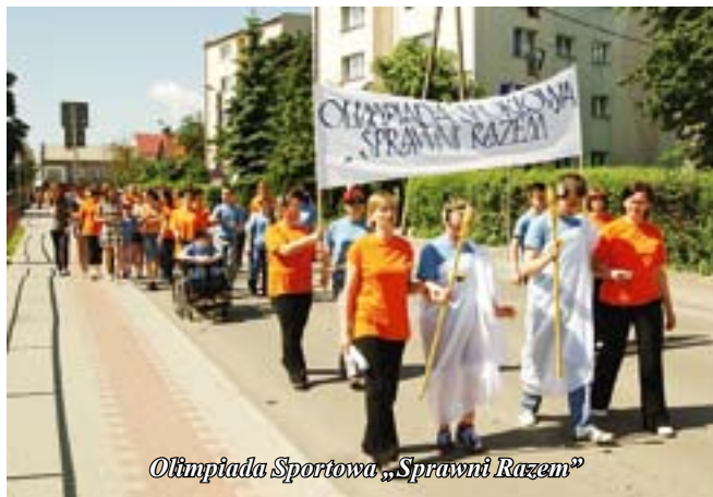
Olimpiada Sportowa „Sprawni Razem”