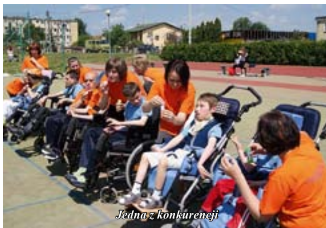
Jedna z konkurencji