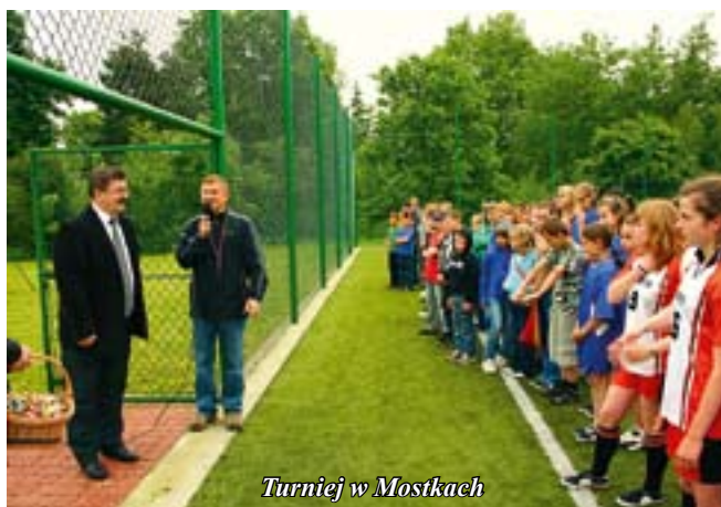
Turniej w Mostkach