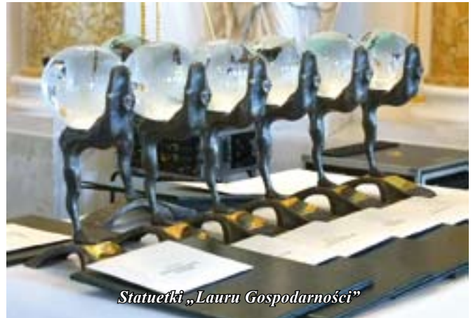
Statuetki „Lauru Gospodarności”

W kategorii czwartej – Rozwój Kapitału Społecznego, wybrane zostały gminy, które potrafią udowodnić, że rozumieją potrzebę współdziałania z organizacjami pozarządowymi wspomagając ich jako niezbędnego partnera władz samorządowych, oraz że mają plan takiego współdziałania i tworzą