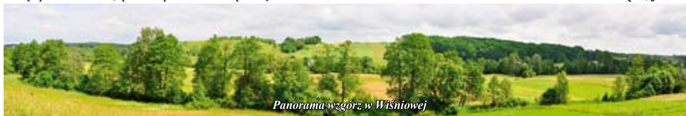
Panorama wzgórz w Wiśniowej