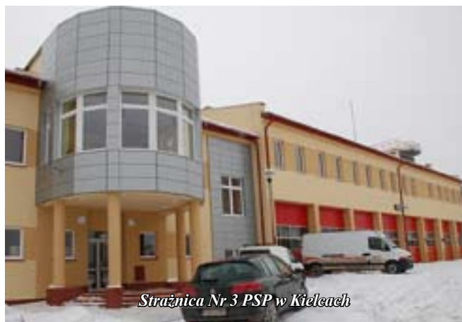
Strażnica Nr 3 PSP w Kielcach

oraz udział w realizacji sieci kanalizacyjnej dla gm. Polaniec poprzez realizację sieci kanalizacyjnej w Winnicy i Podskalą oraz modernizację oczyszczalni ścieków w Polańcu.