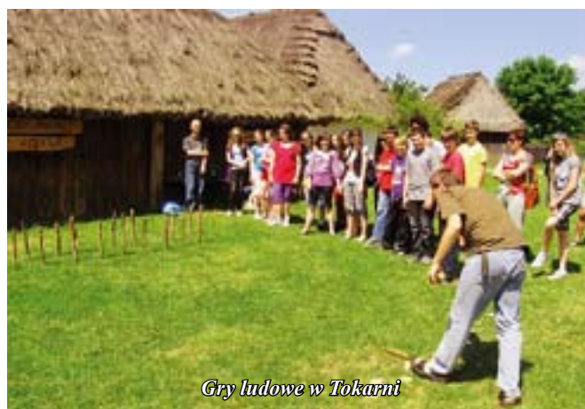
Gry ludowe w Tokarni