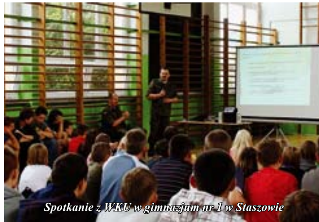
Spotkanie z WKU w gimnazjum nr 1 w Staszowie