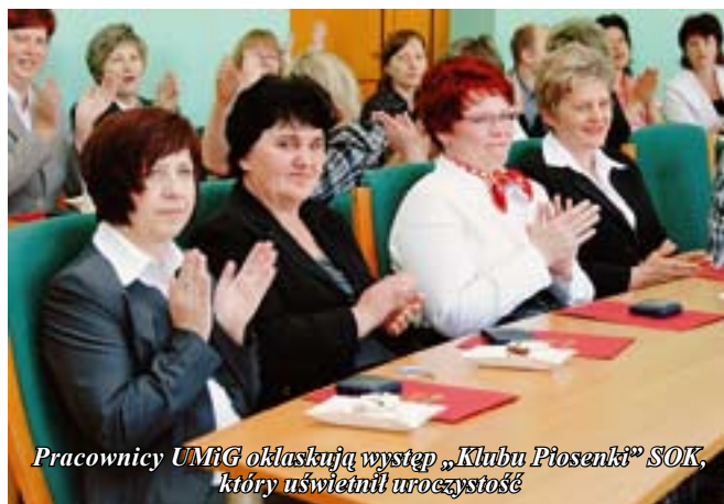
Pracownicy UM i G oklaskują występ „Klubu Piosenki” SOK, który uświetnił uroczystość