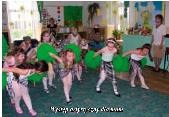
Występ artystyczny dla mam

„... Spójrz Twoja Matka Siedzi przy Tobie Otula Ciebie ramieniem swym. Spójrz Twoja Matka Siedzi przy Tobie Jakiś szczęśliwy Ja tylko wiem ...”