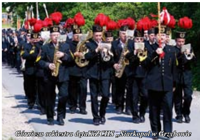
Górnicza orkiestra dęta KiZCHS „Siarkopol” w Grzybowie