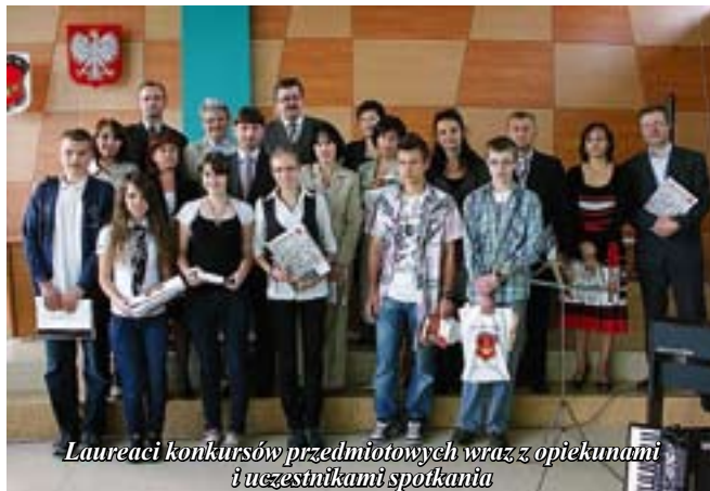
Laureaci konkursów przedmiotowych wraz z opiekunami i uczestnikami spotkania