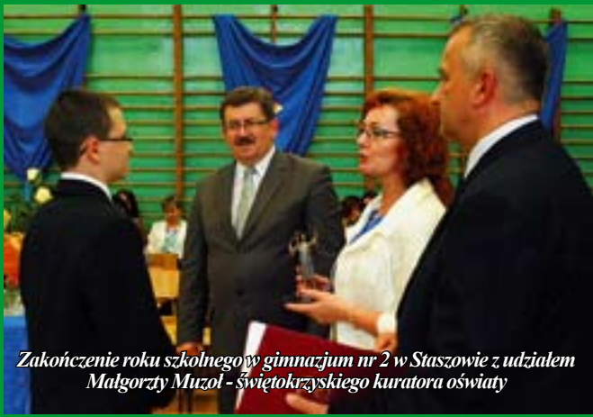
Zakończenie roku szkolnego w gimnazjum nr 2 w Staszowie z udziałem Małgorzaty Muzol - świętokrzyskiego kuratora oświaty