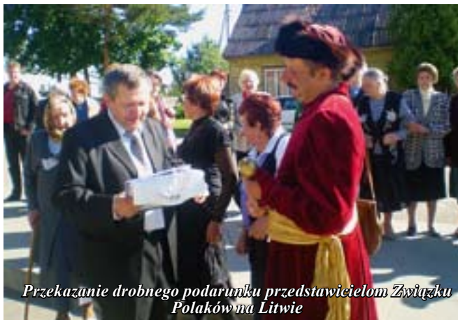
Przekazanie drobnego podarunku przedstawicielom Związku Polaków na Litwie

Po mszy wszystkie zespoły prowadzone przez staszowskich rycerzy z chorągwiami z polskimi orłami i herbem