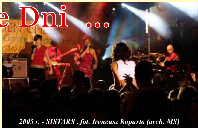
2005 r. - SISTARS

Od 2005 roku Dni Chleba połączone są z dożynkami miejsko-gminnymi, co wzbogaca program o m.in. konkurs wieńców dożynkowych i rozstrzygnięcie konkursu na najpiękniejszą zagrodę.