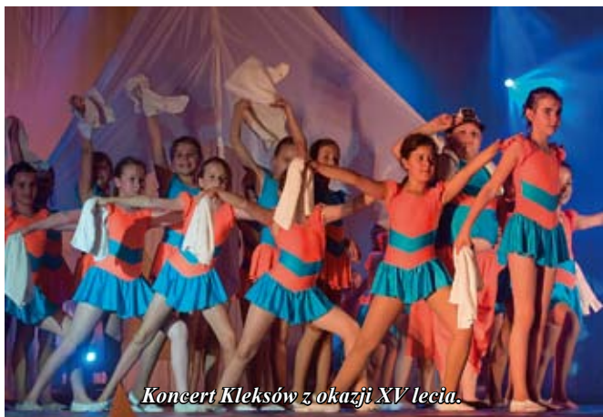
Koncert Kleksów z okazji XV lecia.