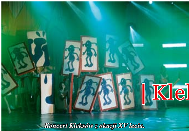
Koncert Kleksów z okazji XV lecia.