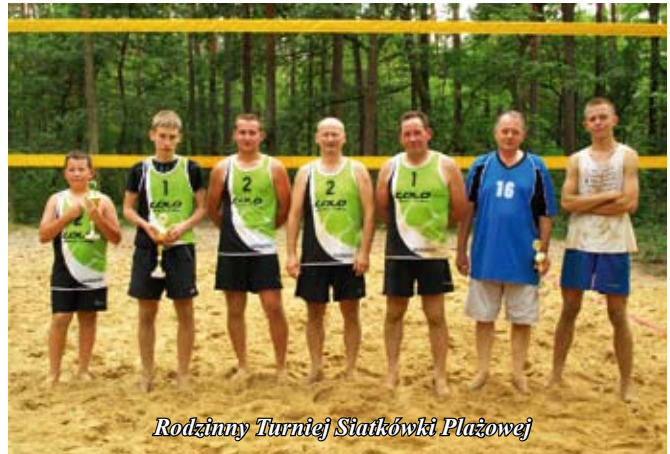
Rodzinny Turniej Siatkówki Piłkowej