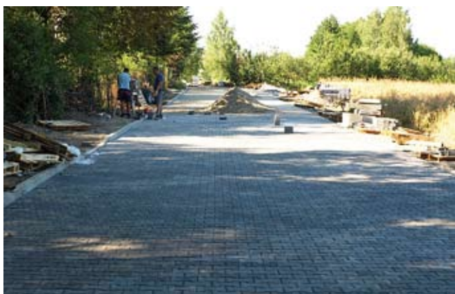
Przebudowa drogi gminnej w Sielcu

Zadanie polega na przebudowie odcinka drogi o długości 1750 m oraz uzupełnienie poboczy i zjazdów kruszywem. Inwestycja realizowana wspólnie z Nadleśnictwem Staszów (dofinansowanie w wysokości ok. 200 000,00 zł)