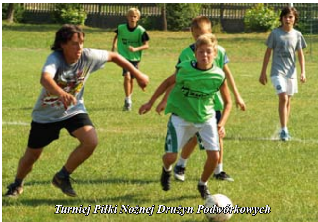
Turniej Piłki Nożnej Drużyn Podwórkowych

II Golejowski Cross Rowerowy. Wzięło w nim udział 20 zawodników. Najwięcej miłośników dwóch kółek było ze Staszowa, ale na imprezie pojawili się również goście z Radomia i Stalowej Woli. Organizatorem wyścigu był OSiR w Staszowie przy wsparciu Urzędu Miasta i Gminy w Staszowie. Szczególne