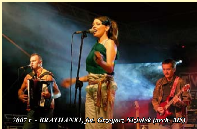
2007 r. - BRATHANKI, fot. Grzegorz Nizialek (arch. MS)