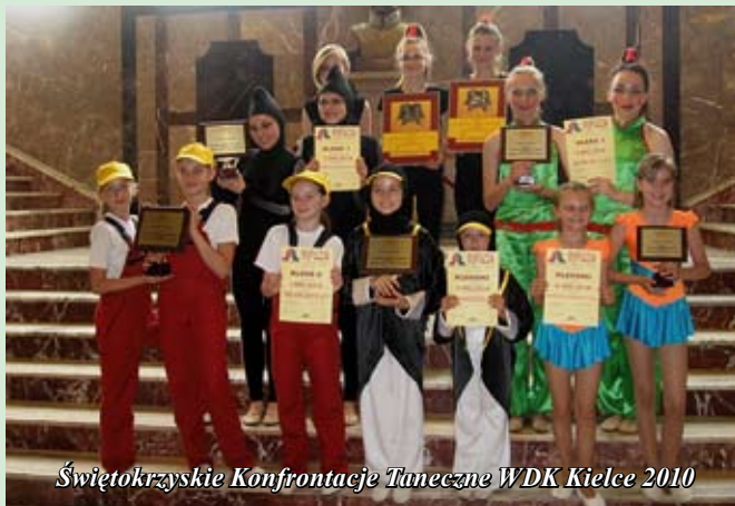
Świętokrzyskie Konfrontacje Taneczne WDK Kielce 2010