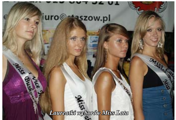
Laureatki wyborów Miss Lata

Turyści byli z różnych zakątków Polski m. in. Krakowa,