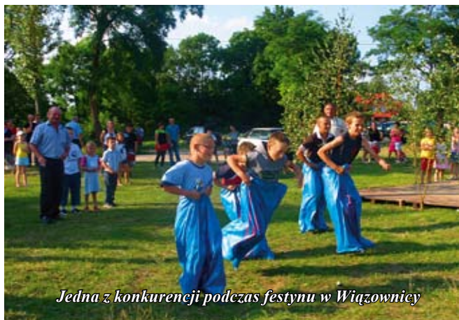
Jedna z konkurencji podczas festynu w Wiązownicy

W dniu 15.08.2010 r., także w ramach Ogólnopolskiej Kampanii „Postaw na Rodzinę” w Wólce Żabnej odbyło się