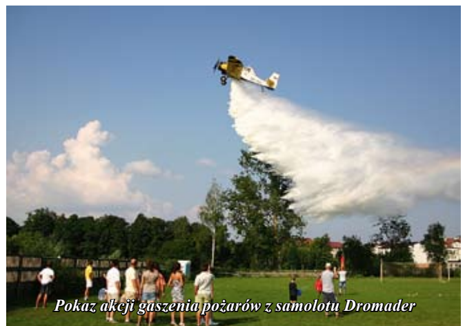
Pokaz akcji gaszenia pożarów z samolotu Dromader