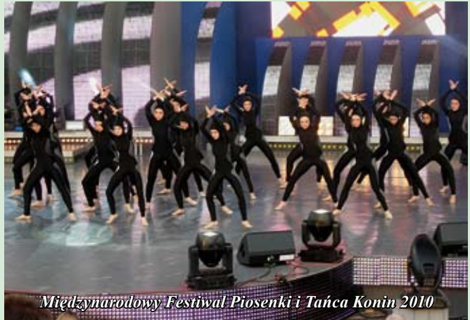
Międzynarodowy Festiwal Piosenki i Tańca Konin 2010