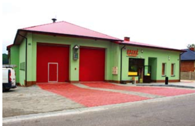
Zagospodarowanie terenu wokół strażnicy w Wiśniowej - IV etap

Zadanie wykonane w ramach partnerstwa publiczno - prywatnego. W ramach zadania wykonano drogę gminną na odcinku dł. ok. 254,00 m, szerokości 5-6 m z kostki betonowej.