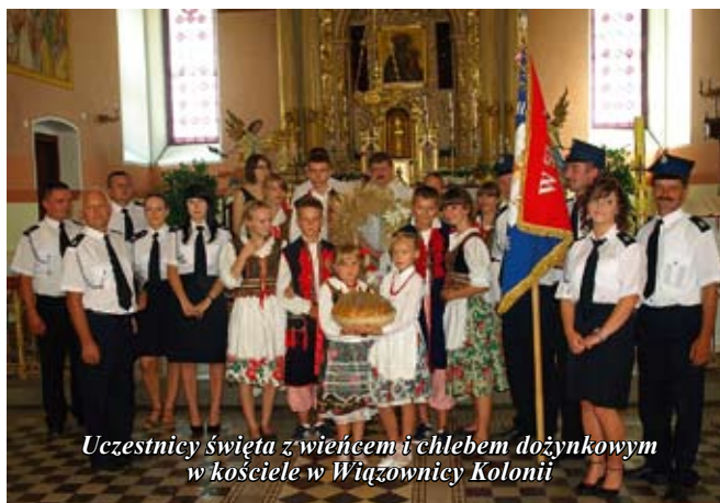
Uczestnicy święta z wieńcem i chlebem dożynkowym w kościele w Wiązownicy Kolonii