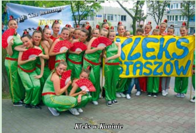
Kleks w Koninie