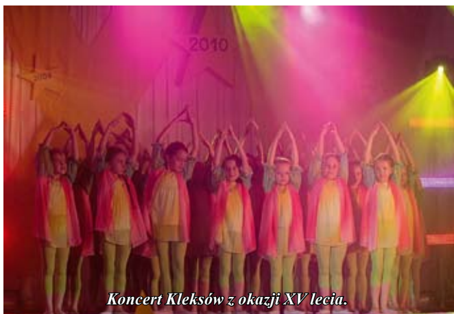
Koncert Kleksów z okazji XV lecia.