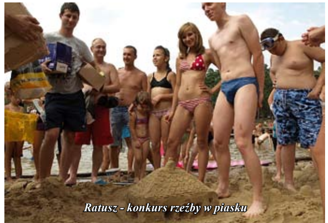
Ratusz - konkurs rzeźby w piasku