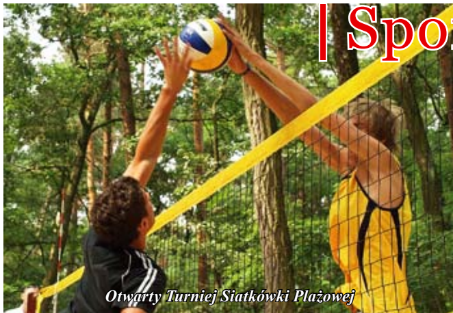
Otwarty Turniej Siatkówki Plażowej

Jak co roku Ośrodek Sportu i Rekreacji w Staszowie organizował cykl imprez i zabaw sportowych pn. „Sportowe Lato 2010”, przeznaczonych głównie dla dzieci i młodzieży, które spędzały wakacje w mieście. Celem akcji było propagowanie sportu i stworzenie możliwości aktywnego i bezpiecznego spędzania wolnego czasu.