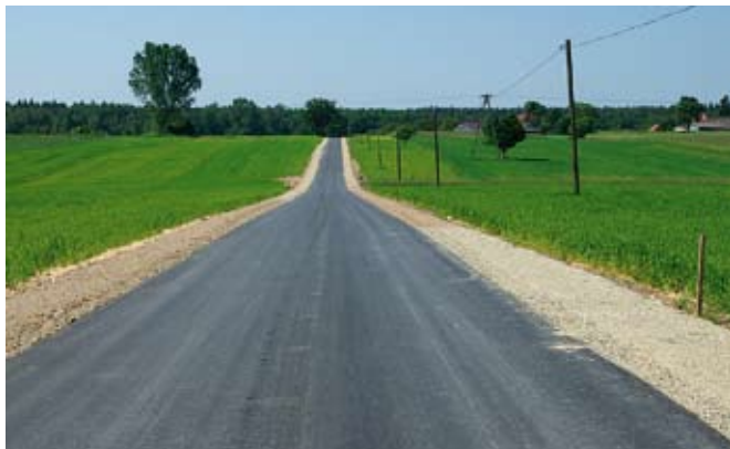
Przebudowa dróg w Wiśniowej

Wartość zadania 1 248 790,43 zł + nadzór inw. (15 000 zł)