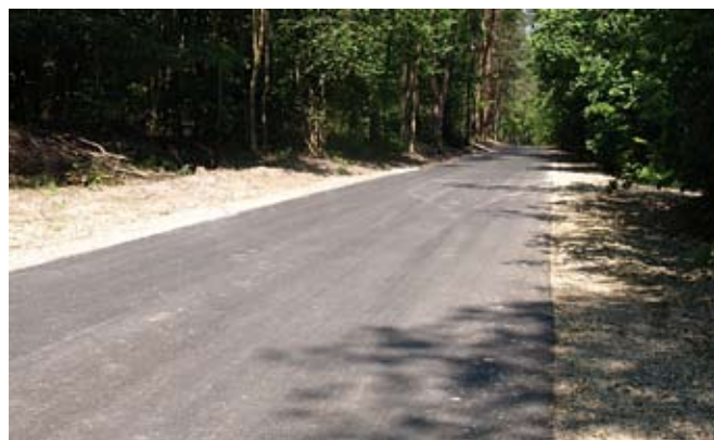
Odbudowa drogi gminnej Mostki - Poddębowiec na odcinku 0+500 km do 2+250 km

Zadanie dofinansowane ze środków EFRR w ramach działania 3.2. - Rozwój systemów lokalnej infrastruktury komunikacyjnej Osi priorytetowej 3 Regionalnego Programu Operacyjnego Województwa Świętokrzyskiego na lata 2007 - 2013. Wysokość dofinansowania: 762 666,20 zł