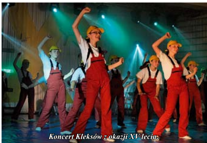
Koncert Kleksów z okazji XV lecia.

Tak dużej publiczności sala Zespołu Szkół Mechanicznych w Staszowie jeszcze nie gościła. Kilkaset osób, śledzących z zapartym tchem widowisko z okazji XV rocznicy Zespołów Artystycznych Kleks szczerze wypełniało jej wnętrze. Mimo ogromnego upału i gorących rytmów, w jakich tańczyli młodzi artyści, niemal wszyscy wytrwali do samego końca.