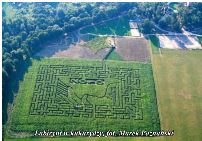
Labirynt w kukurydzy

W ramach projektu „Świętokrzyskie czaruje Chopinem” 15 sierpnia odbył się konkurs florystyczny pn.: „Zainspirowani Chopinem”. Uczestnicy konkursu mieli do