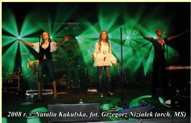
2008 r. - Natalia Kukulska