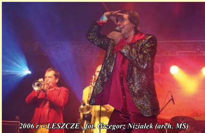
2006 r. - LESZCZE