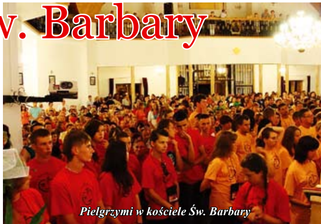
Pielgrzymi w kościele Św. Barbary