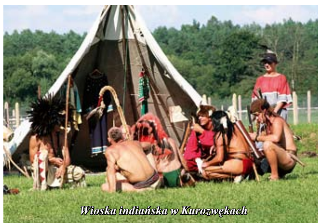
Wioska indiańska w Kurozwiękach