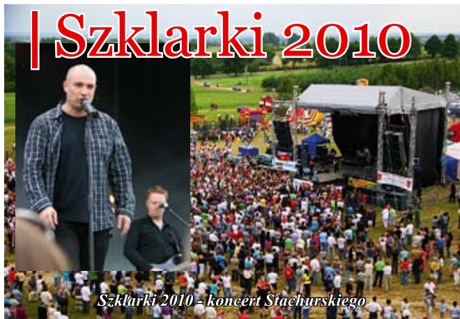
Szklarki 2010 - koncert Stachurskiego

„Szklarki” i „Świątokrzyska ścieżka huculska” rozpoczęły sezon wakacyjny w naszej gminie.