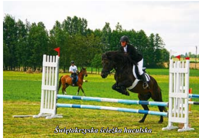
Świątokrzyska ścieżka huculska

Natomiast przy nieodległym „domu z bali”, w niedzielę, Orkiestra Dęta Hut Szkła Gospodarczego uroczystie rozpoczęła piątą edycję „Szklarek”. Tutaj też wystąpiły zespoły