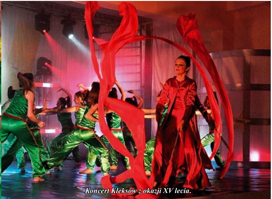
Koncert Kleksów z okazji XV lecia.