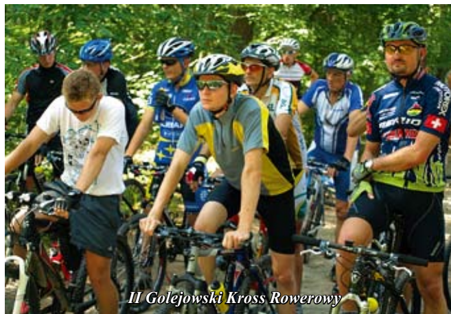
II Golejowski Cross Rowerowy

Dwa turnieje siatkówki plażowej odbyły się w piątek - 30 lipca, na boiskach przy Ośrodku Wypoczynkowym „Wilga” w Golejowie. O godzinie 9.00, osiem par w kategorii kadet tj. rocznik 1993 i młodszy, rozpoczęło rywalizację w Młodzieżowym Turnieju Siatkówki Plażowej. Zawodnicy przyjechali m.in.