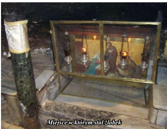
Miejsce w którym stał Jobek