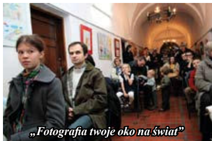
„Fotografia twoje oko na świat”