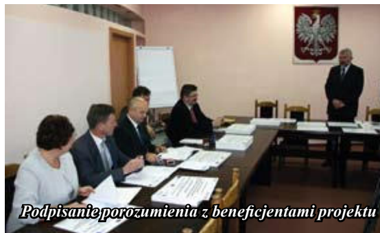
Podpisanie porozumienia z beneficjentami projektu

W ramach projektu do wszystkich podstawówek i gimnazjów w pięciu gminach trafiły tablice multimedialne, a jeszcze w tym roku po dwóch nauczycieli z każdej szkoły wyjedzie na specjalne szkolenie do Finlandii, kraju będącego liderem w edukacji. Poza tym, pedagodzy uczący w szkołach biorących udział w projekcie, odbędą szkolenia na platformie e-learningowej,