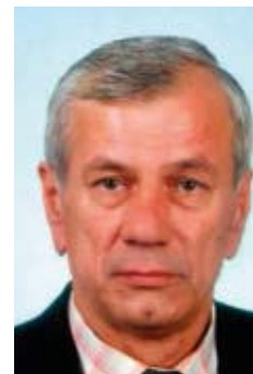
Damian Sierant Przewodniczący Rady Powiatu Staszowskiego