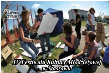
IV Festiwalu Kultury Młodzieżowej w Staszowie