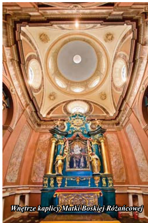
Wnętrze kaplicy Matki Boskiej Różańcowej