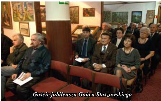
Goście jubileuszu Gońca Staszowskiego