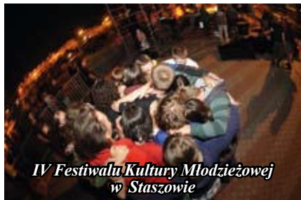
IV Festiwalu Kultury Młodzieżowej w Staszowie