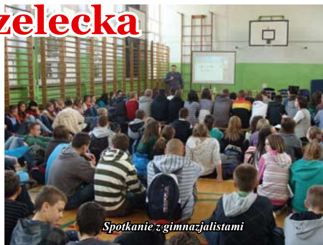
Spotkanie z gimnazjalistami

Aby gimnazjalista zapoznał się z mundurem Stowarzyszenie Polskie Drużyny Strzeleckie działające przy Staszow-