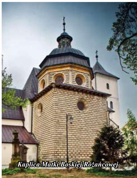
Kaplica Matki Boskiej Różańcowej