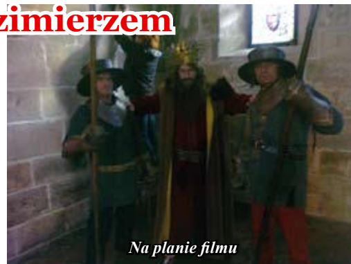
Na planie filmu

dal pomieszczenia typowo filmowa gastronomia a więc kanapki z żółtym serem i szynką, kawa, herbata, soki, woda mineralna, pepsi-cola, owoce, pączki i słodkie bułki. Do oporu. W sali przyćmione światła, dymy i szyny ustawione w kształcie podkowy wzdłuż całego pomieszczenia. Po kilkunastu minutach przygotowań reżyser krzyknął: „klaps” „cisza” i filmowa machina ruszyła. W scenie brali udział król Kazimierz Wielki, jego dworzani, dwóch kupców włoskich i my dwaj strażnicy. Początkowo kręcono ujęcia z kamery ustawionej na szynach z dołu, potem również z szyn zna wprost, potem zbliżenia wszystko to uzupełniane jakimiś „setkami”, pięćdziesiątkami „i innymi niezrozumiałymi dla nas określeniami. Kto nie brał udziału w kręceniu filmu z pewnością nie wie jak to trudne a przede wszystkim długie i żmudne zajęcie. Każdą scenę powtarzano ze 30 razy!!! A to z powodu skrzypiącego wózka a to z powodu kota, który wlaź na parapet, a to na skutek chrząknięcia operatora czy przejęzyczenia aktorów. W trakcie filmu reżyser kilkakrotnie zmieniał koncepcje ujęć, coś dodawał, wycinał, wydłużał lub skracał. 5 godzinny maraton został przetrwany jedynie 4 minutową przerwą na papierosa i łyk wody mineralnej i dokładnie po 4 minutach wszyscy punktualnie byli już na planie. Na koniec reżyser podziękował wszystkim, również nam współczując 5 godzinnego grania w 25 kilogramowych zbrojach. Po