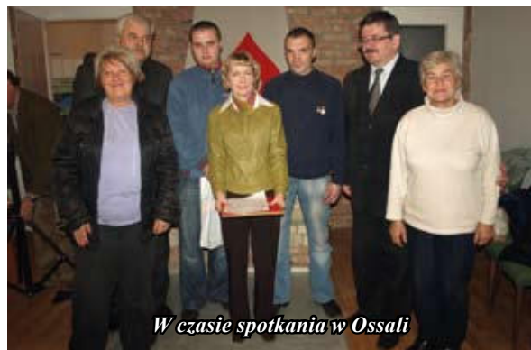
W czasie spotkania w Ossali

Wszystkie osoby zainteresowane tą piękną ideą zapraszamy w godzinach porannych do Punktu Krwiodawstwa w Staszowie – Przychodnia na ul. Wschodniej III piętro