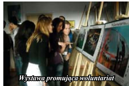
Wystawa promująca wolontariat