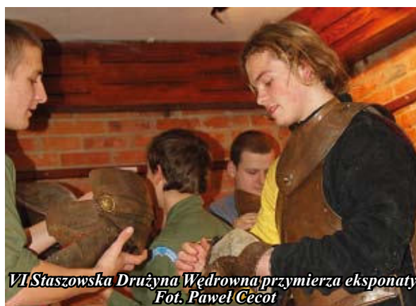
VI Staszowska Drużyna Wędrowną przymierza eksponaty.

z mieczem. To niepowtarzalna możliwość wczucia się w rolę prawdziwego rycerza. ” Wystawa jest podsumowaniem obchodów 600-lecia bitwy pod Grunwaldem staszowskich rycerzy, którzy w mijającym roku brali udział