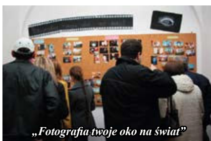
„Fotografia twoje oko na świat”