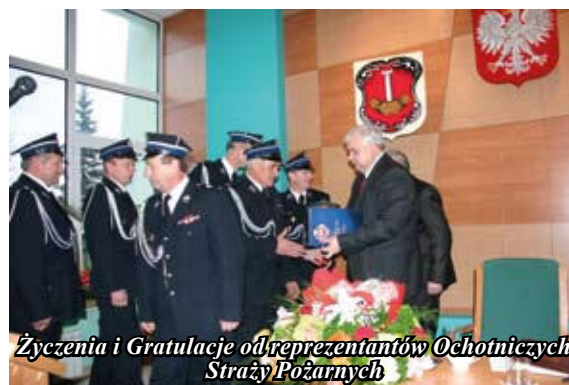
Życzenia i Gratulacje od reprezentantów Ochotniczych Straży Pożarnych