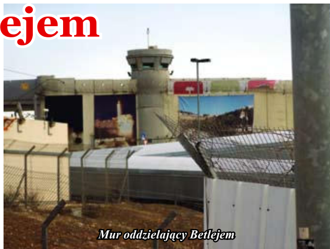
Mur oddzielający Betlejem

Wewnątrz otwiera się pięcionawowa świątynia z zachowanymi w podłodze mozaikami o zawilum wzorze geometrycznym i subtelnym kolorach pochodzącymi z pierwszej świątyni oraz rzędem kolumn betlejemskich po prawej i lewej stronie. To co rzuca nam się w oczy to brak ławek i krzeseł oraz bardzo duża ilość lamp charakterystycznych dla kościołów prawosławnych. W bazylice można się pogubić. I to bynajmniej nie z powodu jej wielkości, ale raczej panujących tu podziałów. Tak jak Bazylika Grobu Pańskiego w Jerozolimie, tak i świątynia stojąca nad grota, w której Jezus przyszedł na świat, podzielona jest pomiędzy grecki Kościół prawosławny, Kościół ormiański i Kościół rzymskokatolicki. Do katolików należy część schodów wiodąca do Groty Narodzenia, jej dwie ściany, fragment posadzki i miejsce, gdzie znajdował się żłóbek. Stajemy w kolejce, aby zejść do Groty Narodzenia. Wreszcie po wąskich schodkach schodzimy do miejsca narodzin Jezusa. Każdy chce je dotknąć a niektórzy pocałować. Naprzeciw znajduje się wnęka w której miał stać żłóbek. Po wyjściu z groty wchodzimy do kościoła św. Katarzyny. Sto lat temu katolicy wzniesli go obok bazyliki. Tam najczęściej pielgrzymi uczestniczą we Mszy św. Tam też katolicki