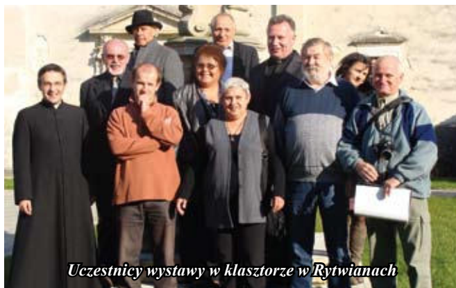
Uczestnicy wystawy w klasztorze w Rytwianach