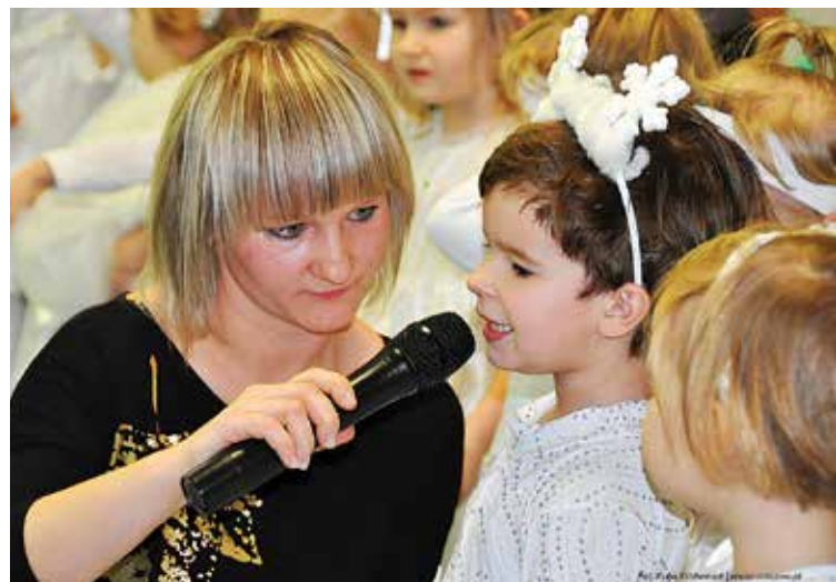
Przedszkole Nr 8