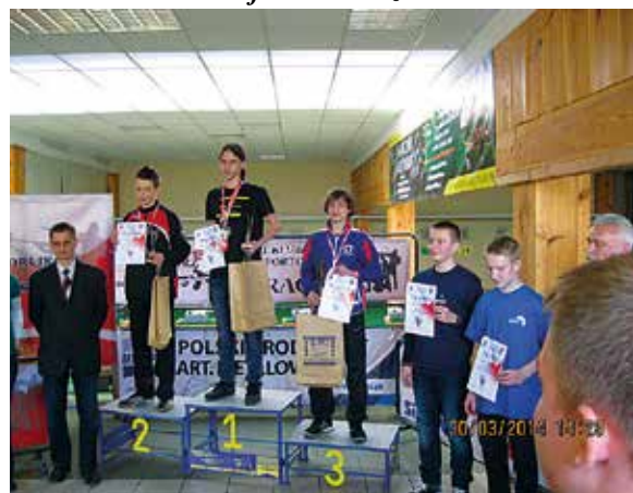
Kuba na 1 miejscu podium