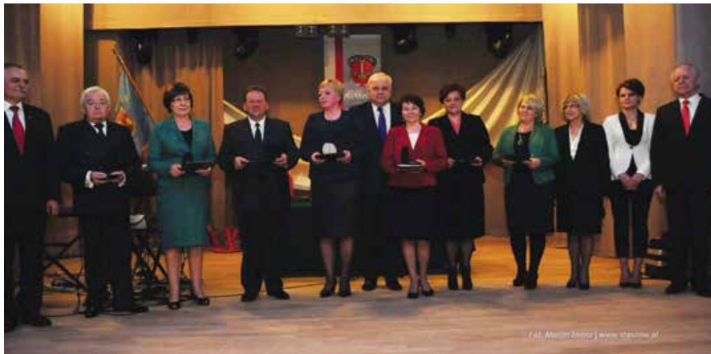
Dekoracja zasłużonych dla Staszowa

Dzisiaj nie zapominamy także o ofiarach katastrofy pod Smoleńskiem, o 96 Polakach na czele ze św. pamięci