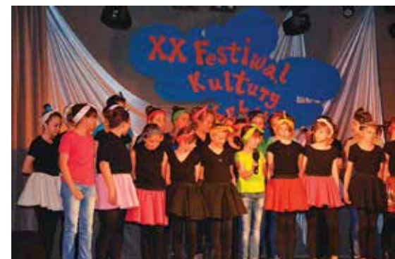
XX Festiwal Kultury Szkół