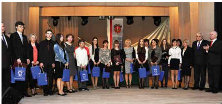
Laureaci konkursów przedmiotowych otrzymali gratulacje od władz miejskich Staszowa