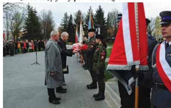
Delegacja Rady Miejskiej w Staszowie