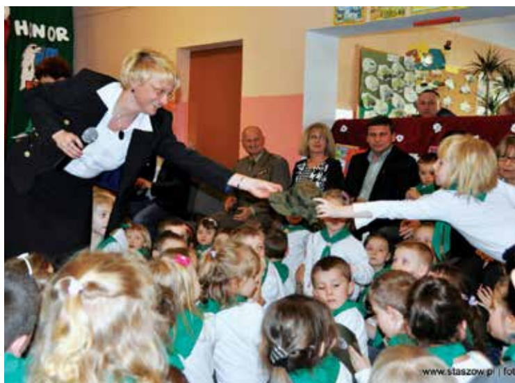
Wiceminister Beata Oczkiewicz