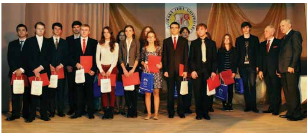
Laureaci konkursu Arystoteles Senior