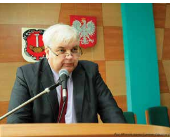
Burmistrz Romuald Garczewski