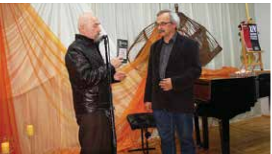
XIV światowy dzień poezji