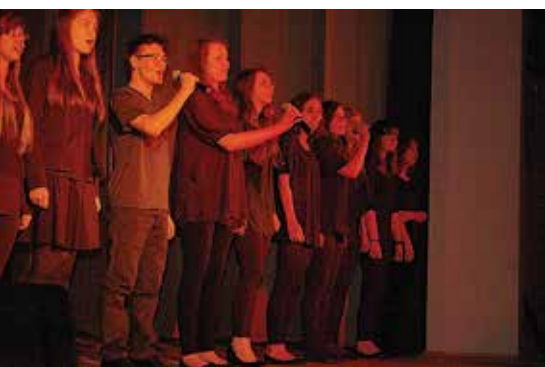
Spektakl „Kocham cię życie”