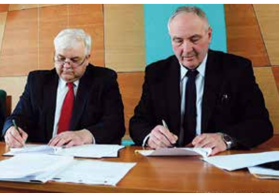
Podpisanie umowy na dofinansowanie pierwszego etapu budowy Staszowskiego Obszaru Gospodarczego w ramach projektu „Utworzenie kompleksowych terenów inwestycyjnych w ramach Staszowskiego Obszaru Gospodarczego – Strefa A”.