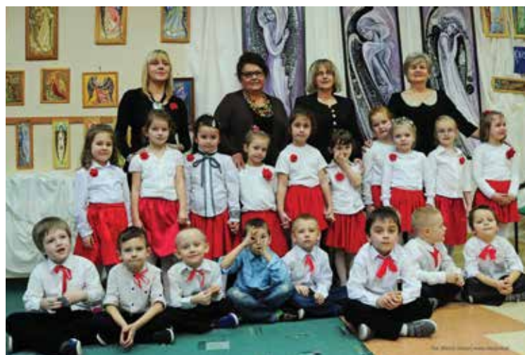
Przedszkole Nr 3 w Staszowie