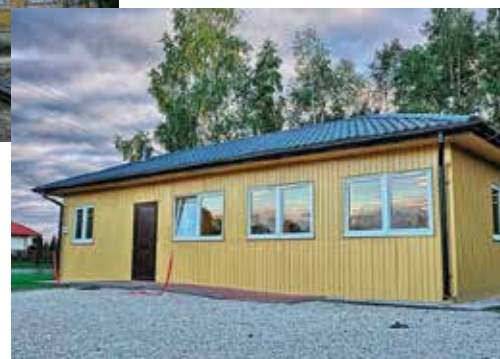
W Krzywołęczy skromny fundusz sołecki pomógł w zbudowaniu świetlicy wiejskiej