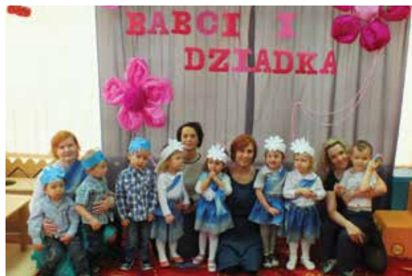
Klub Dziecięcy „Wesoły Pajacyk”