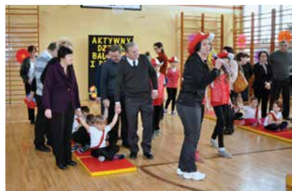
Przedszkole Nr 4