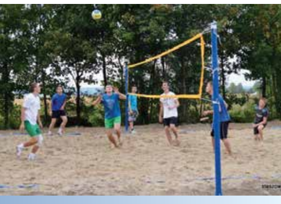
W Wiązownicy Dużej pieniądze z funduszu przeznaczone na zagospodarowanie terenu wokół centrum sportowego i strażnicy OSP.

Małe budżety obywatelskie w każdym sołectwie po raz pierwszy zostały roz-