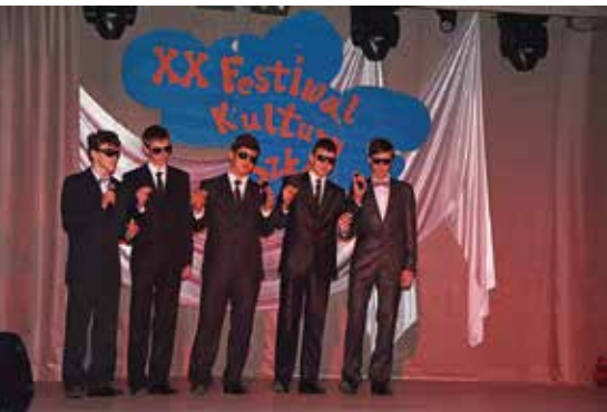
XX Festiwal Kultury Szkół