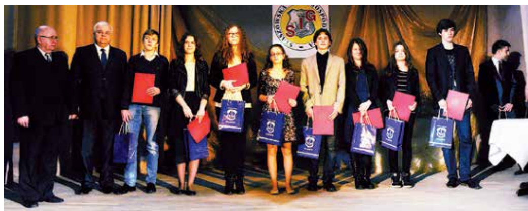
Laureaci konkursu Arystoteles Junior