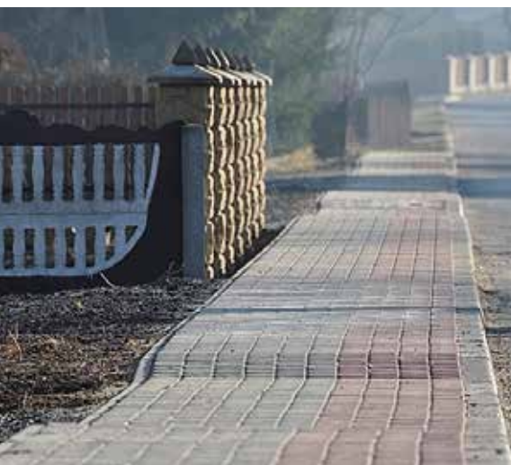
W Smerdynie w ramach budżetu obywatelskiego wykonano między innymi chodnik.

dyponowane w 2011 roku. Każdego roku kwota funduszu wzrasta. W 2014 roku wynosi ona ponad 432 tysiące złotych. Dzieląc powyższe przez liczbę sołectw daje średnią ponad 12 tysięcy złotych rocznie do wykorzystania na każde sołectwo. W praktyce pieniądze dzielone są według ilości mieszkańców. Najliczniejsze sołectwa zyskują najwięcej. W mniej licznych fundusz jest skromniejszy. Na więcej nie pozwalają przepisy ustawy, które ściśle określają algorytm naliczania funduszu. Niemniej jednak, kilkuletnie doświadczenie pokazuje, że budżet obywatelski, nawet w skromnej postaci, sprzyja integracji mieszkańców i wywołuje dodatkową aktywność.