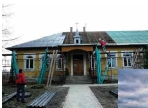
W Oględowie mieszkańcy przeznaczyli pieniądze z funduszu na remont świetlicy

zamontować kilka nowych elementów na placu zabaw przy świetlicy czy kupić kostkę betonową. Sołtys żałuje, że pieniędzy nie jest dwa razy więcej, bo mimo skromnej liczby mieszkańców, potrzeby w Krzywołęczy są duże. Ze zdaniem sołtysa zgadza się zastępca burmistrza Tomasz Fąfara . - Przepisy prawne narzucają gminom zasady naliczania funduszu sołeckiego. W praktyce liczniejsze sołectwa korzystają bardziej, ale nie jest to do końca sprawiedliwy sposób. Bywa tak, że w mniejszych sołectwach, w wyniku różnych uwarunkowań potrzeby są znacznie większe niż w sołectwach ościennych.