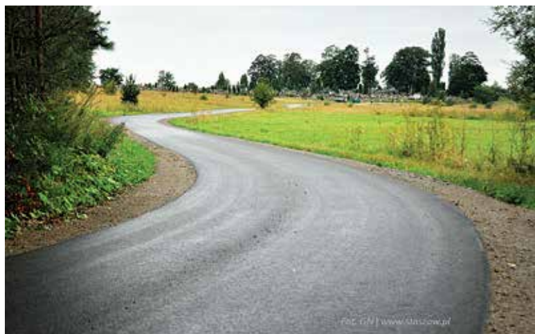
W ramach zdobytych środków będzie m.in. odbudowana dalsza część ul. Na Kępie