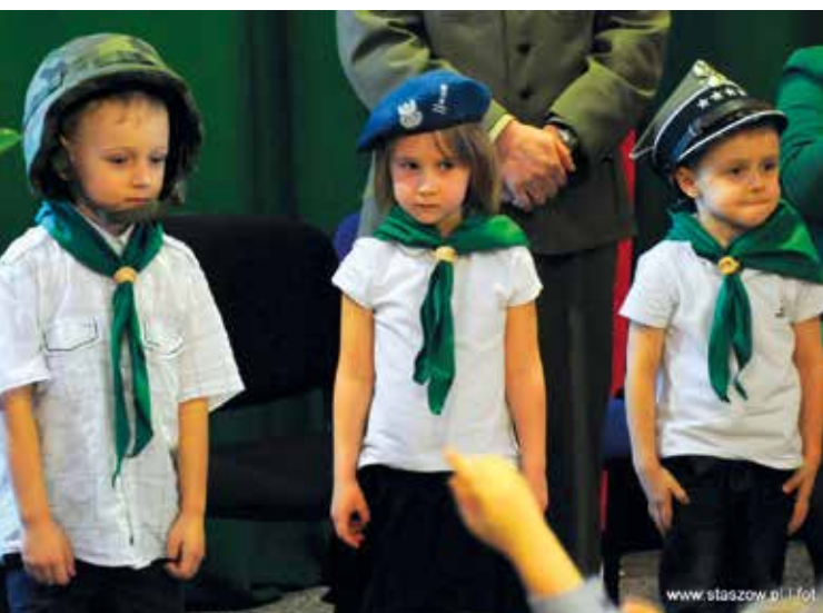
Zuchy miały możliwość przymiarki elementów umundurowania Wojska Polskiego