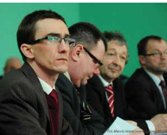
Radni Rady Miejskiej