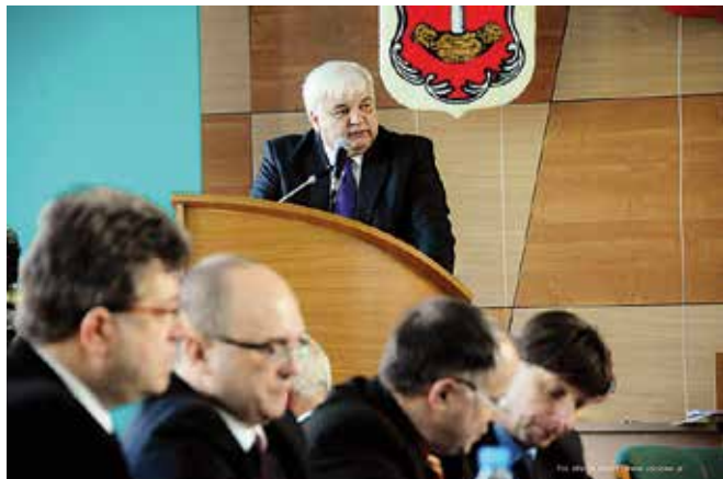
Burmistrz Romuald Garczewski