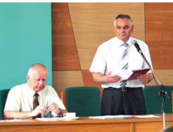
Prezidium Rady Miejskiej