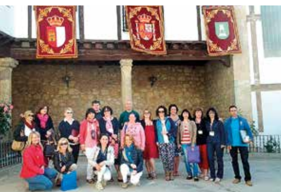
Dwójka w Hiszpanii