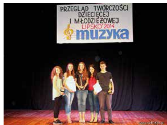
Rytm w Lipsku