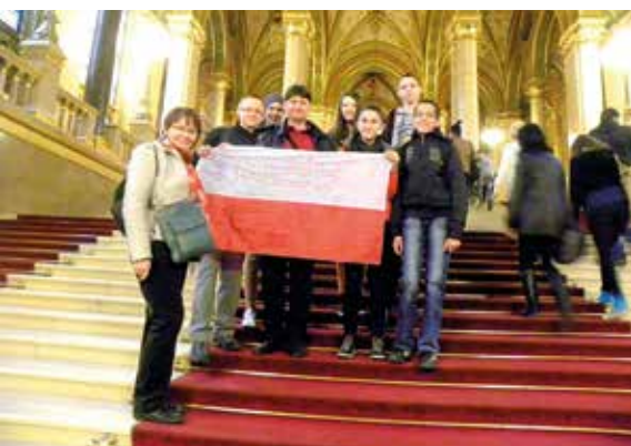
„Dwójka” na Węgrzech