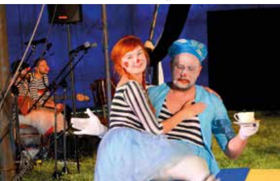
Spektakl Pippi - Pończoszanka