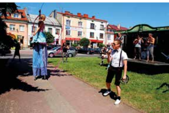
Koncert „Bura Kura”