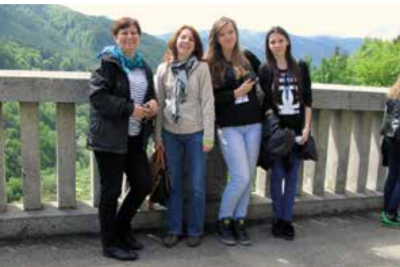
Jedyńka w Rumunii