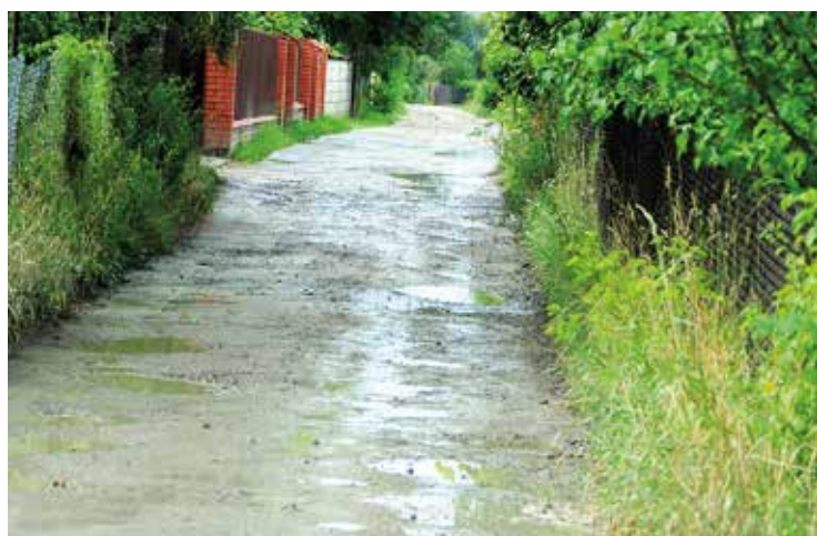
Wkrótce ruszy odbudowa ul. Leśnej w Staszowie