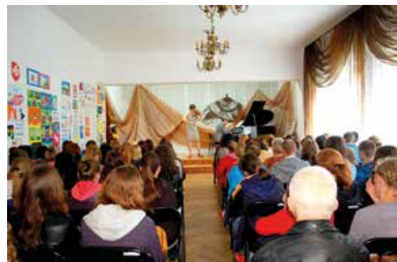
Koncert Edukacyjny Filharmonii