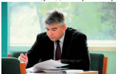
Z-ca burmistrza Tomasz Fajfara