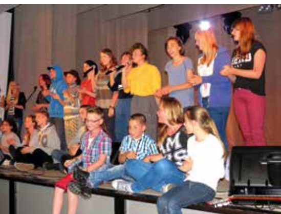
Zakończenie roku artystycznego

grupowo – dziewczyny połączyły siły, tworząc Zespół Wokalny i zdobyły nagrodę specjalną w postaci lekcji śpiewu dla każdej wokalistki w Krakowskim Instytucie Sztuki Wokalnej, nasz zespół został również zaproszony do udziału w Koncercie Galowym. Nagrodzonym serdecznie gratulujemy i życzymy dalszych sukcesów.