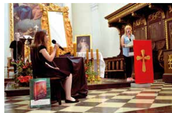
Sekcja Teatralna na Świętym Krzyżu