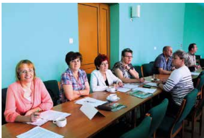
Sołtysi na sesji Rady Miejskiej