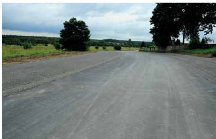
Staszów, ul. Na Kępie II etap