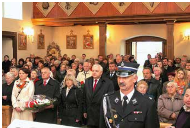
Msza św. w Wiśniowej z udziałem władz samorządowych