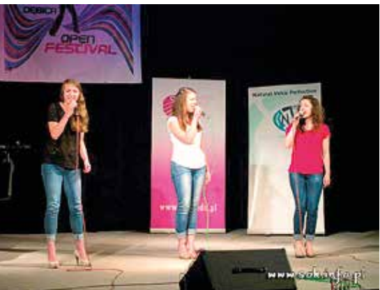
Rytm w Dębicy