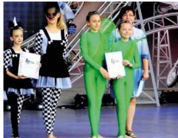
„Kleks II” (zielone stroje) podczas Gali Finałowej wytańczyły w Koninie „Aplauz Wyróżnienie”.