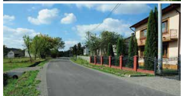
Droga powiatowa Niemście - Ponik została przebudowana na odcinku ponad 1,2 kilometra.

Gmina Staszów przekazała powiatowi staszowskiemu wsparcie finansowe w wysokości 54 tysięcy złotych.