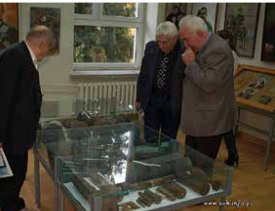
Otwarcie Muzeum Ziemi Staszowskiej