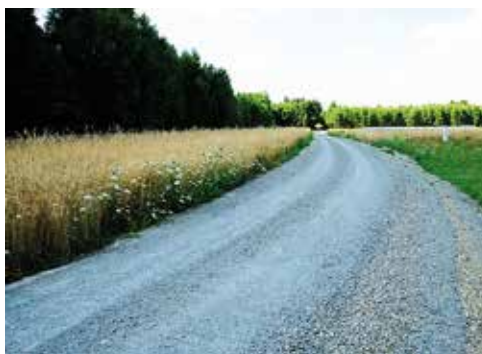
Wiązownica Duża - Granicznik