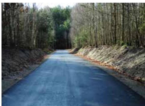
Dobra - Pociuszka

Investycje drogowe na terenie gminy Staszów nie ograniczają się tylko do poprawy infrastruktury na drogach gminnych. W bieżącym roku Gmina Staszów w istotny sposób wspiera realizację inwestycji drogowych na drogach powiatowych zlokalizowanych na terenie Staszowa i okolic. Na realizację tych inwestycji samorząd gminy przekazał powiatowi staszowskiemu ponad pół miliona złotych.