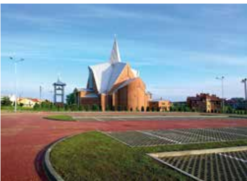
Parking przy ul. Mickiewicza