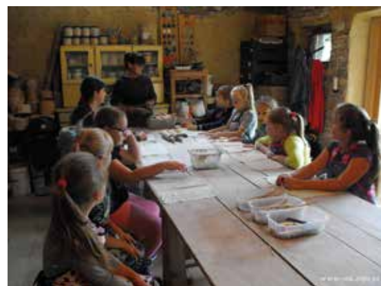
Sekcja plastyczna w Kapkazach