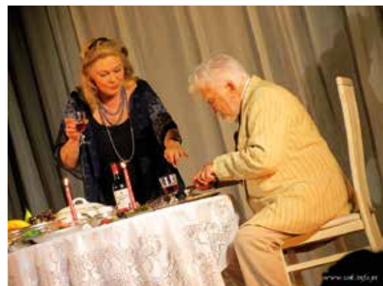
Ostatnia miłość - spektakl