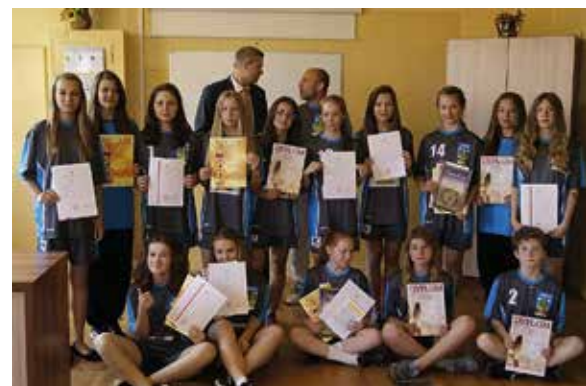
Dziewczęta OSPR Staszów