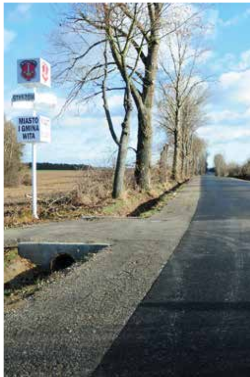
Przebudowa dróg w Kurozwałkach