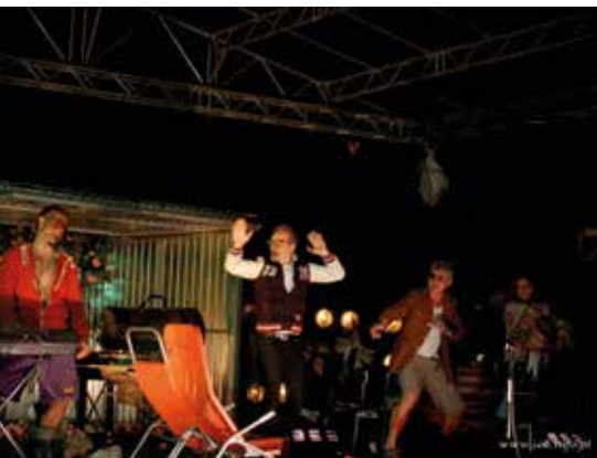
Jasiu albo polish joke spektakl

Minione miesiące były dla Staszowskiego Ośrodka Kultury okresem wielu sukcesów i czasem wytężonej pracy. Jak zwykle nasza oferta obfitowała w wydarzenia kulturalne na najwyższym poziomie. Wszystkie działania zostały zauważone i z przyjemnością przyjmowane przez mieszkańców Powiatu Staszowskiego i nie tylko.