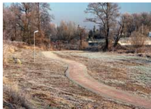
Łącznik ul. Ogłędowska z zalewem „Nad Czarną”