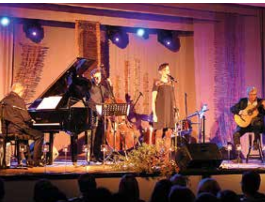
Wieczór w kolorach jesieni