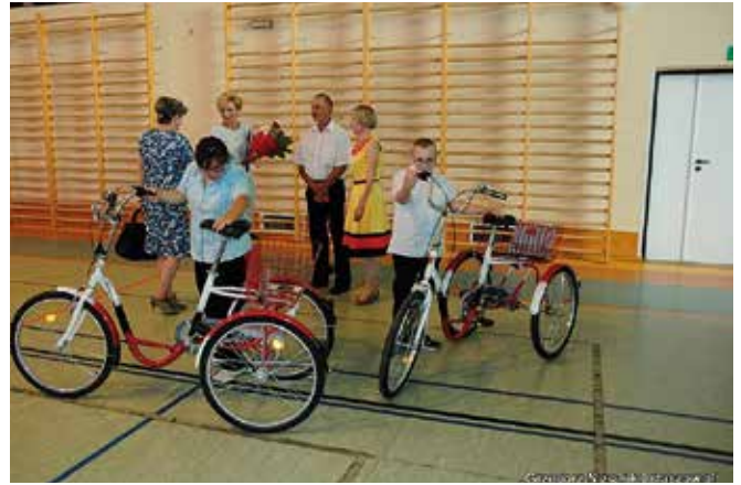
Przekazanie rowerów dla niepełnosprawnych uczniów PSP Nr 3