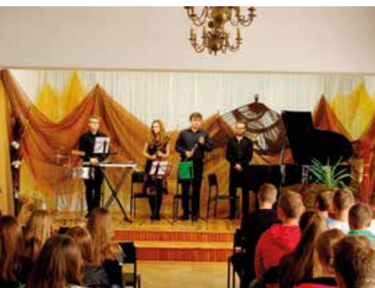
Koncert Filharmonii Świętokrzyskiej