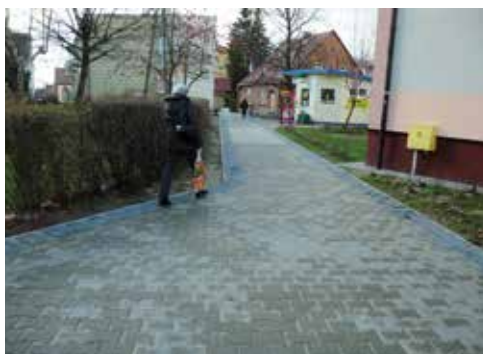
Rajska - Kościelna