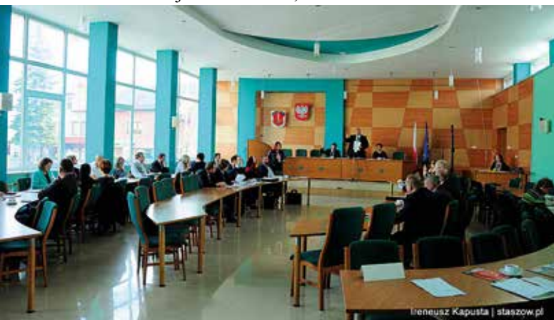
Sala obrad Rady Miejskiej