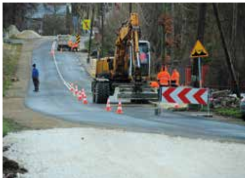
Przebudowa dróg w Kurozwałkach