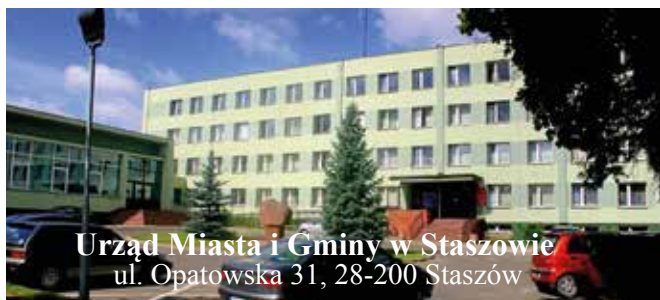
Urząd Miasta i Gminy w Staszowie ul. Opatowska 31, 28-200 Staszów