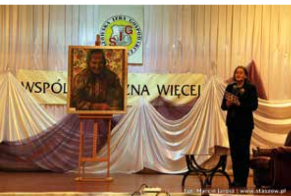
Licytacja prac lokalnych artystów na rzecz programu „Arystoteles”

W sobotę, 12 marca, w auli Zespołu Szkół im. Stanisława Staszica w Staszowie po raz XIX spotkali się członkowie i sympatycy Staszowskiej Izby Gospodarczej. Galę uświetniło wręczenie nagród dla uzdolnionej młodzieży, a także nagród gospodarczych – Staszowskich Stambułek. Wśród laureatów znalazła się Gmina Staszów.