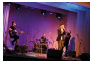
Koncert Łukasza Zagrobelnego