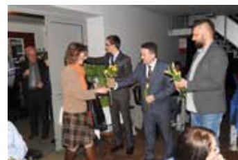
Dzień Kobiet w SOK