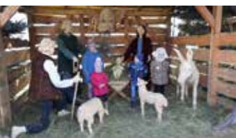
Szopka na staszowskim Rynku