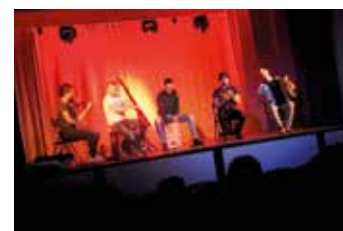
Filharmonia, koncert „Klezmafour”