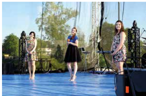
Dzień Dziecka w Staszowie