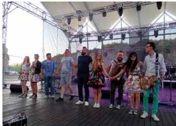
FOLK'n'ROLL na juwenaliach

Dzień Dziecka w Staszowie hucznie obchodzono w Parku „Zalew nad Czarna”. Słoneczna pogoda, radosne występy sceniczne, dobra muzyka oraz niezliczona ilość atrakcji spowodowały, że niedzielne popołudnie mieszkańcy chętnie spędzili z nami. Program obejmował m.in.: Gminny Festiwal Talentów Przedszkolnych o puchar Burmistrza Miasta i Gminy Staszów,