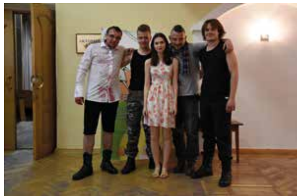
Teatr SYRENA SOK w Kijowie