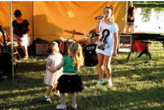
Dzień Dziecka w Staszowie