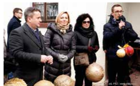
Wspólne ubieranie choinki w Rynku w Staszowie