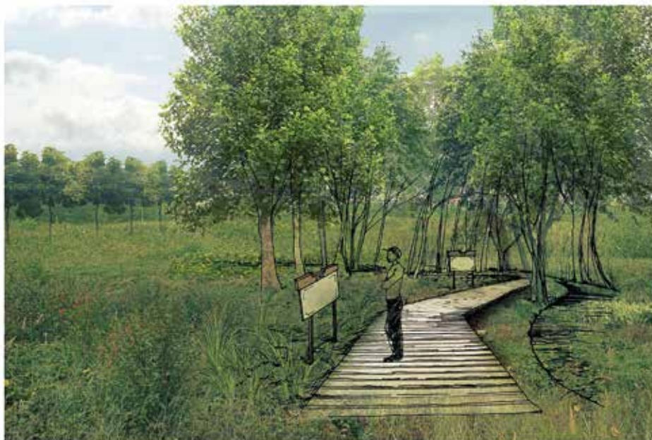
Projektowana ścieżka edukacyjna - przyrodnicza, wyposażona w tablice informacyjne. Nawierzchnia drewniana, wyniesiona ponad grunt rodzimy. Wokół łąki kwietne i obszary przyjazne zwierzętom - owadom, ptakom, małym ssakom.