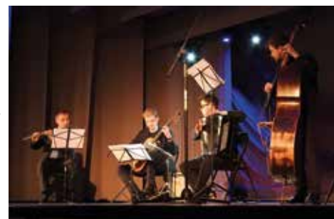
Qui pro quo - koncert edukacyjny muzyków Filharmonii Narodowej