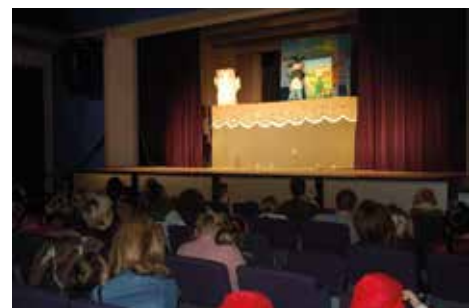
Przygody Janka i dziadka Mroza