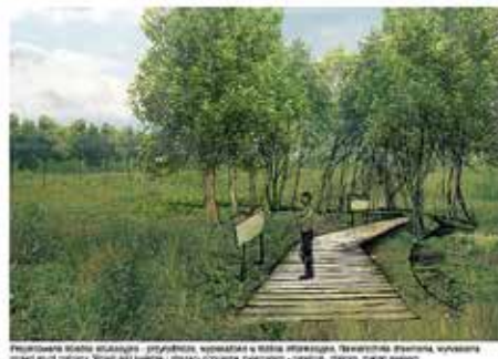
Projektowana siatka zielonizacji - przyrodniczej, spacerowej i rekreacyjnej. Terenowa siatka, wysoka jakość zieleni. Siatki i siatki w otoczeniu i siatki w otoczeniu.