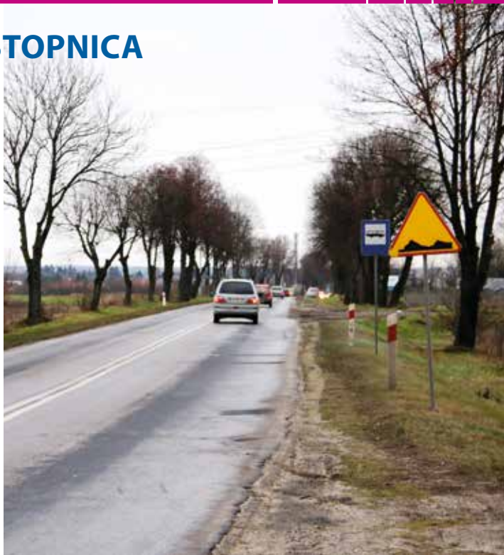
Obecny stan drogi wojewódzkiej na odcinku Staszów - Stopnica, pozostawia wiele do życzenia.

2 października br. radni miejscy podjęli uchwałę w sprawie wyrażenia zgody na udzielenie ww. pomocy finansowej. Wykonawca zadania został wyłoniony w drodze przetargu przeprowadzonego przez Województwo Świętokrzyskie. Przebudowę drogi wojewódzkiej nr 757 zrealizuje firma „Dylmex” ze Staszowa. Planowane prace mają zakończyć się 31 lipca 2018 roku. MK