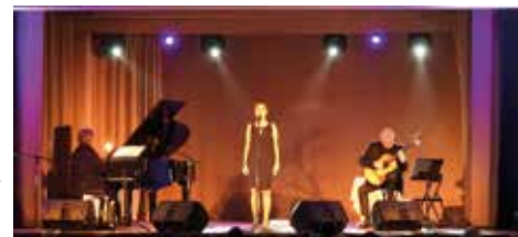
Koncert „Byle nie o miłości”