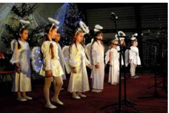
Przegląd kolęd i pastorałek