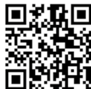
Nordic Walking II Bieg do Serca Kołłataja