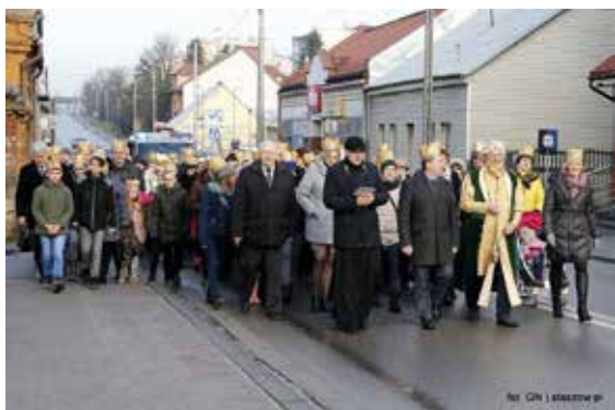
Orszak Trzech Króli