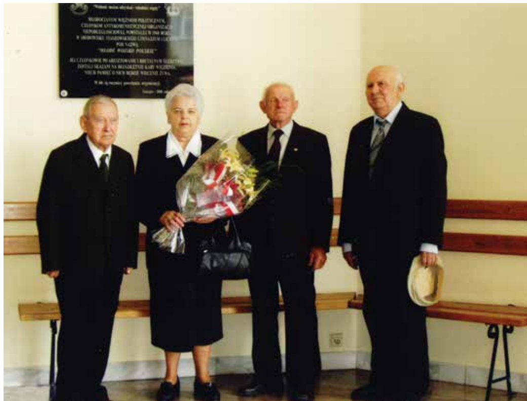
XXIII Spotkanie MWP, w dniu 13.07.2014 r. w Staszowie, przy tablicy pamiątkowej w kościele MBNP w Staszowie