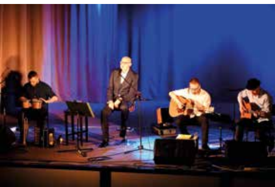
Dzień Kobiet. Mój ulubiony Młynarski - koncert Piotra Machalicy