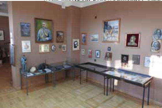
W stulecie odzyskania niepodległości przez Polskę