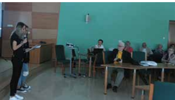
SPOTKANIE Z SENIORAMI