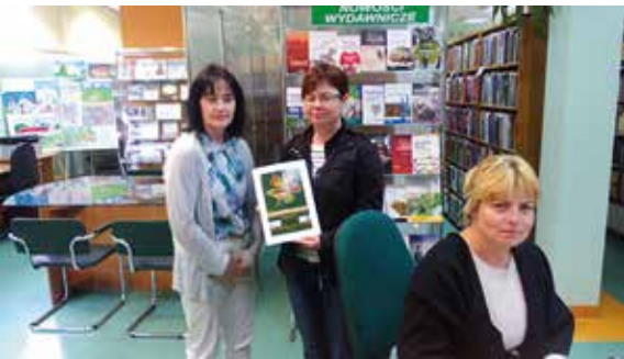
BIBLIOTEKA PEDAGOGICZNA W STASZOWIE

Dwa lata trwała realizacja programu Erasmus Plus „Mobilność kadry edukacji szkolnej” finansowanego przez PO WER w staszowskiej „Dwójce”, a w dniach 14-18 maja 2018 roku specjalnym wydarzeniem, które nazwano „Tydzień Języków”, podsumowano działania projektowe. Wszystkie te aktywności były dokumentowane na bieżąco na platformie eTwinning oraz szkolnej stronie internetowej. W czasie tych dwóch lat nauczyciele zespołu przeprowadzili wiele różnorodnych działań i aktywności zaplanowanych w Europejskim Planie Rozwoju Szkoły pt. „Nowoczesny nauczyciel europejskiej szkoły” wykorzystując wiedzę i umiejętności nabyte, m.in. podczas zagranicznych szkoleń