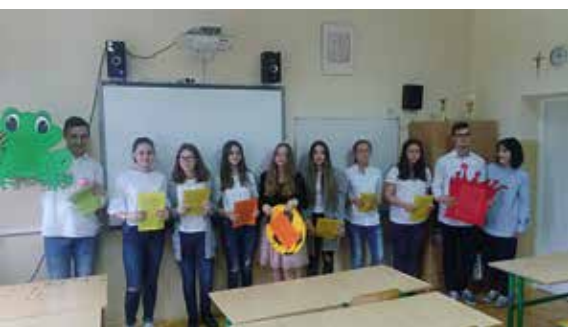
READER'S THEATRE W LICEUM