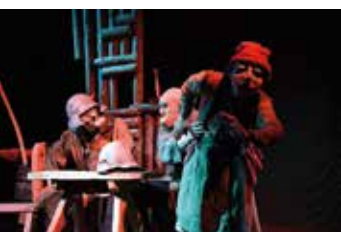
Teatr Polska - Karczma pod Białym Łabędziem