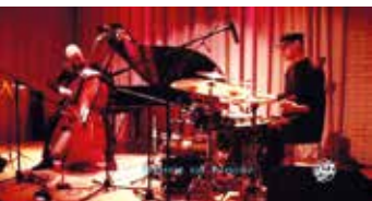
Polski Jazz 360 stopni