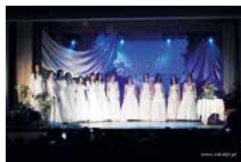
Inicjatywy Lokalne - Pokoleniowa panna młoda