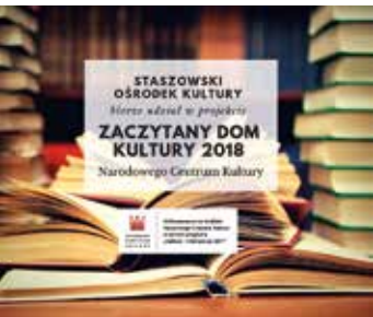
Zaczytany dom kultury