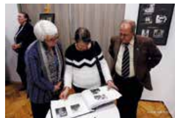
Inicjatywy Lokalne - Kronika - poznanie historii wioski Jasień