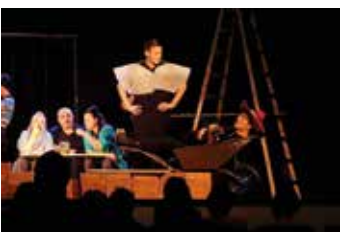
Teatr Polska - Tożsamość Wila