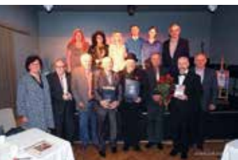
Festiwal Poezji Słowiańskiej