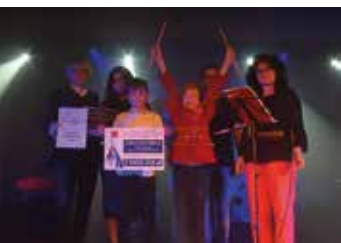
I Staszowski Festiwal Zespołów