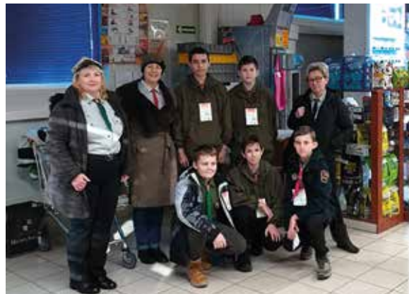
Wolontariusze z Drużyny Harcerskiej „Wataha II” działającej przy Zespole Placówek Oświatowych nr 1 w Staszowie