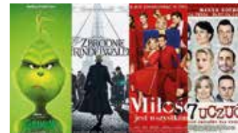
Dni z kinem

Pod takim tytułem w dniu 15 listopada odbyło się spotkanie zorganizowane w SOK przez Klub Inicjatyw Twórczych „Talent”. Wpisało się w cykl wydarzeń związanych z 100. rocznicą odzyskania niepodległości przez Polskę. Wszyscy jej uczestnicy pojawili się w biało-czerwonych strojach, niektórzy mieli kotyliony i wstążeczki w barwach narodowych. Nawet poczęstunek w formie słodczy utrzymywany był w konwencji biało-czerwonej.