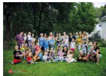
Inicjatywy lokalne - MAMY czas