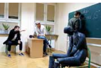
Teatr Polska - Słowo na G.