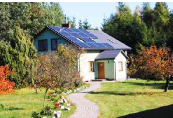
Nowa instalacja fotowoltaiczna na jednym z domów w Staszowie

Gmina pomaga również w pozyskaniu dotacji na OZE z innych źródeł. W urzędzie uruchomiono punkt informacyjny rządowego programu „Czyste Powietrze” dla wszystkich właścicieli nieruchomości jednorodzinnych zainteresowanych wymianą źródeł ciepła na nowoczesne, przyjazne środowisku naturalnemu instalacje. Przeszkoleni pracownicy urzędu udzielą wszelkich niezbędnych informacji na temat programu, zasad ubiegania się o dofinansowanie czy wymaganych dokumentów. Pomogą również w wypełnieniu wniosku o dofinansowanie i jego rejestracji na platformie elektronicznej,