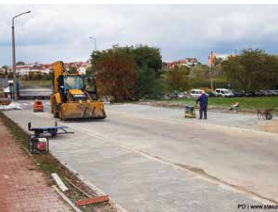
Budowa zatok postojowych na ul. Kollątaja