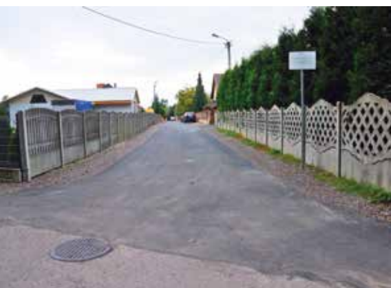
ul. Leśna w Staszowie

Gmina Staszów systematycznie poprawia stan dróg gminnych. Służą temu środki pozyskane z Ministerstwa Spraw Wewnętrznych i Administracji na usuwanie skutków klęsk żywiołowych.