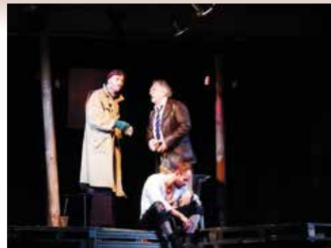
Teatr Polska - Kyś