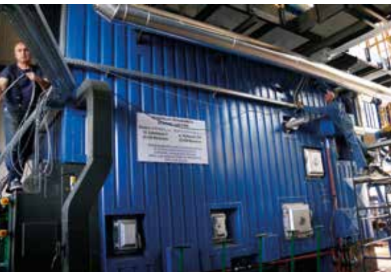
Jedna z inwestycji w „ciepło systemowe” w ZEC Staszów