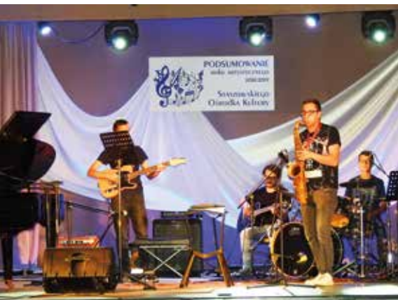
Zakończenie roku kulturalnego