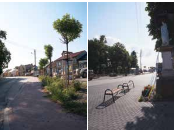
Rynek w Kurozwałkach po przebudowie