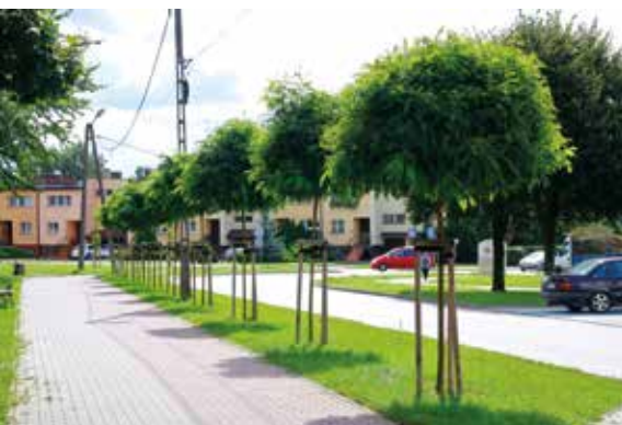
Szpalery drzew przy ul. Jana Pawła II