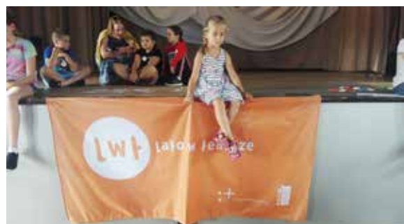
Lato w teatrze