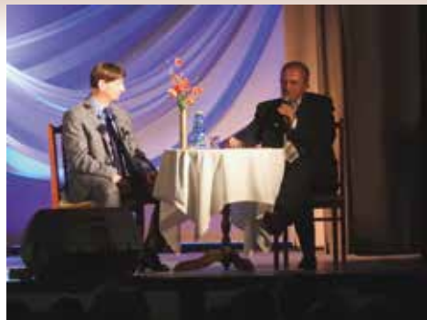
Promocja książki Józefa Żaka