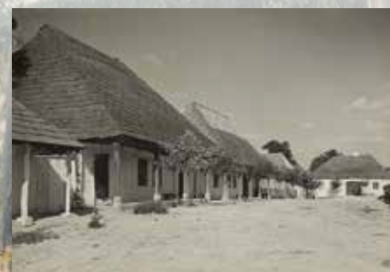
Dawny rynek w Kurozwękach („Jeszkotle”)