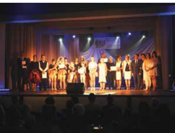
Zakończenie roku kulturalnego