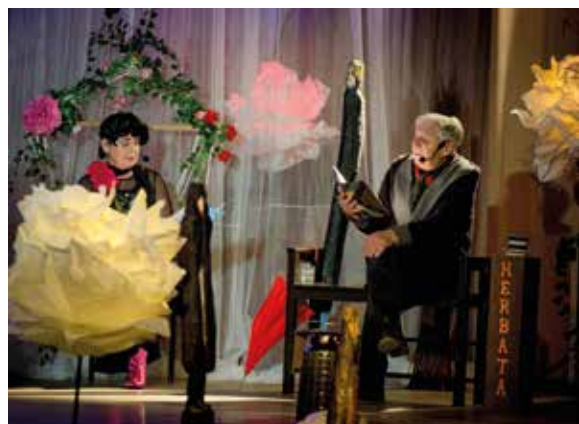
Kwiaty mojego ogrodu