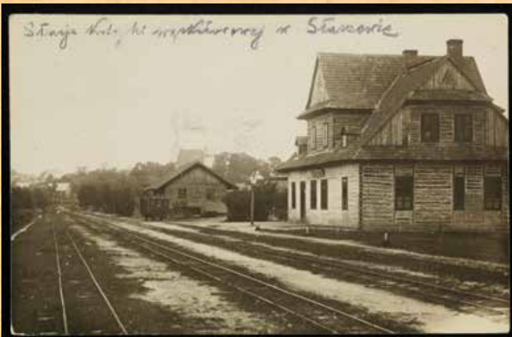
1929 r.- stacja kolejki wąskotorowej w Staszowie (okolice ul. Kolejowej)