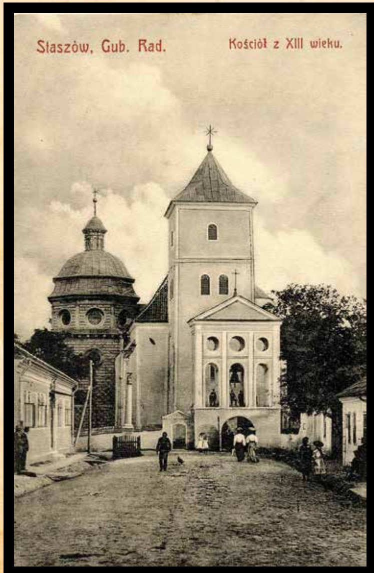
Przełom XIX i XX w.- kościół św. Bartłomieja i ul. Kościelna

Od bieżącego numeru Monitora Staszowskiego rozpoczynamy rubrykę poświęconą archiwalnej fotografii. Postaramy się pokazywać nasz region, jakim był w ubiegłym stuleciu i dziesięcioleciach.