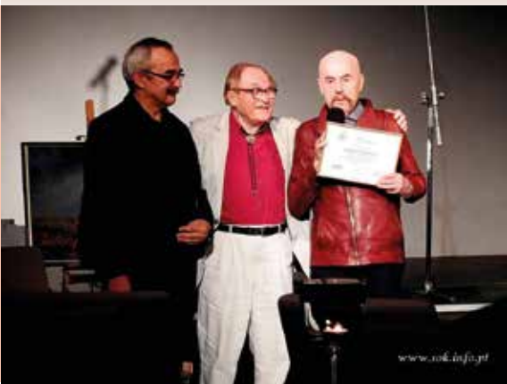
Festiwal Poezji Słowiańskiej