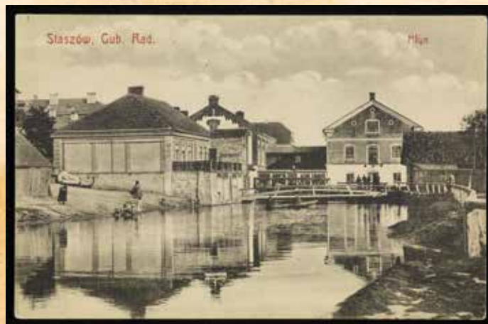
Przełom XIX i XX w.-młyn w Staszowie przy ul. Parkowej. (współautor: Slusarski, J. Ilustracje Projekt)