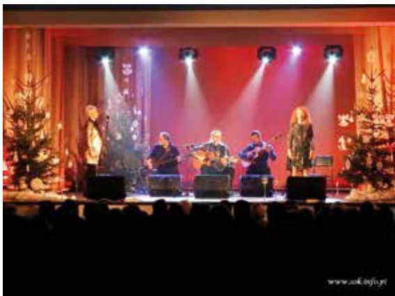
Festiwal Poezji Słowiańskiej