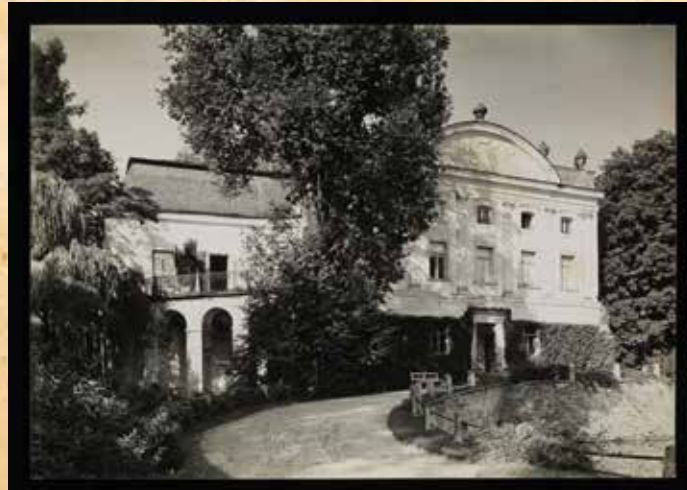
1936 r. - Kurozwęki, pałac Popielów