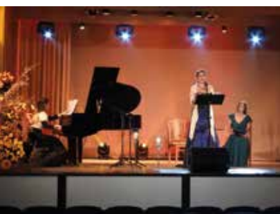
Mickiewicz w pieśniach