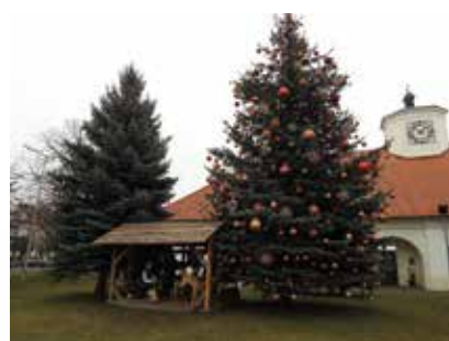
Bombki choinkowe zdobią staszowski rynek