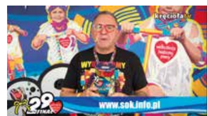
Sztab WOŚP przy SOK został zarejestrowany