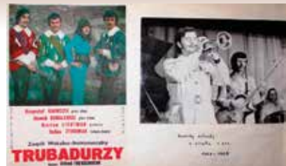
Jedna ze stron archiwalnej kroniki SOK ze strony www.archiwum.sok.info.pl