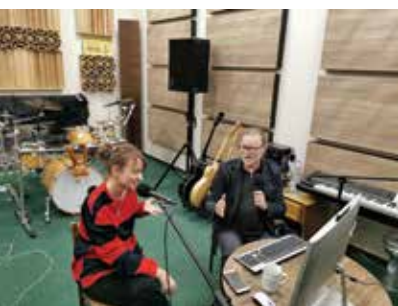
Spotkania nie tylko o sztuce