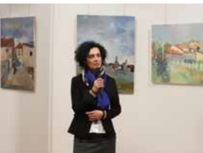
Magiczne miasteczko Szydłów 2020