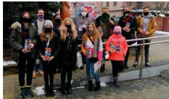
Wolontariusze Wielkiej Orkiestry Świątecznej Pomocy