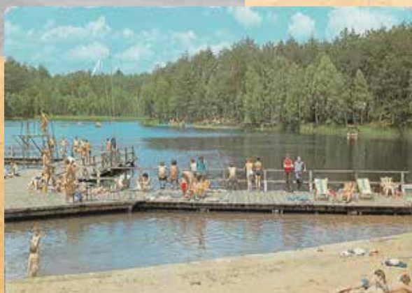
Pomosty na Dużym Stawie w latach 80.