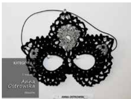
Jedna z nagrodzonych prac w konkursie na maskę karnawałową