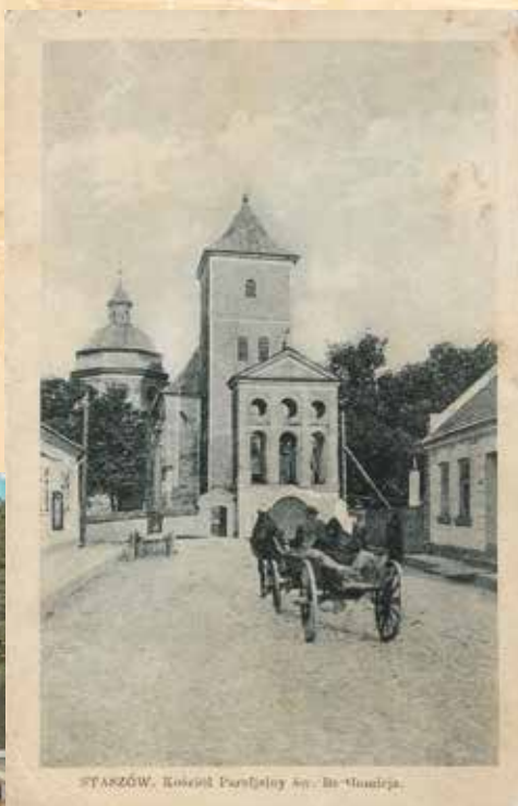
Kościół parafialny pod wezwaniem św. Bartłomieja i ul. Kościelna. Zdjęcie z około 1920 r.