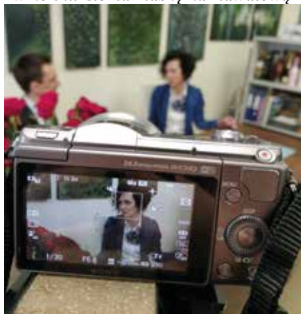
Staszowskie kobiety kultury