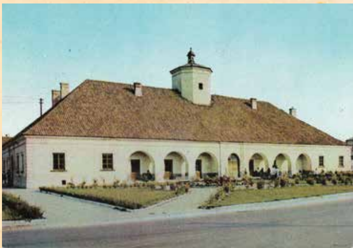
Sztaszowski Ratusz na początku lat 70. XX w. Biuro Wydawnicze „RUCH”, wg fotografii barwnej A. Stelmacha.