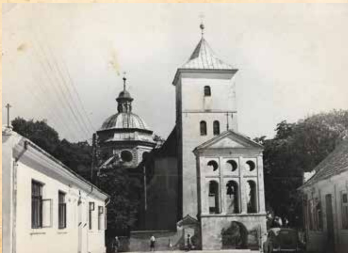
Kościół św. Bartłomieja i ul. Kościelna na pocztówce z 1955 r. Biuro Wydawnicze „Ruch”, fot. E. Hartwig.