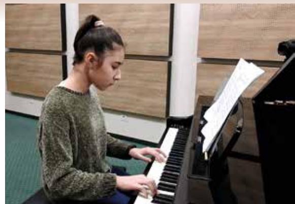
Prezentacje uczniów Music Park6

W okresie przed Świątami Wielkanocnymi SIT „Talent” i SOK przygotowali filmy z warsztatami dla dzieci i młodzieży zatytułowane: „Ale jaja!” Na poważnie” oraz „Ale jaja! Z przymrużeniem oka”. Do realizacji kolejnego dołączyło Koło Gospodyń Wiejskich w Oględowie, które przygotowało warsztaty