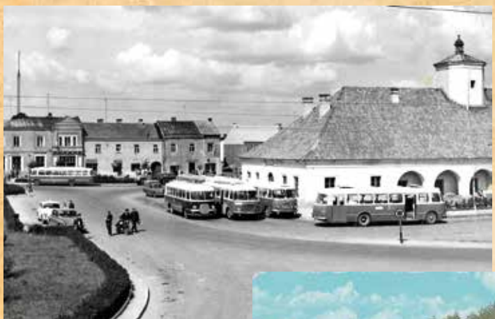
Dworzec autobusowy znajdował się na sztaszowskim Ryнку do początku lat siedemdziesiątych XX w.