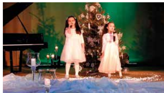
Przegląd kołęd i pastorałek