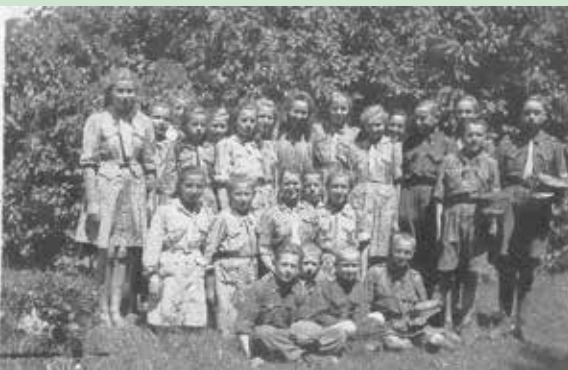
Wiśniowa, bzy za ogrodzeniem kościelnym. Zbiórka harcerek i harcerzy w maju 1946 roku.