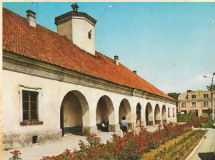
Sztaszowski Ratusz od strony wschodniej w latach 70 XX w.