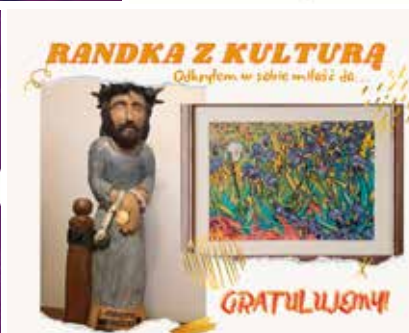
Plakaty z różnych wydarzeń, realizowanych przez Staszowski Ośrodek Kultury