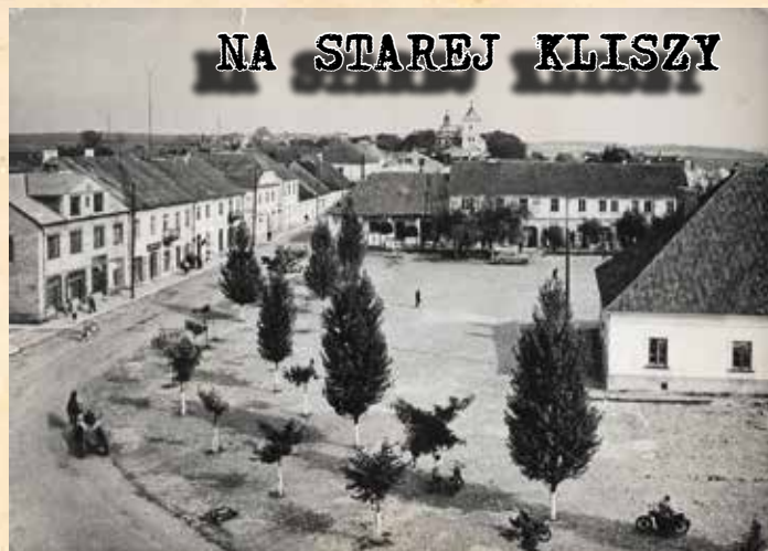
Rynek na pocztówce z lat 60. Biuro Wydawnicze „Ruch”, Fot. K. Jabłoński.