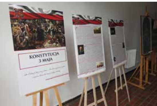
Wystawa z okazji rocznicy uchwalenia Konstytucji 3 Maja.