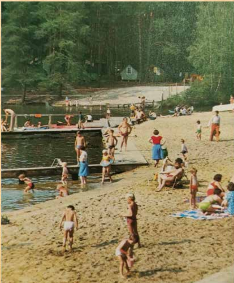
Plaża nad Dużym Stawem w Golejowie na pocztówce z lat 80. Krajowa Agencja Wydawnicza, fot. M. Wideryński.