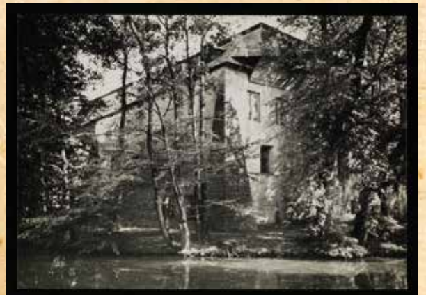
Kurozwęki w 1936 r. Droga do kościoła Wniebowzięcia Najświętszej Marii Panny, Pałac Popielów.