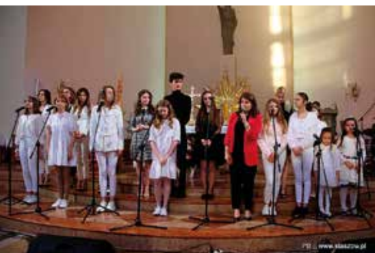
Koncert Alleluja! Chwała Panu!

Frekwencja dopisała. Przybyło wiele dzieci i młodzieży wraz z rodzicami. Pośród stoisk, karuzel, dmuchanych zjeżdżalni przygotowano główną atrakcję: aeropiknik. A na nim m.in. ekspozycję sprzętu lotniczego, symulatory lotów (w tym VR), żyroskop, replikę lotni Lilienthala, pokaz latawców, balonowy trening pokazowy, gry i zabawy lotnicze oraz lot balonem na uwięzi. Późnym popołudniem ku górze uniosły się 2 balony, które przy zachodzie słońca