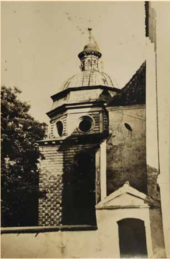
Renesansowa kaplica Tęczyńskich na pocztówce z lat 60. Wydawnictwo Polskiego Towarzystwa Turystyczno-Krajo- znawczego, fot. T. Przykowski.