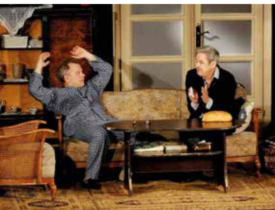
Pół na pół