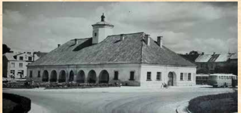
Staszowski Rynek na kartkach pocztowych z lat 60. Biuro Wydawnicze RUCH, fot. J. Korpal.