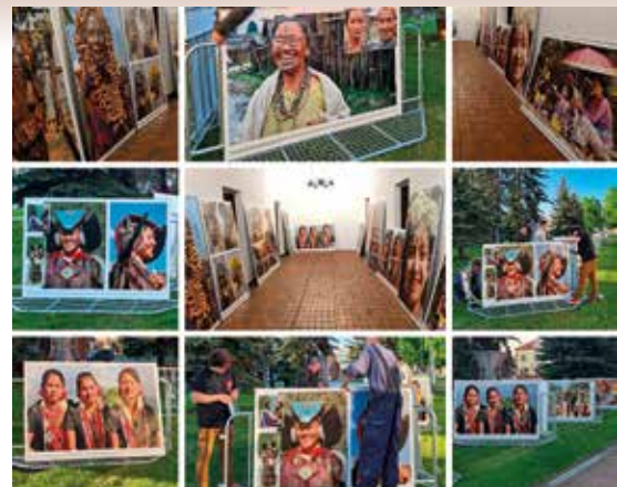
Co robią kobiety...

Wiele osób posiada smartfony, nie wykorzystując w pełni ich możliwości. SOK oraz SIT postanowili przygotować zajęcia edukacyjne w tym zakresie,