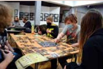
Staszowski Klub Gier Fabularnych ARCANUM

kańcami przygotowaliśmy ozdoby choinkowe wykonywane w różnych technikach. Prace zostały wykorzystane do wspólnego ubierania choinki podczas jarmarku bożonarodzeniowego.