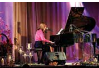
Koncert Moniki Urlik