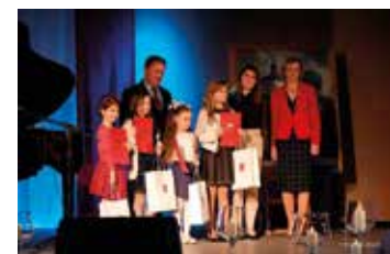
Laureaci w jednej z kategorii I Świętokrzyskiego Przeglądu Pieśni i Piosenki Niepodległej