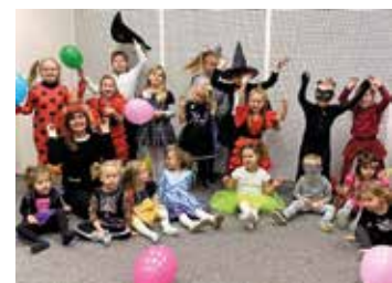
Wróżby, wróżki i wróżbici... - podczas zabawy andrzejkowej