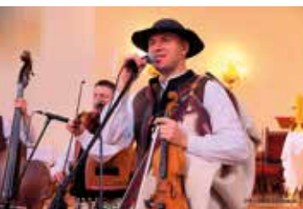
Zespół Góralska Hora