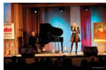
Koncert finałowy I Świętokrzyskiego Przeglądu Pieśni i Piosenki Niepodległej