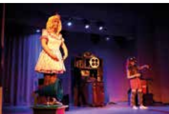
W pracowni Świętego Mikołaja