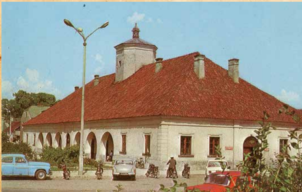
Lato na staszowskim Rynku pod koniec lat 70.