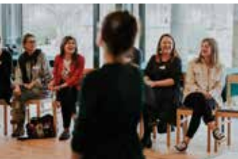
„Zaproś nas do siebie” - Radziejowice 2022