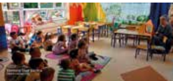
Baśnie, bajki, bajeczki