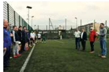
Nocny Turniej Piłki Nożnej