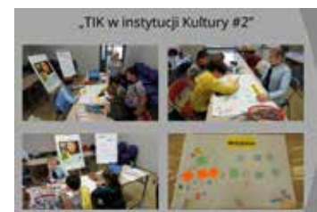
-TIK w instytucji Kultury #2