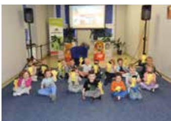
Podróże po dziecięcej literaturze