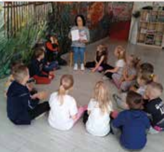
Baśnie, bajki, bajeczki