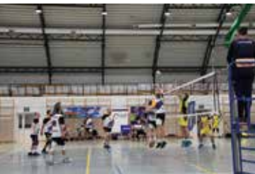
Niepodległościowy Turniej w Piłce Siatkowej