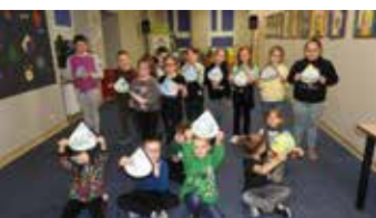
Światowy Dzień Ziemi