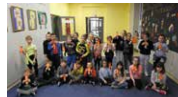
„Książka jest dobra na wszystko”