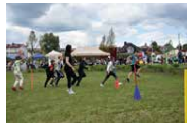
Dzień Dziecka na sportowo