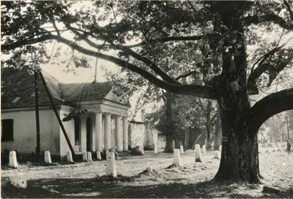
Fragment parku i oficyna przy Palacu w Kurozwałkach. Poczтівka z lat 60. PTTK, Zakład Wytwórczy w Jaśle, fot. K. Jabłoński