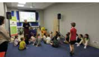
W świecie pszczół

oraz uczniowie. Obchody Dnia Bibliotekarza są doskonałą okazją do podsumowania działalności biblioteki na rzecz upowszechniania czytelnictwa i pełnienia roli instytucji pozwalających na zaspokojenie różnorodnych potrzeb w zakresie uczestnictwa w kulturze. Zgromadzeni goście z uwagą obejrżeli i wysłuchali prezentacji multimedialnej z dotychczasowej działalności biblioteki. Działania pracowników Biblioteki zostały docenione brawami i serdecznymi życzeniami niegasnącego entuzjazmu, wytrwałości i dalszych kreatywnych działań w propagowaniu czytelnictwa. Spotkanie uświetnił występ artystyczny w wykonaniu uczniów klasy III „b” z Publicznej Szkoły Podstawowej nr 2 w Staszowie.