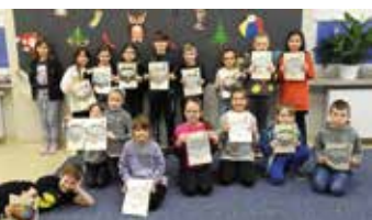
Wiosna w Bibliotece