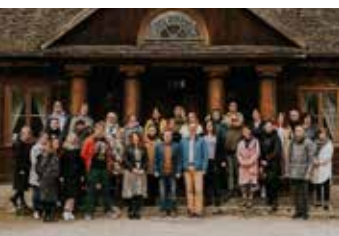
„Zaproś nas do siebie” - Radziejowice 2022