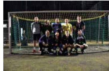
Nocny Turniej Piłki Nożnej