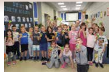
Literacki bukiet dla mam