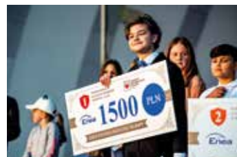
„Enea wspiera muzyczne talenty”