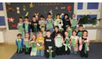
Wiosna w Bibliotece