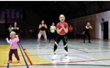
Staszów dla Ukrainy