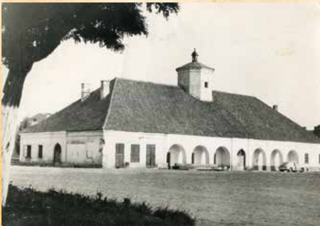
Staszowski Ratusz na kartce pocztowej z 1963 r. Biuro wydawnicze „RUCH”, fot. E. Hartwig