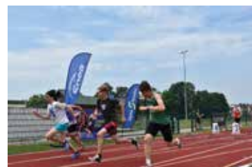
Indywidualne Mistrzostwa Województwa Świętokrzyskiego w Lekkiej Atletyce