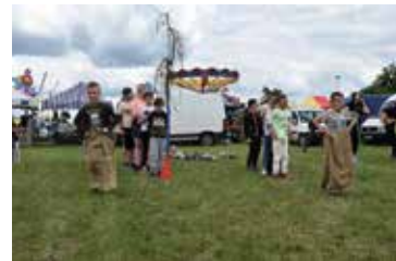
Dzień Dziecka na sportowo