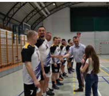
Niepodległościowy Turniej w Piłce Siatkowej