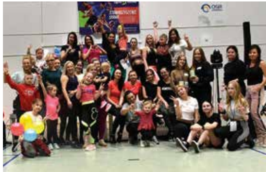
Staszów dla Ukrainy