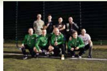
Nocny Turniej Piłki Nożnej

Na stadionie lekkoatletycznym w Staszowie odbyły się dwudniowe Indywidualne Mistrzostwa Województwa Świętokrzyskiego w Lekkiej Atletyce Szkół Podstawowych roczniki 2007 - 2008 dziewcząt i chłopców. Rywalizowało ze sobą ponad 300 zawodników i zawodniczek z klas 7 i 8. Do udziału w rywalizacji zgłosili się najlepsi lekkoatleci z całego województwa, zwycięzcy poszczególnych eliminacji powiatowych rozegranych w maju. Konkurencja była bardzo duża. Zawody mogły zostać przeprowadzone dzięki finansowemu wsparciu Grupy ENEA Elektrowni Połaniec S.A., Urzędu Miasta i Gminy w Staszowie, oraz Marszałka Województwa Świętokrzyskiego. W pierwszym dniu zawodów rozegrane zostały biegi na dystansie 100 metrów, skok wzwyż, pchnięcie kulą, sztafeta 4×100