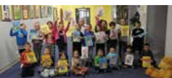
Wiosna w Bibliotece