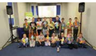
„Nas skrzydlaci przyjaciele”