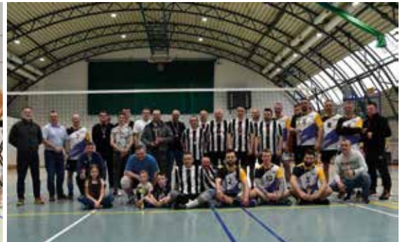
Niepodległościowy Turniej w Piłce Siatkowej