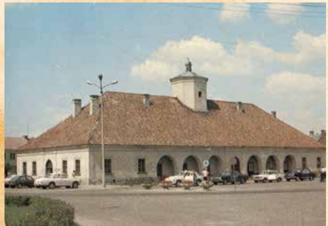
Staszowski Ratusz w latach 70