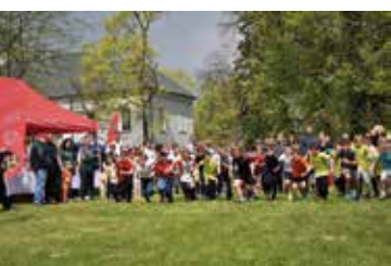
Bieg do „Serca Kołłątaja”, w kat. dzieci i młodzieży