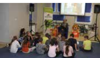
„Nas skrzydlaci przyjaciele”