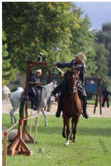
Rekonstrukcja Bitwy o Staszów 1863