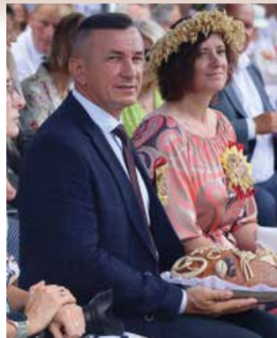
Dni Chleba - Smaki naszych dziadków 2023