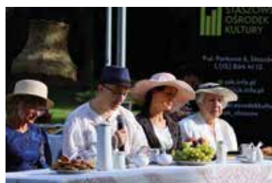
Narodowe Czytanie 2023