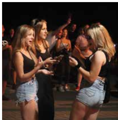
Potańcówka na dechach