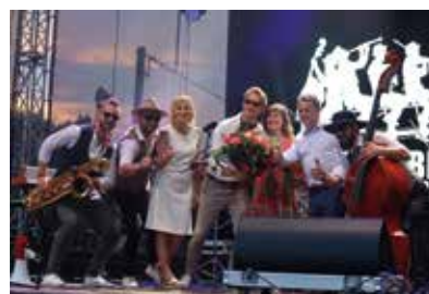
Dni Chleba - Smaki naszych dziadków 2023