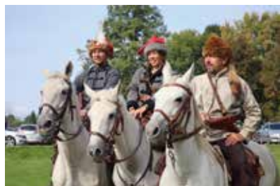
Rekonstrukcja Bitwy o Staszów 1863