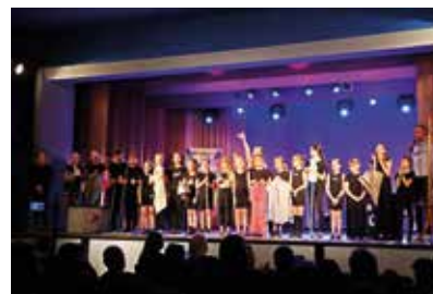
„Tchnąć w nie życie – warsztaty teatralne”

1 sierpnia, godz. 17.00 – godzina „W”, akcja „Burza”. W Parku im. A. Bienia rozpoczęto happening nawiązujący do Powstania Warszawskiego. Wspólną modlitwą poprzedzono dumnie odśpiewanym hymnem państwowym. Koncert „niezakazanych” piosenek z lat 40. XX wieku zaprezentowali staszowscy harcerze. Do