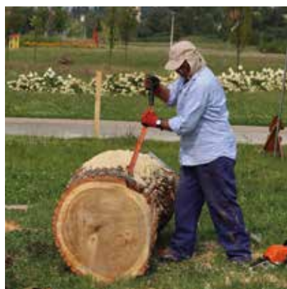
Staszowski plener rzeźbiarski