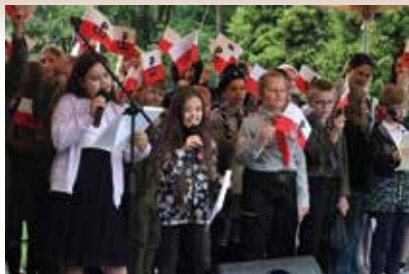
Wspomnienie sierpniowych dni