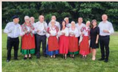
Przeгляд Zespołów Folklorystycznych w Sichowie Małym pn. „Zaspiewajmy Razem w Sichowie”