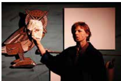
Ciotka Wieża - spektakl