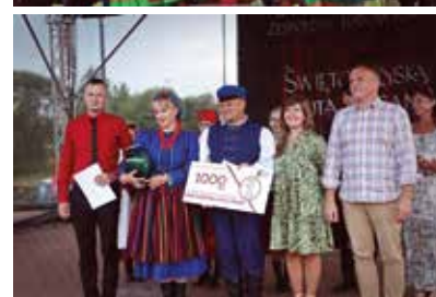
II Staszowski Przegląd Zespołów Ludowych zatytułowany „Świętokrzyską Nutą Pisane”