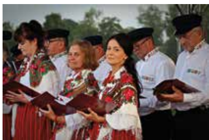
VI Staszowskie Spotkania z Kulturą Łowiecką