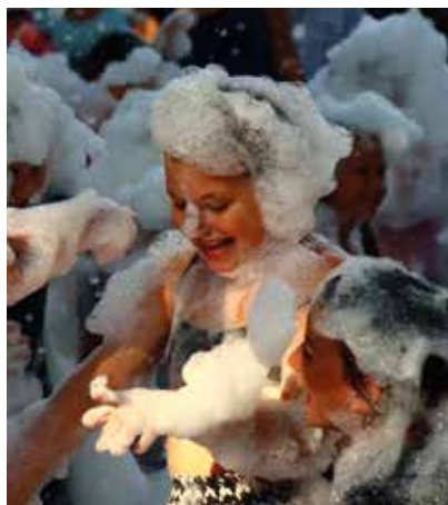
Centrum mobilno-eventowe FRAJDA

wspólnego śpiewania żołnierskich pieśni zachęcały publiczność wokalistki Klubu Piosenki „Rytm” SOK. Członkowie Stowarzyszenia Rekonstrukcji Historycznej „Avito Vivit Honore” zaprezentowali się w umundurowaniu oraz uzbrojeniu, jakim dysponowali powstańcy, natomiast grupa rekonstrukcyjna „Die 29. Falke-Division” z Kielc prezentowała się w umundurowaniu niemieckim. Ogromne wrażenie na widzach zrobił strzelający karabin MG 42, zwany „piłą tarczową Hitlera”. Jako nagrodę za udział w lekcji historii najmłodszy mogli zabrać ze sobą na pamiątkę łuski po wystrzelonych nabojach.