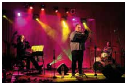
Koncert Jazz Bach Collective