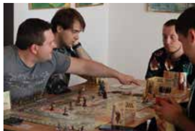
Konwent Miłośników Fantastyki i Popkultury Ar-Con 2023