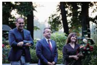
Arie i duety z musicali oraz przeboje muzyki filmowej