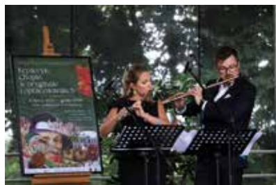
Fryderyk Chopin w oryginale i opracowaniach