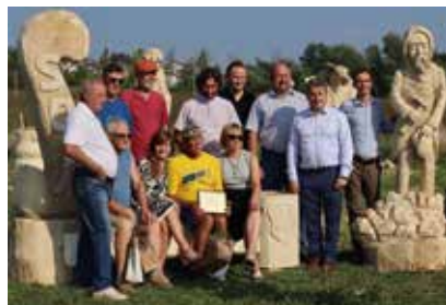
Staszowski plener rzeźbiarski