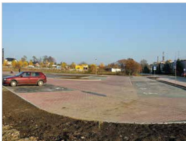
Parking przy ul. Spokojnej (Nowotki)