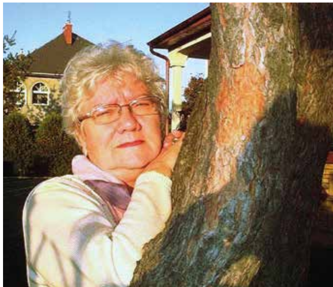
Autorka tekstu i ... drzewo

środowiska i ponosi odpowiedzialność za spowodowane przez siebie jego pogorszenie.