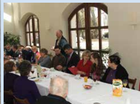
Poczęstunek na zakończenie