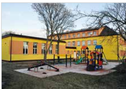
Szkoła w Kurozwałkach