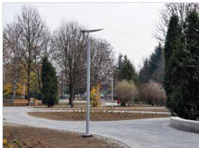
Park im. Adama Bienia