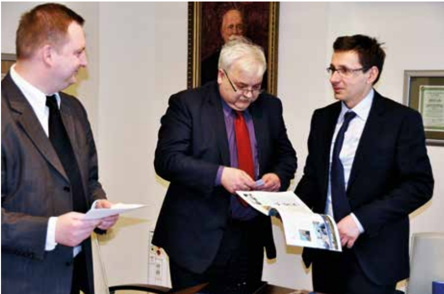
Spotkanie w Ministerstwie Skarbu Państwa. Na zdjęciu podsekretarz Stanu Rafał Baniak, burmistrz Romuald Garczewski, minister Skarbu Państwa Mikołaj Budzanowski

W dniu 14 marca 2012 r. burmistrz Romuald Garczewski podpisał z ministrem Skarbu Państwa Mikołajem Budzanowskim umowę, na mocy której gmina Staszów przejęła spółkę PKS w Staszowie.