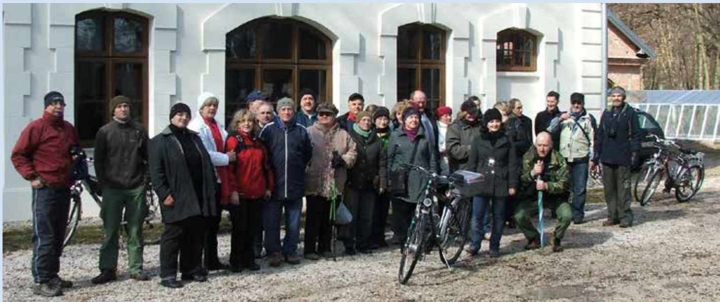
Uczestnicy i organizatorzy Babskiego Rajdu przy pałacu w Sichowie