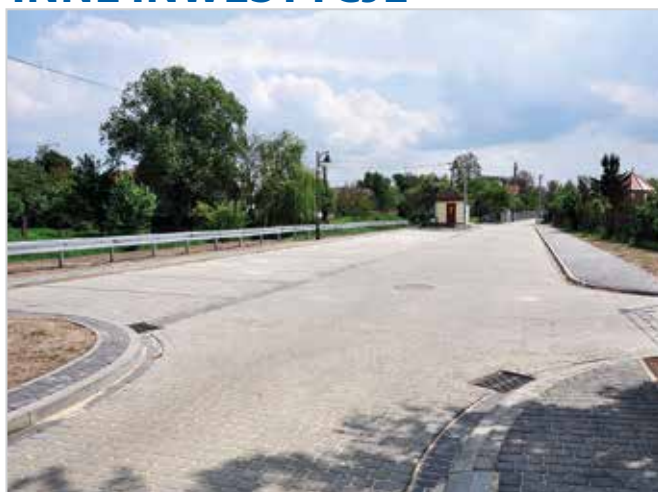
Przebudowa ulicy Łazienkowskiej w Staszowie Wartość zadania: 671 200,00 zł