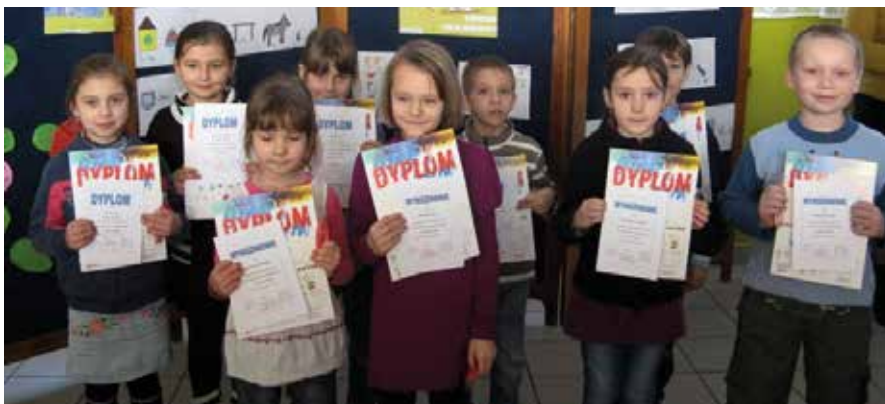
Młodzi uczestnicy kampanii