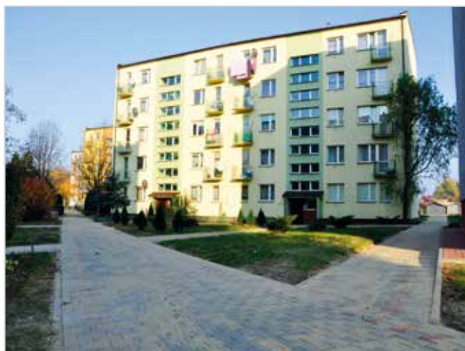
Jeden z nowych chodników na os. Północ