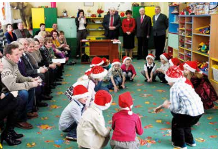
Dzień Babci i Dziadka w przedszkolu Nr 8 im. J.Ch. Andersena