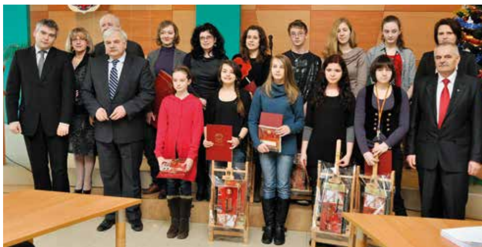
W trakcie Sesji zostali wyróżnieni młodzi artyści ze Staszowskiego Ośrodka Kultury, którzy przeprowadzili akcje malowania wiat śmietnikowych w Staszowie.

Treść uchwał podjętych na sesji dostępna jest w Biuletynie Informacji Publicznej pod adresem: http://www.bip.staszow.pl