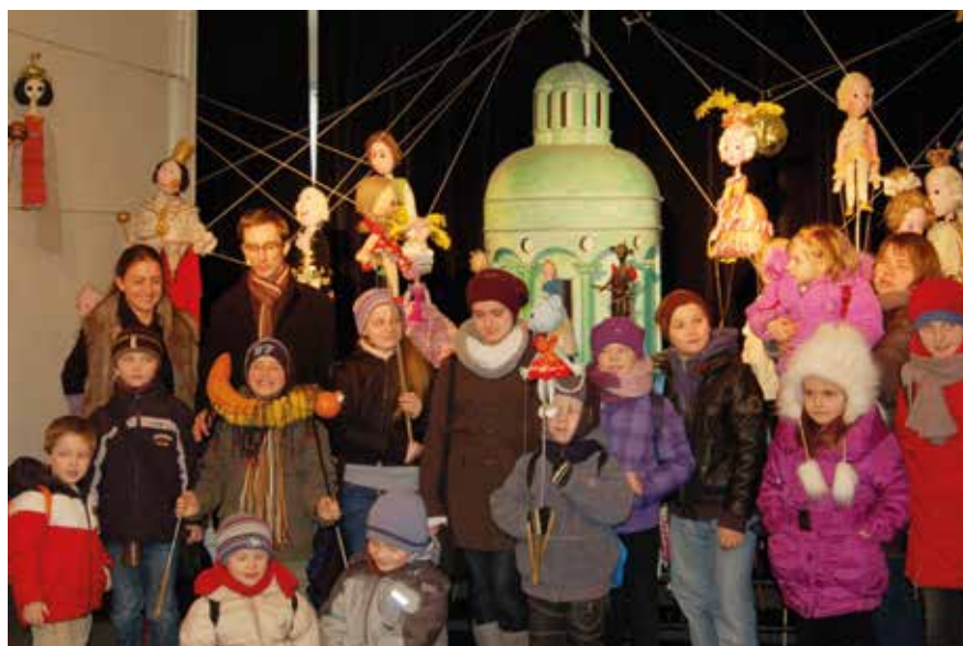
Podczas lekcji teatralnej