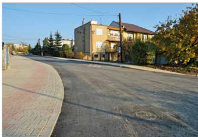
ul. Legionów Polskich