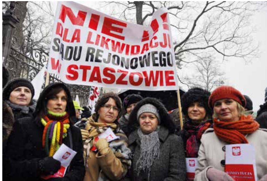
Pracownice Sądu Rejonowego w Staszowie