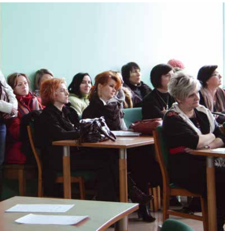
W XX Sesji uczestniczyło wiele osób zainteresowanych reorganizacją szkół.