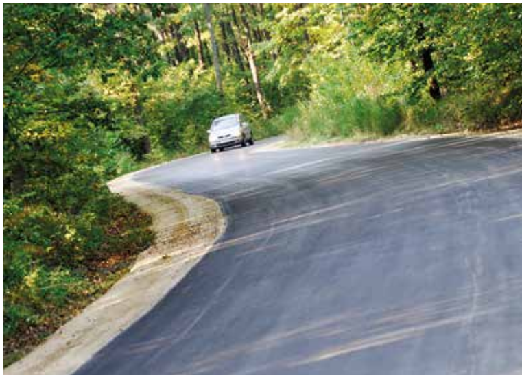
Jedna z wspólnie wykonanych dróg

traktach komunikacyjnych, które znajdują się w zarządzie Powiatu Staszowskiego. Dzięki współpracy samorządów, możliwe jest pozyskiwanie środków zewnętrznych, m.in. z Narodowego Programu Przebudowy Dróg Lokalnych (NPDŁ) oraz innych źródeł np. ze środków europejskich, MSWiA na usuwanie skutków klęsk żywiołowych, czy z subwencji ogólnej budżetu państwa. Gmina Staszów współfinansuje zadania, przekazując zazwyczaj od 10% do 50% wartości zadania. Bez takiej