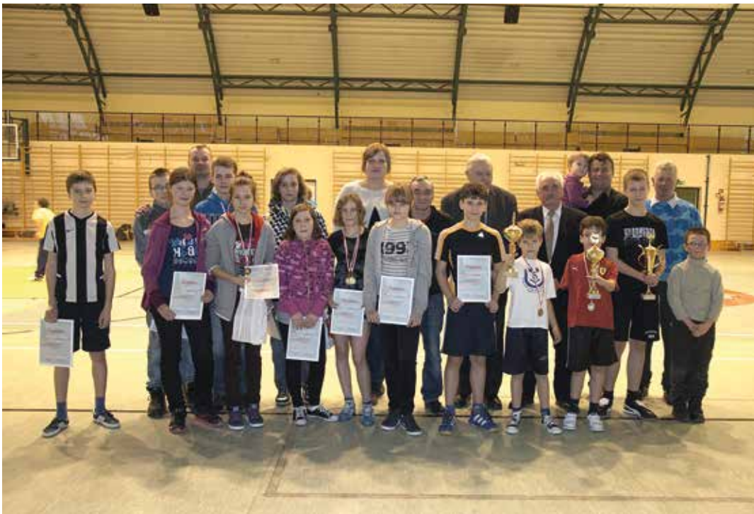
Uczestnicy I Integracyjnych Zawodów Sportowych