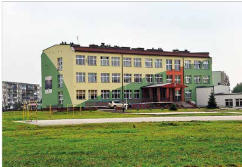
PSP nr 3 w Staszowie, im. Hieronima Łaskiego