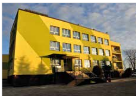
Szkoła w Koniemłotach