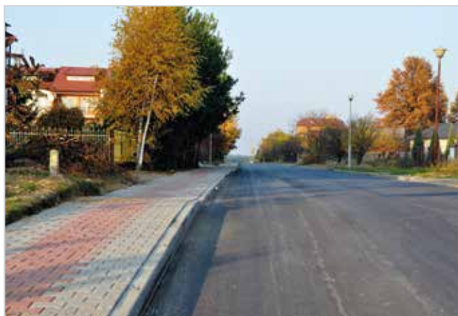
ul. Łącznik (PKWN)