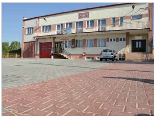
- Utwardzenie placu przy Domu Strażaka w Woli Osowej. Wartość zadania: 60 528,30 zł