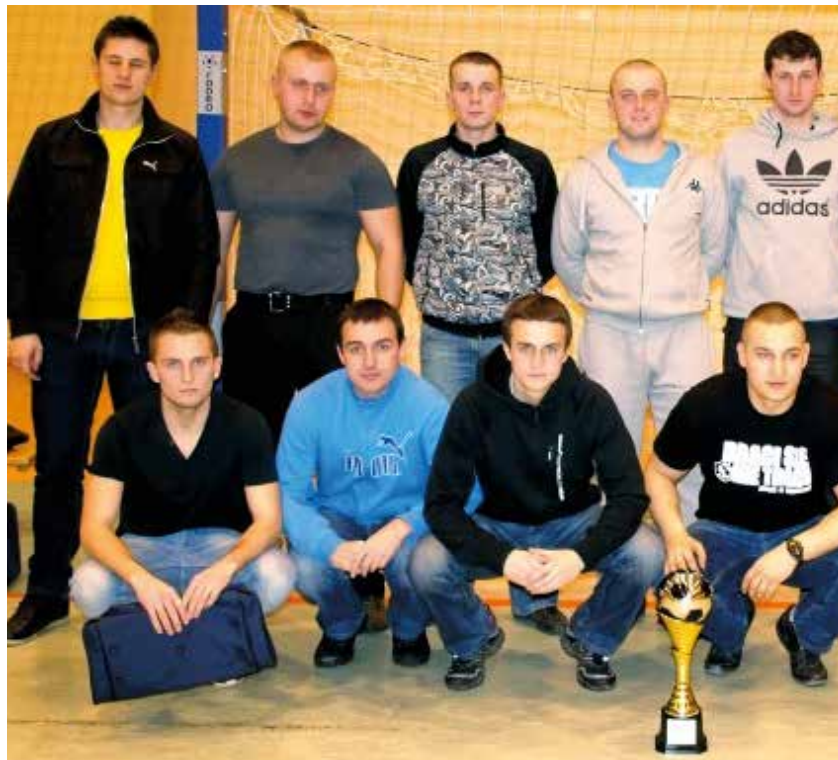
Zwycięska drużyna IV Edycji SLH United

Po zakończeniu ligi tabela SLH przedstawia się następująco: