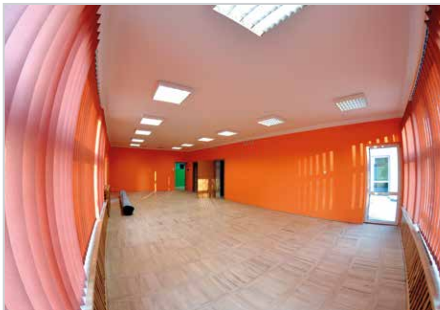
Sala żłobka w budynku Przedszkola Nr 8

Całkowity koszt adaptacji i wyposażenia pomieszczeń budynku około 300 tys. zł.