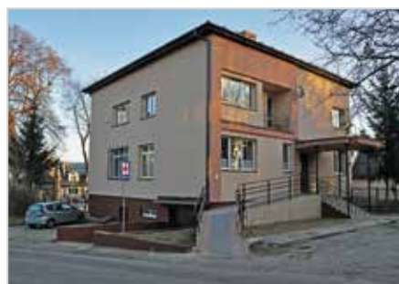
Ośrodek Zdrowia w Kurozwałkach