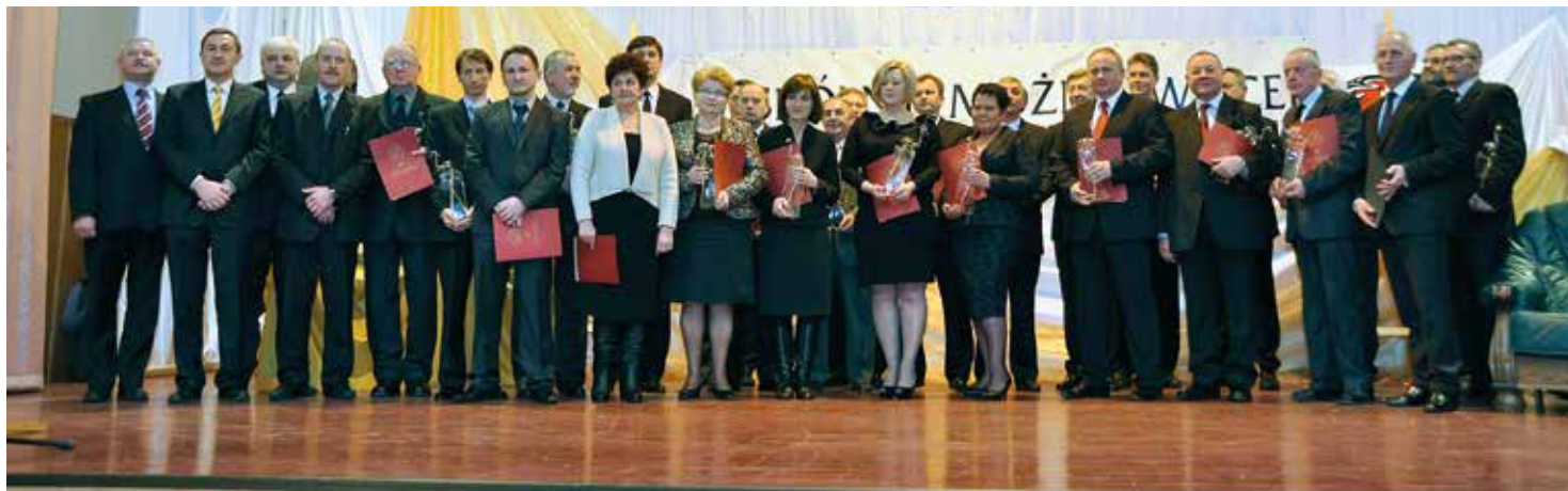
Laureaci tegorocznych Staszowskiej Izby Gospodarczej