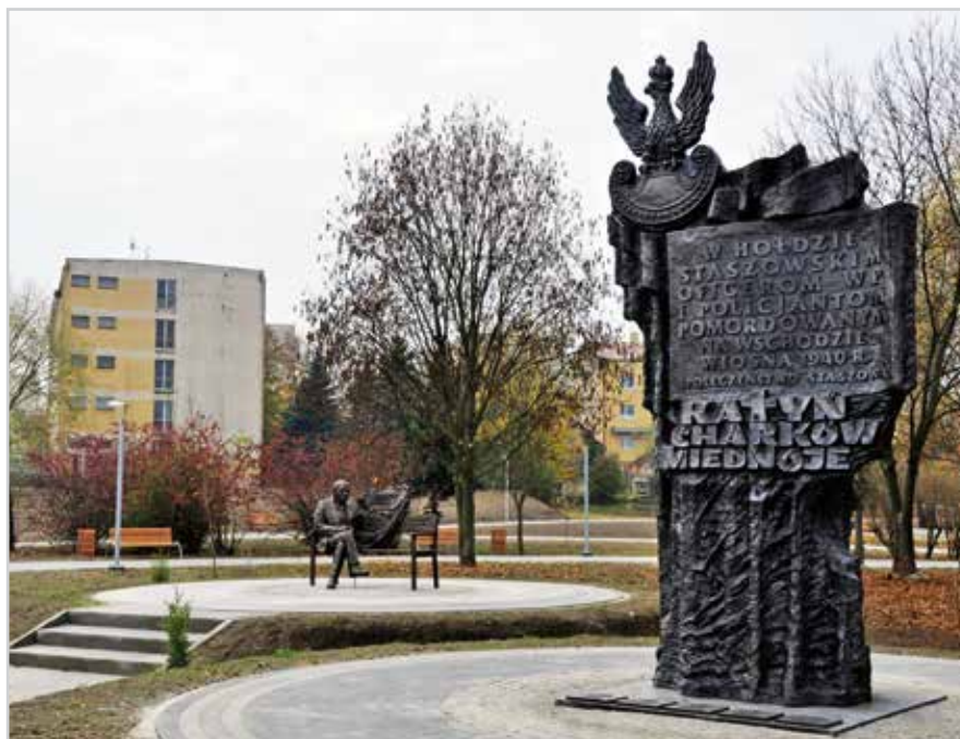
Park im. Adama Bienia