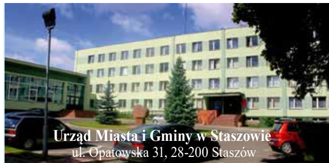
Urząd Miasta i Gminy w Staszowie ul. Opatowska 31, 28-200 Staszów

Treść uchwał podjętych na sesji dostępna jest w Biuletynie Informacji Publicznej pod adresem: http://www.bip.staszow.pl