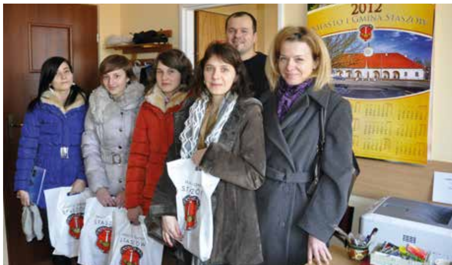
Uczestniczki projektu z wizytą w Biurze Promocji UMig Staszów