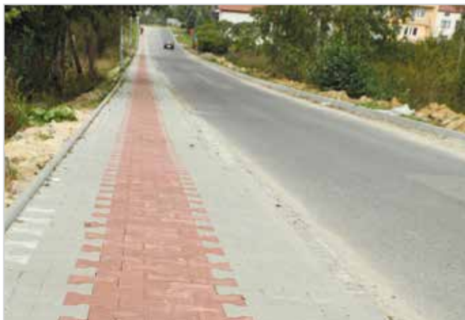
ul. Łącznik w Staszowie