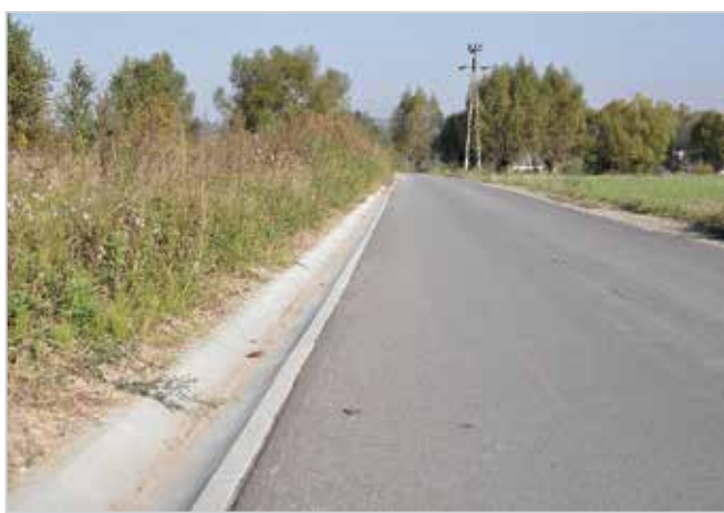
Wiązownica Duża - Granicznik