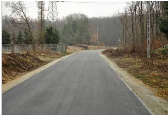
ul. Kościuszki w Staszowie