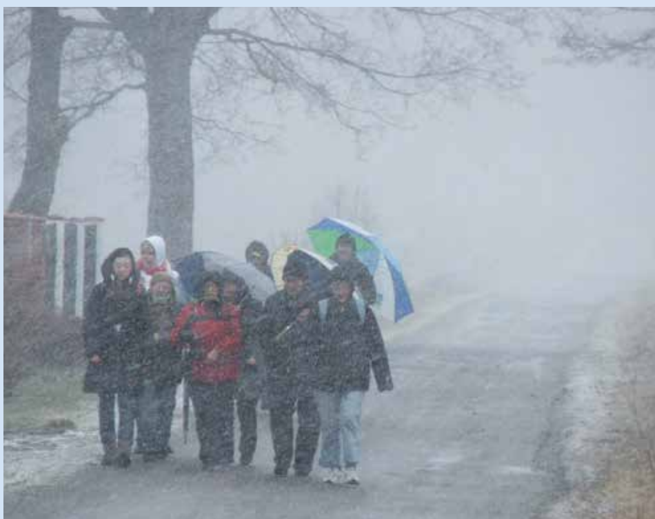
Uczestniczek nie zniechęciła nawet dość kapryśna pogoda.